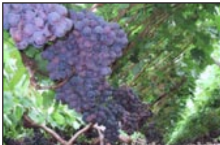
Slika 7-RED GLOBE CRVENI

Korištenje i gospodarsko značenje: Na tržištu ga se može nabaviti od kolovoza do siječnja. Dozrijeva od kolovoza do studenog. Zbog svojih izuzetnih osobina ima odlične marketinške efekte. Do ranih devedesetih godina bilo je popularno na Dalekom Istoku i Aziji, gdje ljudi vole krupnije voće, a odnedavno se širi dosta brzo na američkom tržištu, unatoč tome što ima sjemenke.