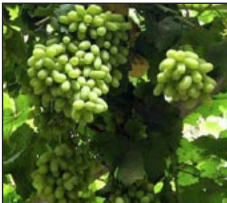
Slika 6-THOMPSON SEEDLESS BIJELI

Botanička obilježja: Grožđe je svijetlozeleno, četvrtastog oblika, dugačko, krupno, rastresito i slatkog okusa. Besjemena sorta.