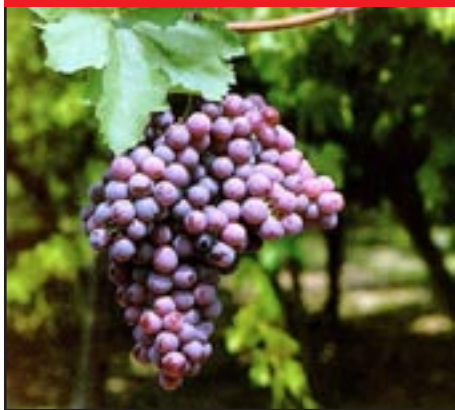
Slika 9-PERLON CRVENI

klime. U našim sjevernim područjima pripisivale su joj se svojstva koja ne posjeduje, naročito ona koja se odnose na veću rodnost, otpornost na bolesti i bolji transport.