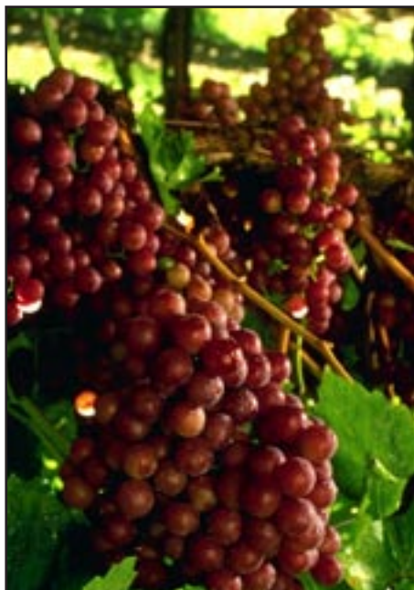
Slika 3-FLAME SEEDLESS

Međutim zbog velike rodnosti, preporučljiv je kraći rez s manjim opterećenjem rodnog drva. Veća opterećenja imaju za posljedicu dobivanje produljenih i odviše rastresitih grozdova koji nemaju veliku tržišnu vrijednost. Tehnološke karakteristike te sorte očituju se u malom sadržaju šećera i ukupnih kiselina, što omogućuje da se plasira na tržište prije njene pune zriobe. Otpornost na smrzavice slaba, ali se dobro regenerira. Rađa i na zapercima. Sklon je pucanju bobica pred zrenje u slučaju kišnog vremena. Osjetljiv na Botrytis , na druge bolesti osrednja. Srodnost s podlogama dobra, naročito prema Berlandieri x Rupestris .