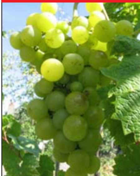
Slika 1-ČABSKI BISER BIJELI

Korištenje i gospodarsko značenje: Jedna od najranijih stolnih sorata na prostoru naše države, čija je vrijednost upravo u ranom dozrijevanju, a ne u nekim općim pozitivnim svojstvima. Lako podliježe napadu osa i pčela i slabo podnosi transport. Grožđe je slatko i ima vrlo finu aromu. Sorta ima jedino lokalni karakter.