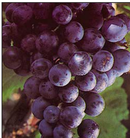
Slika 13-MUŠKAT D'ADDA CRNI

Botanička obilježja: Vršci mladica bijelovunasti. Cvijet dvospolan. List velik, vrlo širok, glatkog lica i lagano paučinastog naličja. Zreo grozd valjkasto čunjast, rastresit, često sa sugrozdićem. Bobice velike, okrugle ili lagano jajolike, crne boje. Kožica vrlo čvrsta. Meso gusto s laganim muškatnim okusom.