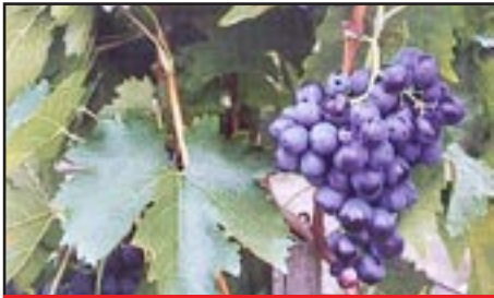
Slika 11-MUŠKAT HAMBURG CRNI

Porijeklo i rasprostranjenost: Potječe iz Engleske, gdje se uzgaja u staklenicima. Raširen manje-više u svim vinogradarskim zemljama.