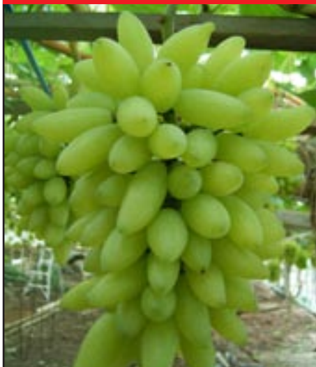
Slika 17-KRIVALJA BIJELA

Korištenje i gospodarsko značenje: Stolna sorta visoke kvalitete, no koristi se vrlo uspješno za sušenje, a katkad i za popravak drugih vina zbog svoje vrlo izražene muškatačne arome. Dobro podnosi transport. Proizvode vrlo visokih vrijednosti može dati samo u vrlo toplom podneblju.