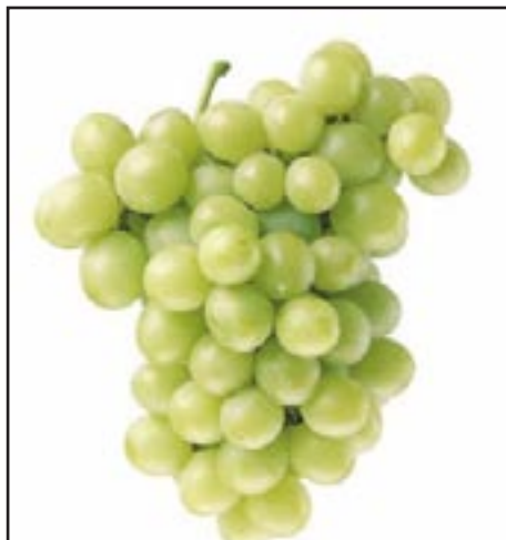
Slika 2-PERLETTE BIJELA

Botanička obilježja: Grozd je ovalna oblika, oko 300 g, bobica je okrugla, bez koštica, mesnata, sitnija, zelenkasto-žute boje, izrazito muškatale arome.