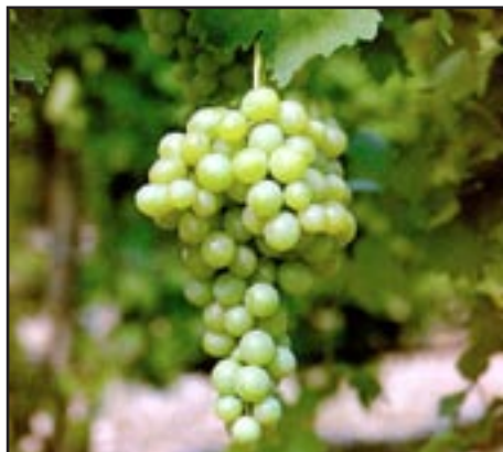
Slika 14-ITALIJA BIJELA