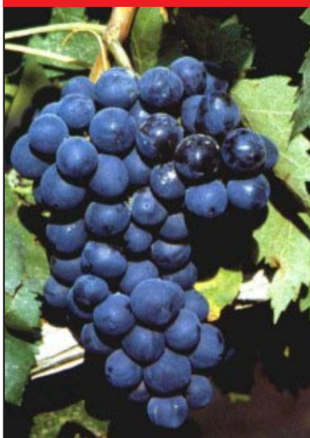
Slika 10-ALPHONSE LAVALLÉE CRNI

Sinonimi: Muscat de Hamburg, Moscato di Amburgo