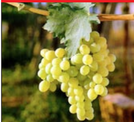
Slika 5-MATILDE BIJELA

600 grama, cilindričan s prigrizdom. Bobice su debele i okrugle, blago produžene i hruskave. Izrazito žute do blagocrvenkaste boje, fine muškatačne arome.