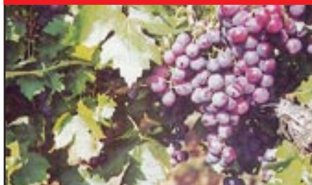
Slika 4-CARDINAL CRVENI