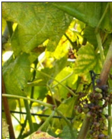
Slika 2.4: Sušenje grozda uzrokovano zaraženošću fitoplazmom.

Kod prenošenja fitoplazme vektorom, u ovom slučaju Flavescence doree (FD), sa zaraženih trsova na zdrave trsove razlikujemo nekoliko faza: