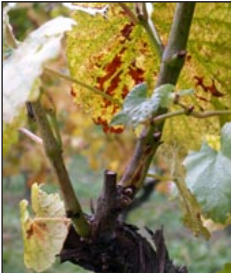
Slika 2.2: Snimak mladice zaražene fitoplazmom.

Na listovima se simptomi očituju u obliku karakterističnog trokutastog, crijepastog ili srolikog oblika zbog uvijanja krajeva plojke prema naličju lista. Staklastog su ili specifično masnog izgleda, vrlo lako lomljivi (“hrskavi”). Ovisno o sorti, javljaju se različiti stupnjevi promjene boje razlaganjem klorofila (zelenog pigmenta) i pojavom karotenoida (žuti pigment) i antocijana (crveni pigment). Tako se kod bijelih sorata javljaju različiti stupnjevi promjene boje - od svijetlozelenih do žutih i zagasitih tonova, naročito oko nervature lista. Kod crnih sorata promjene boje su prema različitim nijansama svijetlog do tamnog crvenila. Nije rijetkost da te promjene boje dovedu i do nekroze tkiva plojke.