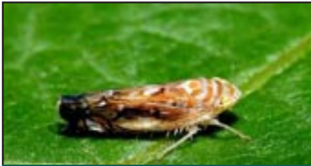
Slika 2.5: Scaphoideus titanus Ball ( http://www.chem.bg.ac.yu )

nalazi u probavnom sustavu vektora gdje se umnožava te nakon prolaska kroz hemolimfu naseljava i različite unutarnje organe kao što su žlijezde slinovnice, torakalni gangliji i masna tjelešca; vektor postaje infektivan.