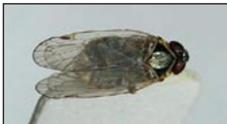
Slika 2.7: Hyalesthes obsoletus Signoret ( http://www.chem.bg.ac.yu )

Osim načina širenja zaraze putem vektora, postoji još jedan za vinogradarstvo važan način prenošenja infekcija, a uz to su vezane i razne fitosanitarne mjere kojima se uvelike može utjecati na smanjenje rasprostiranja fitoplazmi. Taj način širenja zaraze je putem vegetativnog razmnožavanja reznicama i cijepljenjem, to jest sadnim materijalom.