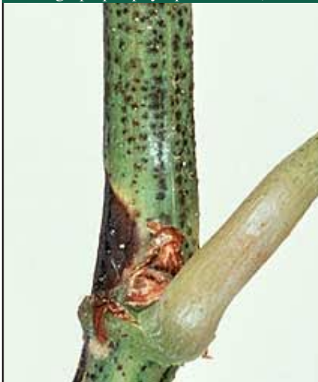
Slika 2.3: Snimka pustula na mladici ( http://www.agf.gov.bc.ca/cropprot/grapeipm/phytoplasma.htm )

Sve cvati se na zaraženim mladicama vinove loze u potpunosti suše i određeno vrijeme ostaju tako posušene na trsu.