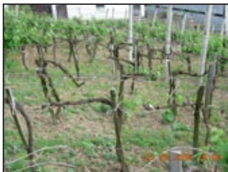
Sl. 1. Eutypa lata . Izgled vinograda s osušenim čokotima zbog jakog napada ovog patogena.

Imajući to u vidu, ali i činjenicu da gore navedene karakteristične simptome navedene biljne vrste iz familije Vitaceae može uzrokovati nekoliko različitih vrsta gljiva, i to Phomopsis viticola (uzročnik ekorkioze vinove loze), gljive iz roda Botryosphaeria (uzročnici raka i sušenja vinove loze) i ESCA (grupa gljiva koji su uzročnici sušenja (apopleksije) vinove loze), prikupili smo veći broj uzoraka s oboljelih čokota vinove loze, koje smo potom analizirali u Fitopatološkim laboratorijama Poljoprivrednog fakulteta u Beogradu i Instituta za krmno bilje u Kruševcu, kao i u Poljoprivrednom institutu RS u Banja Luci radi utvrđivanja točne etiologije bolesti, odnosno determinacije uzročnika navedenih simptoma. Postotak napadnutih biljaka je bio različit (sl. 1), ali se na pojedinim vinogradima kretao i do 20%, a nisu bili rijetki ni vinogradi na kojima je došlo do većeg postotka zaraze, zbog čega je u takvim vinogradima došlo do značajnih ekonomskih šteta.