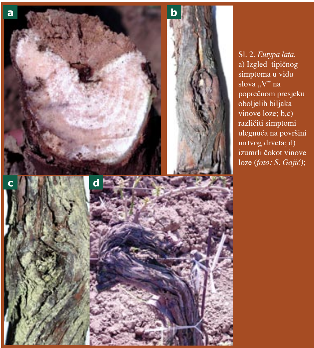
Sl. 2. Eutypa lata . a) Izgled tipičnog simptoma u vidu slova „V” na poprečnom presjeku oboljelih biljaka vinove loze; b,c) različiti simptomi ulegnuća na površini mrtvog drveta; d) izumrli čokot vinove loze;

Prvi simptomi na drvetu vinove loze su najuočljiviji u rano proljeće prije kretanja vegetacije i manifestiraju se u vidu tumornih tvorevina razvijenih oko starih rana od orezivanja. Rak je teško otkriti jer je pokriven korom drveta. Skidanjem kore drveta lako se vide karakteristična područja tamnog ili bezbojnog drveta koji se prostiru u pojasevima, na dolje i na gore, duž stabla, koji mogu biti relativno dugi. Ta pojava se prvo uočava na površini, poslije čega se širi u unutrašnjost, zahvaćajući središnji dio tkiva drveta. Izumrlo tkivo je suho, tamno ili sivosmeđe do svijetlosmeđe boje, tvrdo je i lomljivo. Zbog rasta zdravog dijela drveta u odnosu na zaraženo, dolazi do pucanja stabla na površini, uzduž nekrotičnog pojasa, pri čemu izvana, na mrtvom drvetu, nastaju