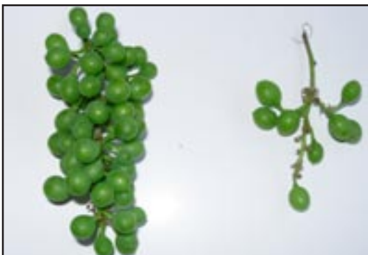
Sl. 6. Eutypa lata . Tipični simptomi eutipoze na grozdu: lijevo - zdrav grozd, desno -grozd koji potječe s oboljele biljke.

listovima, kao i promjene na mladricama, izazvane translokacijom otrova eutipina (stvorenog u starijem drvetu koji je zaražen micelijem gljive) (Carter, 1994.; Munkvold et al. , 1994.; Mugnai, 1999.; Gubler et al. , 2005.). Kada se na zaraženim mladricama pojave cvatovi, oni mogu biti deformirani, a često dolazi i do sušenja pojedinih cvijetova u cvatovima, zbog čega se kasnije stvaraju tzv. „rahuljavi“ grozdovi, s neujednačenim (sitnim i krupnim) bobicama (sl. 6).