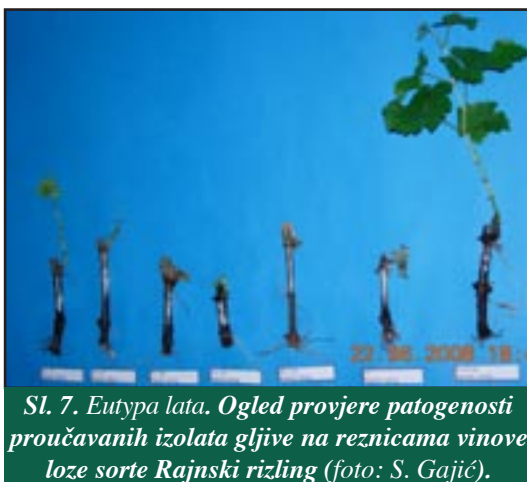
Sl. 7. Eutypa lata . Ogljed provjere patogenosti proučavanih izolata gljive na reznicama vinove loze sorte Rajnski rizling (foto: S. Gajić).

Pri proučavanju patogenih odlika proučavanih izolata na neožiljenim reznicama vinove loze utvrđeno je da su sve testirane sorte te biljne vrste osjetljive prema svih šest proučavanih izolata gljive (sl. 7), ali je ustanovljeno da među pojedinim sortama postoje određene manje razlike u pokazivanju osjetljivosti, odnosno otpornosti prema tom parazitu, kao i da postoje manje razlike u pojavi stupnju patogenosti, odnosno virulentnosti, među pojedinim izolatima.