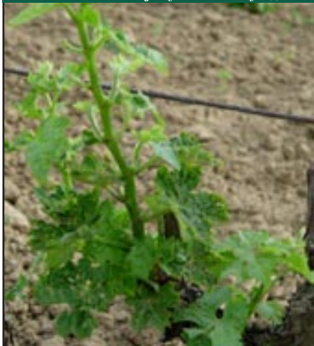
Sl. 3. Eutypa lata . e) simptomi na lastaru sa skraćenim internodijama tzv. „cik-cak“ internodije;

Prvi simptomi na mladica oboljelih biljaka u vinogradu se uočavaju u prva dva mjeseca od kretanja vegetacije, posebno kada su nove sezonske mladice dužine 20-25 cm. Tada se uočava deformacija i promjena boje mladica u svijetlozelenu i javlja se tzv. “cik-cak” raspored internodija (sl. 3). Jača izraženost simptoma iz godine u godinu se manifestira pojavom većeg broja vrlo skraćenih mladica koje rastu iz istog mjesta na kraku čokota, vrlo blizu jedan drugog (sl. 4). Mladi listovi su manji od zdravih, klorotični i s povijenim i poderanim rubovima (sl. 5), sa sitnim nekrotičnim pjegama po obodu lista koji kasnije u sezoni prijevremeno opadaju. Micelij gljive nikad nije izoliran iz listova s vidljivim simptomima, zbog čega se pretpostavlja da su simptomi na oboljelim