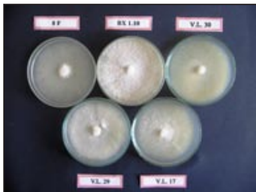
Sl. 8. Eutypa lata . Izgled kolonija gljive na krumpir-dekstroznoj podlozi (foto: S. Gajić).

Sl. 9. Eutypa lata . Izgled kolonija patogena nakon dva tjedna s pojavom crnih tjelašaca (foto: S. Gajić).