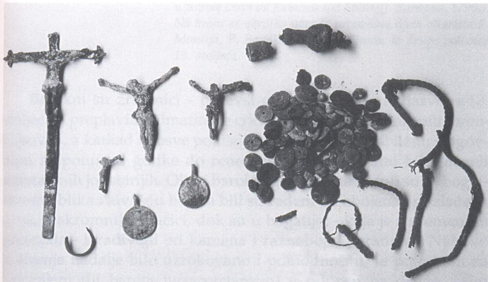
Ostaci predmeta u grobnici sjeverno od Ponzonijeve