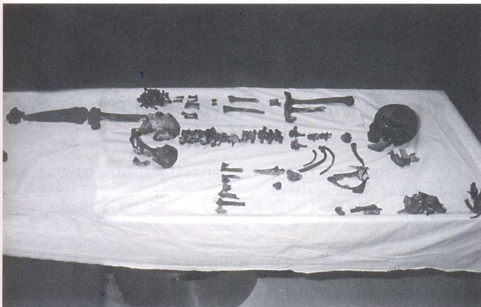
Ostatak kostura jednog od splitskih nadbiskupa. Spajanje kostiju je izvršeno na patologiji KBC Split