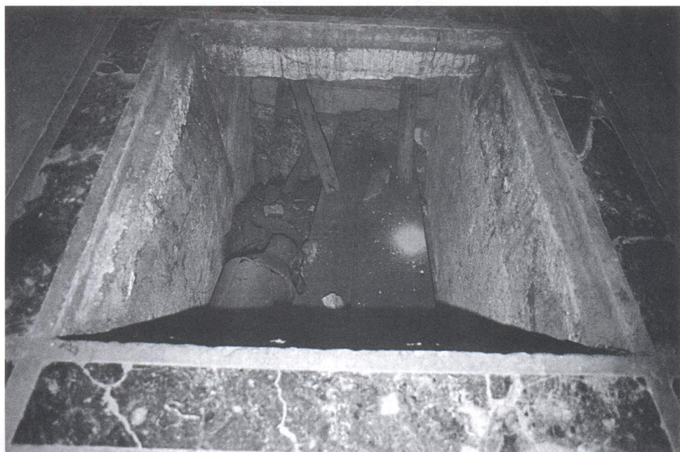
Kor splitske katedrale, grobnica nadbiskupa S. Ponzonija nakon otvaranja