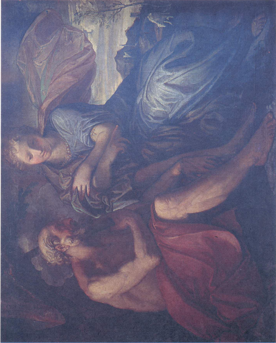
Nepoznati slikar: Orion i Dijana