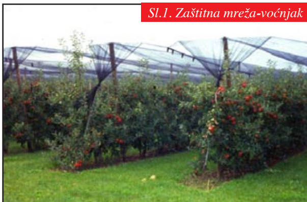
Sl.1. Zaštitna mreža-voćnjak

Odavno se o protugradnoj zaštiti nije pričalo kao zadnjih godina. Nažalost, sve su to bili razgovori s povodom. Meteorološka statistika pokazuje da tuča pada sve češće i sve više, a globalne klimatske promjene idu u prilog prognozama da će se ovaj trend nastaviti još dugi niz godina. Izbor najučinkovitijeg sistema protugradne zaštite postaje aktualniji nego ikad.