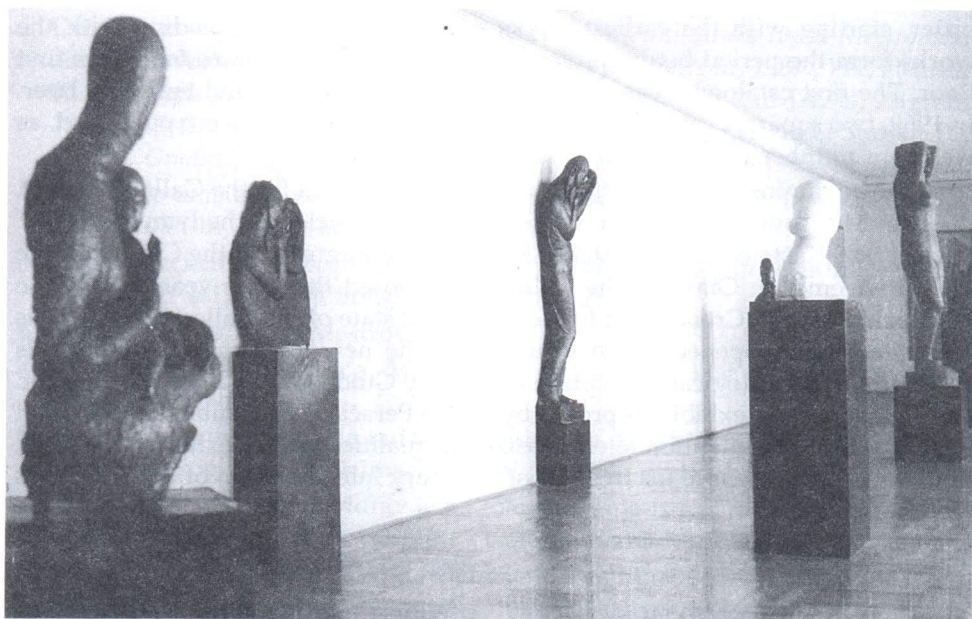
Središnja izložbena dvorana na katu Galerije, 1960. godine