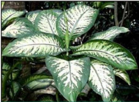
Slika 2: Dieffenbachia amoena