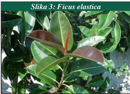
Slika 3: Ficus elastica

Biljku smjestite na sjenovito mjesto, zaštićeno od propuha. Nikako ne izlažite difenbahiju direktnom suncu. Zimi temperatura ne bi smjela biti niža od 15 do 18° C. U vrijeme rasta obilno zalijevati i prskati listove. Kroz jesen i zimu zalijevati oskudno, povremeno prskati biljku ili obrisati listove vlažnom krpom.