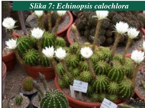
Slika 7: Echinopsis calochlora