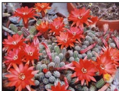
Slika 9: Chamaecereus silvestrii

Kaktus treba smjestiti na vrlo svijetlo mjesto, na direktno sunce. Ljeti mu odgovara visoka temperatura, dok mu zimi odgovara hladnoća. Ljeti zalijevati obilno, zimi ne zalijevati.