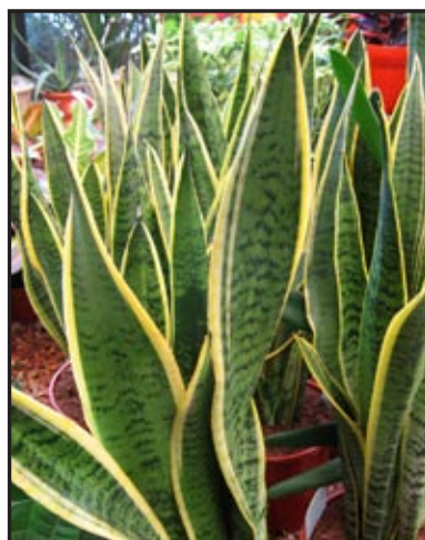
Slika 10: Sansevieria trifasciata

Biljku smjestite na vrlo svijetlo mjesto. Ljeti joj odgovara toplina, zimi temperatura od najmanje 15° C. Ljeti zalijevajte redovito, zimi ne zalijevati.