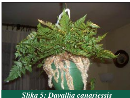
Slika 5: Davallia canariensis

Taj rod paprati potječe iz krajeva umjerene klime, ima lijepe listove, a za kućni uzgoj se koriste dvije vrste. D. canariensis ima dlakavo korijenje, koje se "prelijeva" preko ruba lonca, i duboko razdijeljene listove, duge 35 do 40 cm. D. mariesii ima zanimljive podanke koji ponekad izrastu u loptaste oblike. Svijetlozeleni kožnati listovi duboko su razdijeljeni i dugi su 20 do 30 cm.