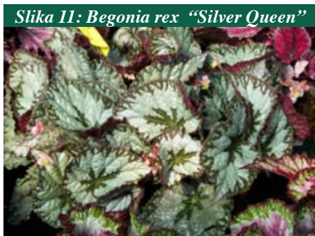
Slika 11: Begonia rex "Silver Queen"

U prirodi begonija raste u suptropskim šumama, na primjer u podnožju Himalaja. I cvatuće i grmolike begonije obično se ubrajaju u cvjetnice, iako se mnogi grmoliki oblici uzgajaju samo zbog lijepih listova. Među njima se ljepotom lišća osobito ističe Begonia rex i njezini hibridi sa sukulentnim stabljikama i jajastim listovima dužine oko 30 cm, raznih boja, od metalnosrebrne i ružičaste do zagasitocrvene, zelene i zagasitosmeđe. "La Pasqual" ima velike, gotovo crne listove, sa srebrnim i grimiznim šarama. "King Henry" ima listove u sredini tamne, sa srebrnom prugom, zagasitozelenim pojasom koji je posut srebrnim točkama i s purpurnim rubom. "Silver Queen" ima srebrne listove s grimiznim naličjem.