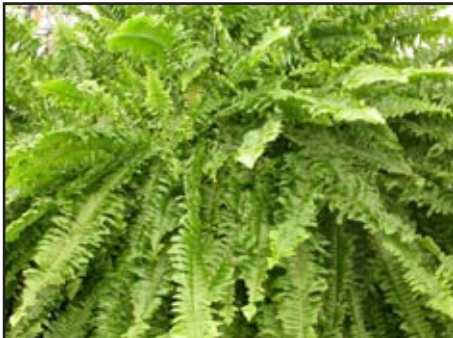
Slika 6: Nephrolepis exaltata „ Bostoniensis “