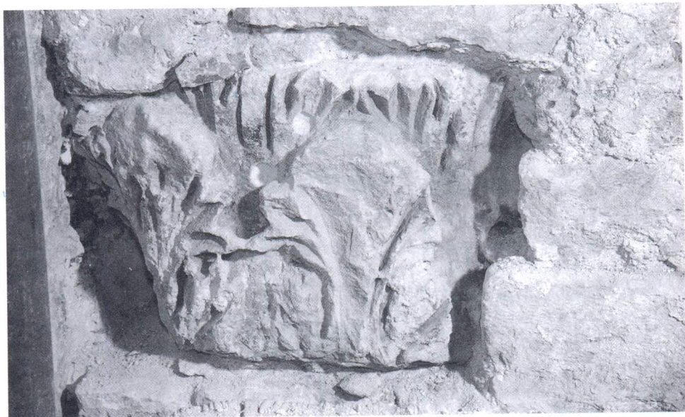
Antički kapitel ugrađen u istočni zid kora