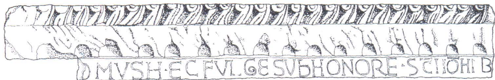
Greda predromaničke oltarne pregrade