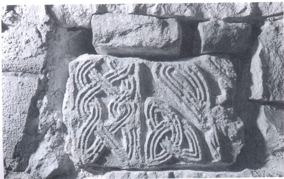
Ulomak predromaničkog ciborija ugrađen u južni zid kora