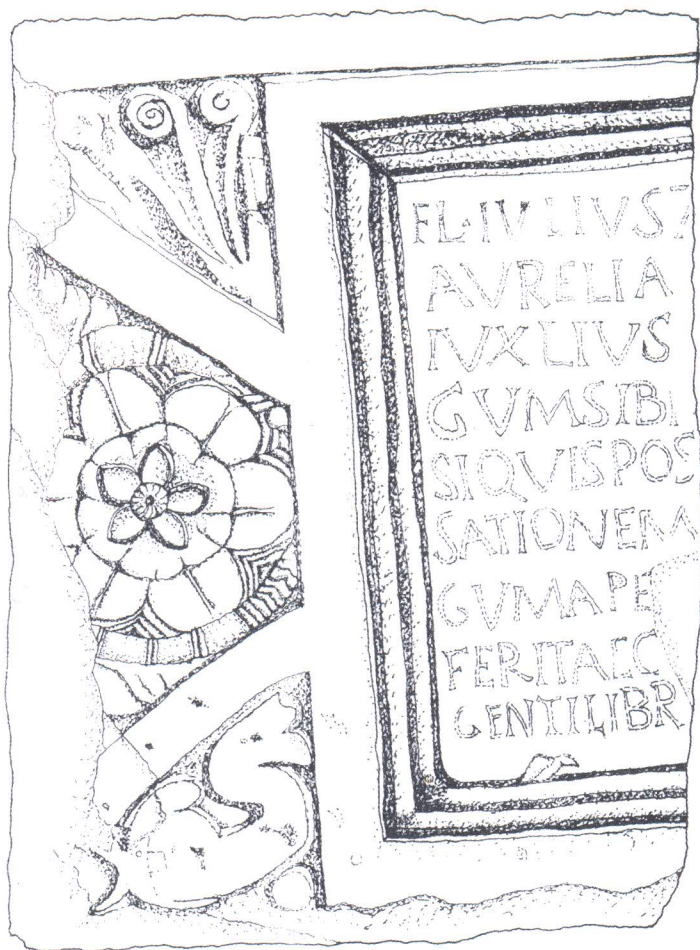
Ulomak antičkog sarkofaga