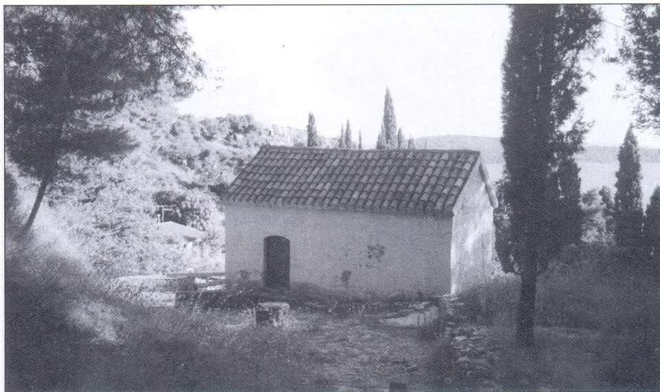
Crkvice Gospe od Sedam žalosti na južnoj strani Marjana smještena na rubu borove šume odakle se strmi put penje prema crkvi sv. Jere