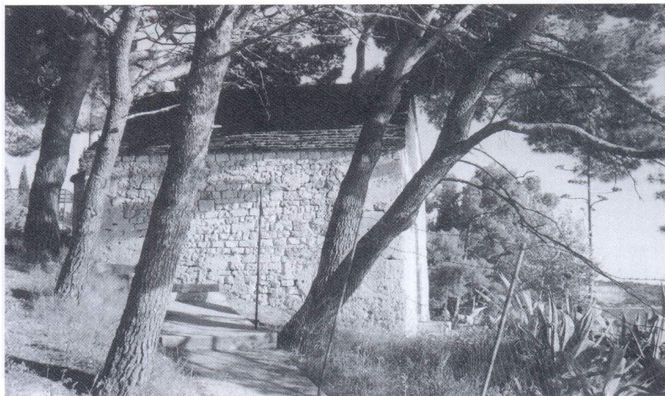
Sv. Juraj na zapadnom rtu Marjana blizu hrama božice Diane. Crkvice je podignuta još u ranom srednjem vijeku. U novije je vrijeme potpuno obnovljena