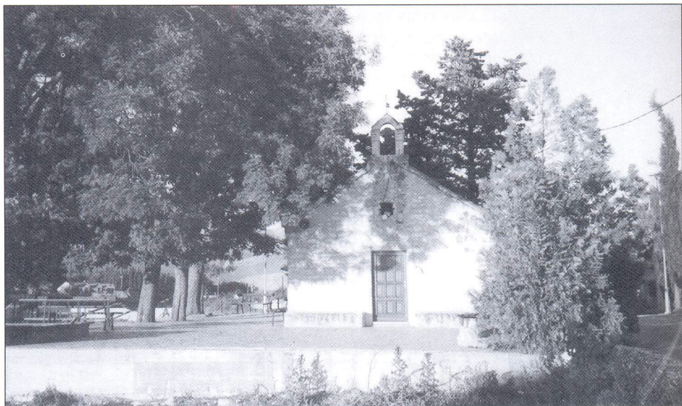
Crkvica sv. Lovre potječe iz ranog srednjeg vijeka. Do nedavno je bila okružena prostranim poljima i vinogradima. Danas su oko nje stambene zgrade.