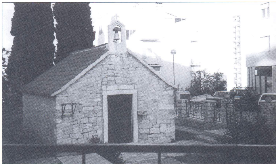
Sv. Mande u istočnom dijelu današnjeg Splita. Tu su do nedavnog vremena sve oko bila polja pa je s uzvisine crkvica dominirala širokim prostorom. Sada je stisnuta među modernim zgradama naglo naraslog grada.