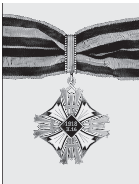
Slika 9. Komanderski znak Ordena velikog litavskog kneza Gedimina, revers