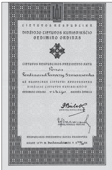
Slika 10. Diploma o odlikovanju Ferdinanda Taróczy-Szmazsenka Komanderskim znakom Ordena velikog litavskog kneza Gedimina