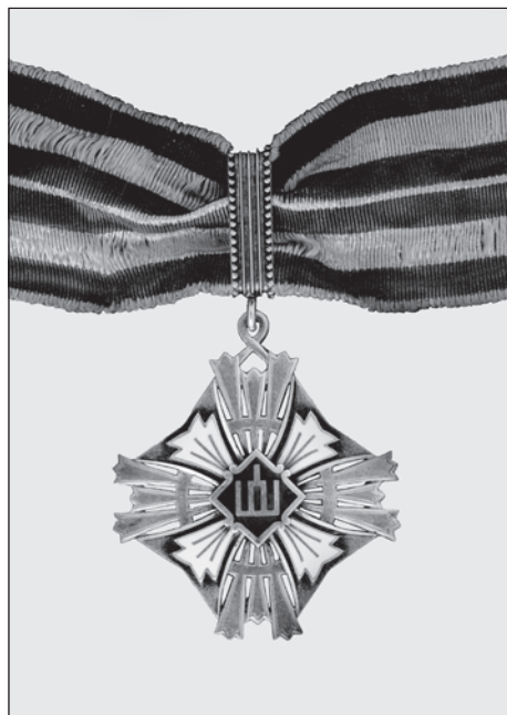
Slika 8. Komanderski znak Ordena velikog litavskog kneza Gedimina, avers