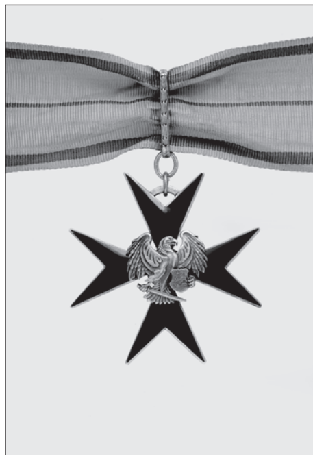
Slika 4. Ordenski znak orlovog križa II. stupnja, avers