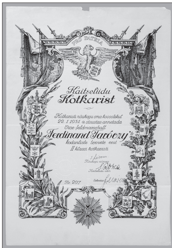
Slika 7. Diploma o odlikovanju vice-feldmaršala Ferdinanda Taróczyja Ordenom orlovog križa II. stupnja