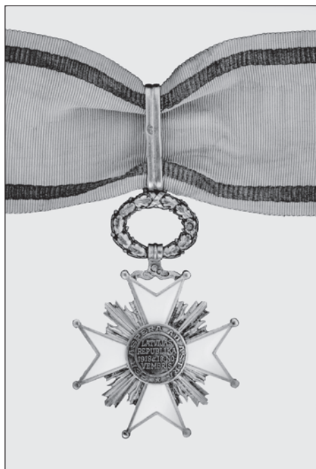
Slika 2. Komanderski znak Ordена triju zvijezda, revers