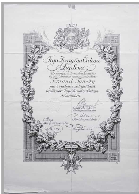
Slika 3. Diploma o odlikovanju Fernanda Taróczyja Komanderskim znakom Ordena triju zvijezda