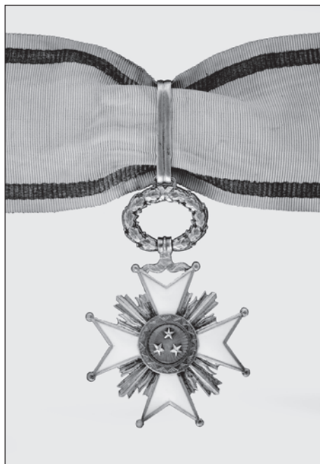
Slika 1. Komanderski znak Ordена triju zvijezda, avers