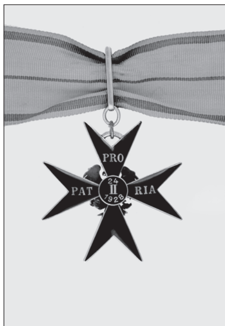
Slika 5. Ordenski znak orlovog križa II. stupnja, revers