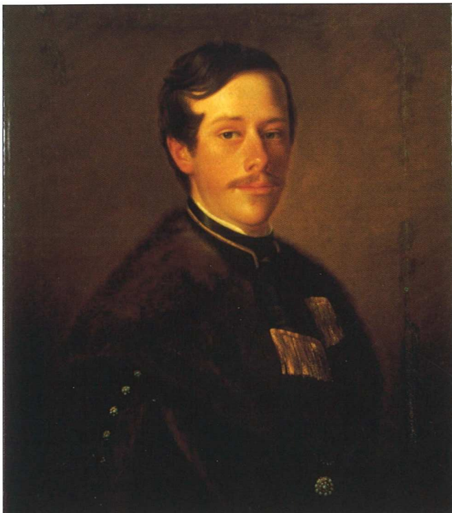
Slika 3 - 3. J. F. Mücke: Portret mladog plemića (Julian) iz obitelji Pejačević, 1856.