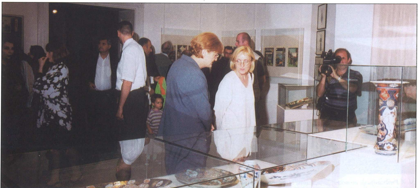
Sl. 3 Otvorenje izložbe "Umjetnost Japana u zbirkama Muzeja Slavonije"