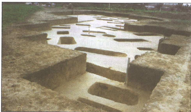
Sl. 7 Rimsko groblje u Zmajevcu, arheološko iskopavanje 2001. god. - pogled na lokalitet