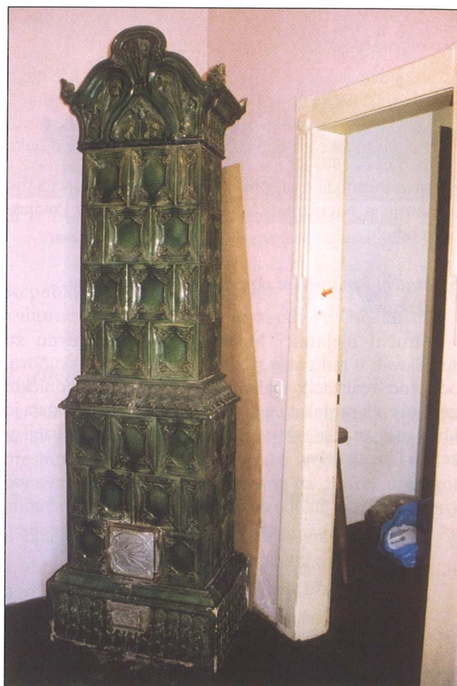
Sl. 9 Secesijska kaljeva peć, kraj 19. - početak 20. st.