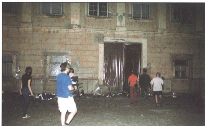
Sl. 14 "Napad" umjetnika tzv. Paint-ballom na fasadu zgrade br. 5