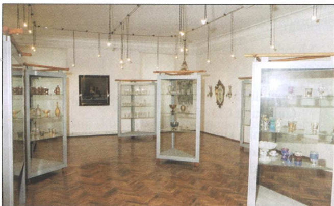
Sl. 12 Dio postava izložbe "Zbirka stakla Muzeja Slavonije 19.-20. st."

Pored sredstava Ministarstva kulture u iznosu od =100.000,00 kn znatna sredstva u ovu izložbu uložio je i Muzej Slavonije.