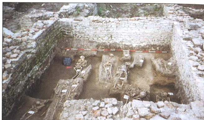
Sl. 8 Čepin-Ovčara ("Tursko groblje"), arheološko iskopavanje 2001. godine