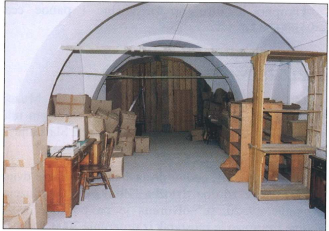
Sl. 11 Privremeni, neuvjetni depo u koji je odlukom Gradskog poglavarstva preseljen velik dio vrijedne bibliotečne građe

U 2001. godini predviđeno je za ove poslove =800.000,00 kn, a radove financira Ministarstvo kulture