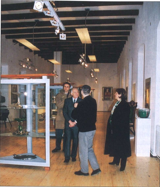
Sl. 10 Nova dvorana preuređena za potrebe budućeg stalnog postava (NJ. e. Francis Bellanger, veleposlanik Republike Francuske razgleda izložbu "Secesija slobodnog i kraljevskog grada Osijeka", siječanj 2002. god.)

Za ove radove ukupno je utrošeno cca =385.000,00 kn.