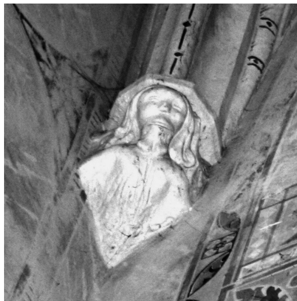
sl. 3. Macinec, konzola u svetištu.

višenom platou u užem području naselja, pronađen je antički novac iz 2. – 3. stoljeća 15 . Na temelju ovdje pronađene srednjovjekovne keramike datirane od 8. do 11. stoljeća 16 , možemo zaključiti da i na području Macinca također postoji dugi kontinuitet naseljavanja. Današnja župna crkva Pohoda Blažene Djevice Marije građena je kao neogotička građevina u vremenu od 1878. do 1881. godine. Vanjštinom neogotičke crkve dominira zvonik kojeg, kao i izduženu lađu i poligonalno svetište, izvana podupiru kontrafori između kojih se nalaze izduženi neogotički prozori s vitrajima. Cijeli crkveni inventar neogotičkih je stilskih obilježja. Na mjestu današnje crkve ranije je postojala kasnogotička crkva iz 15. stoljeća koja je srušena te zamijenjena sadašnjom građevinom 17 . U poligonalnom svetištu nove crkve ugrađeno je osam originalnih kamenih gotičkih konzola. Upravo ove konzole naše su područje interesa u ovom radu. One su se prvotno nalazile u gotičkom svetištu, a kako je jedna od njih datirana godinom 1475. tako se i srušena gotička crkva datira u drugu polovinu 15. stoljeća. Ne zna se jesu li gotičke konzole ugrađene na ista mjesta na kojima su se nalazile u staroj crkvi, međutim, njihova po-