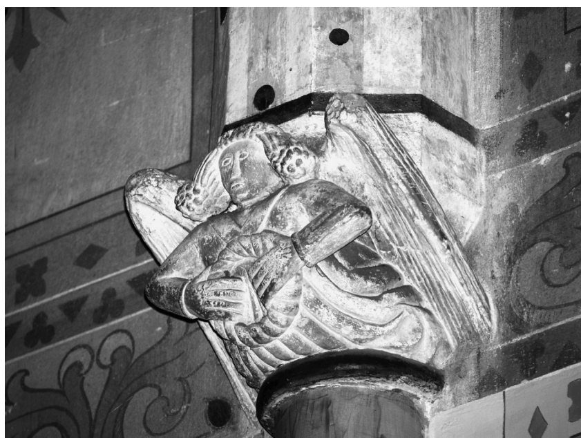
sl. 4. Podturen, konzola u svetištu.

Naselje Podturen nalazi se u središnjem dijelu Međimurja, u blizini rijeke Mure. Sam naziv mjesta vezan je uz veliku utvrdu koja se nekada tamo nalazila, a čiji su se tragovi do nedavno mogli vidjeti u školskom dvorištu. Bedeković donosi kako je upravo od stare utvrde zvane Castri Turnische došao naziv za naselje i župu 20 . Utvrda je porušena 1708. godine 21 . Također treba spomenuti da turen znači i toranj, kula, pa bi se moglo reći da Podturen znači naselje kod ili pod tornjem , a sličan je i stari naziv za Čakovec Chaktornya u kojem se također nalazila važna utvrda s tornjem (kulom). Za crkvu sv. Martina u Podturnu postoji zapis u kanonskoj vizitaciji da bijaše templarska 22 , kao i crkva u Cirkovljanu i crkva sv. Martina na Muri 23 . Župna crkva sv. Mar-