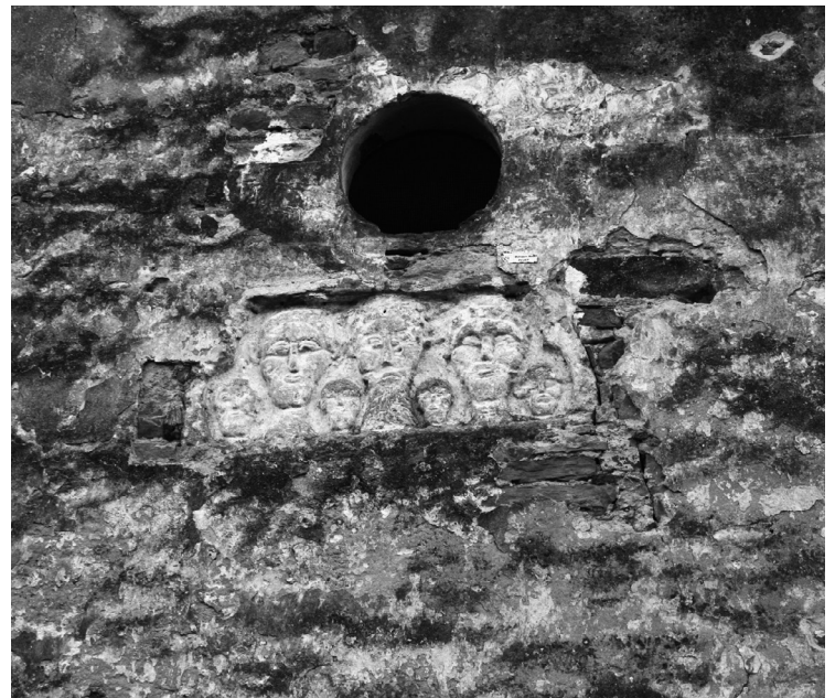
sl. 9. Križovljan, reljef na zapadnom pročelju.

štit na kojem je prikazano srce probodeno mačem, još nedeterminiran, zna se jedino da ne pripada ni jednoj poznatoj obitelji koje su bile vlasnice utvrde (obitelji Herkfy de Zajezda (Herković) i Patačić) 34 . Drugi reljef prikazuje ljudsko lice koje se može usporediti s dvjema glavama ugrađenim u istočni zid konjščinske crkve. Reljef je u dosta lošem stanju, ali može se razaznati ekspresivnost lica s karakterističnim izbuljenim očima i ustima te naglašenim lukovima iznad očiju. Ovo lice je više stilizirano i plošno oblikovano od konjščinskih glava, ali s neobičnom i živahnom ekspresijom koja podsjeća na jedinstvene glave-konzole u Rudinama. Skulptura je, međutim, stilistički slična dvjema glavama u Konjščini i vjerojatno pripada istom kulturnom horizontu 14. stoljeća. Ovi reljefi su jedinstveni, nemamo ništa slično očuvano na utvrđama u sjeverozapadnoj Hrvatskoj.