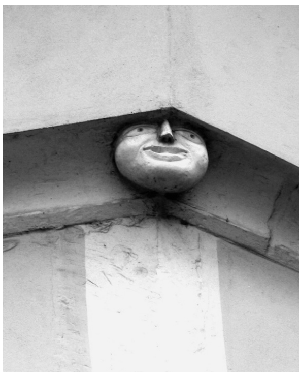
sl. 5. Cirkovljan, skulptura na svetišnom dijelu fasade.