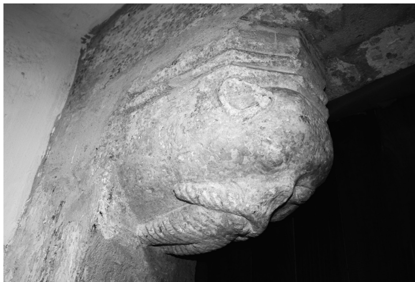
sl. 7. Lepoglava, konzola na sjevernim vratima crkve BDM.

Pavlińska crkva u Lepoglavi je izuzetan spoj srednjovjekovne i barokne arhitekture te opremanja sakralnog prostora. Kompleks je izuzetno kompleksan i povijesnoumjetnički bogat, a ovim radom osvrnut ćemo se samo na jedan detalj srednjovjekovne faze. Na sjevernom zidu crkve nalaze se vrata prema djelomično očuvanom srednjovjekovnom samostanskom klausturu. Vrata imaju kamenu okvir, a na spoju između dovratnika i nadvratnika nalazi se par glava – konzola, datiran u sredinu 15. stoljeća. Istočna glava je prikaz zelenog čovjeka (sl. 7) s licem između ljudskog i lavljeg, iz čijih usta izlaze stilizirani listovi. Oči su mu naglašene, kao i nos,