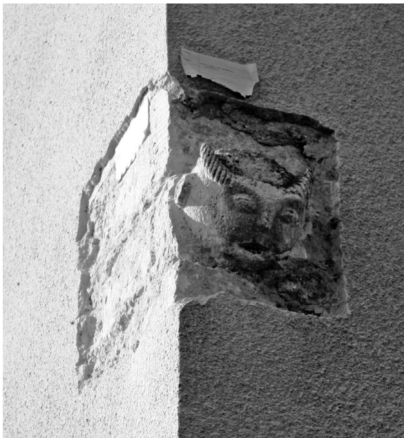
sl. 8. Konjščina, skulptura na svetišnom dijelu fasade.

šenim okruglim licem, izbuljenim očima, velikim ušima i produljenim i iznimno naglašenim obrvama koje su pretvorene u ukrase iznad očiju (sl. 8). Kvaliteta klesanja je visoka, a stilizacija promišljena. Po svom izgledu, oni sasvim sigurno predstavljaju simbole čije značenje još nije utvrđeno, kao ni njihova datacija. Po načinu izrade, moguće je da su ovdje ugrađeni naknadno te da je njihova izvorna uloga bila, kao i u Lepoglavi, flankiranje ulaza u crkvu ili su imali ulogu konzola na starijoj građevini. Oni svojom pojavom balansiraju između dobrodošlice i zastrašivanja te su sasvim sigurno imali moć komunikacije sa srednjovjekovnim čovjekom. U svakom slučaju, pripadaju fantastičnom srednjovjekovnom svijetu i svojom pojavom samo uvjetno predstavljaju ljudske likove 32 .