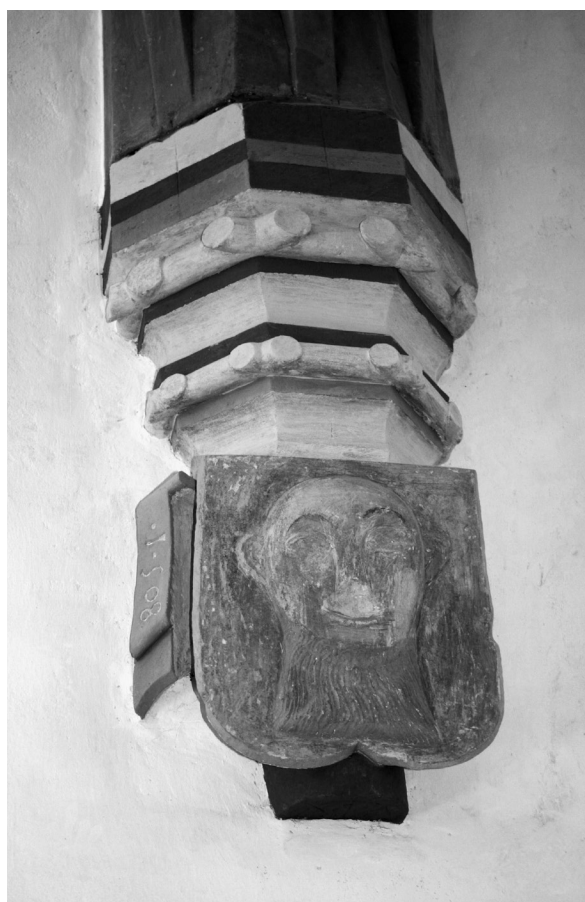
sl. 10. Vukovoj, konzola.

Kapela sv. Vuka smještena je visoko na hrptu Ravne gore, oko 4 km sjeverozapadno od Klenovnika, dobro uočljiva iz daljine, duž cijelog poteza ceste koja od Varaždina vodi prema Ivancu. Prvi spomen crkve datira iz 1639. godine 39 , međutim, na jednoj konzoli uklesana je 1508. godina. Crkva je pravilno orijentirana i građena od kamena, ima poligonalno zaključeno svetišće te je cijela presvođena.