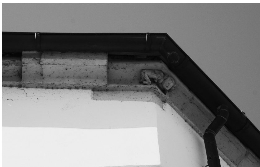
sl. 2. Nedelišće, „divlja žena“.

Na povoljnom, nešto uzdignutom položaju, omeđenom rijekama Dravom prema jugu te Trnavom prema sjeveru, na sjecištu drevnih putova, smjestilo se današnje naselje Nedelišće. Nekoliko poznatih i istraživanih arheoloških lokaliteta, poput lokaliteta Stara ves na istočnom dijelu Nedelišća gdje je istraživano zasad najstarije slavenško naselje zabilježeno u Hrvatskoj s najstarijom ranoslavenskom zemunicom koja datira iz početka 7. stoljeća 10 , govori nam o dugom kontinuitetu naseljavanja u ovom kraju. Nedelišće se spominje u darovnici iz 1226. godine kojom kralj Bela IV. daruje veliko imanje Nedelišće magistru Mihajlu. Naselje se u srednjem vijeku razvija kao trgovište – Oppidum , a u nekim se dokumentima iz 15. stoljeća spominje i kao grad – Civitatis 11 . U najstarijem poznatom popisu župa Zagrebačke biskupije iz 1334. godine, spominje se župa u Nedelišću s crkvom Presvetog Trojstva – Ecclesia sancte Trinitatis 12 . Današnja crkva sv. Trojstva u osnovi je jednobrodna gotička građevina sagrađena u drugoj polovini 15. stoljeća, s poligonalnim svetištem presvođenim križno-rebrastim svodom. U barokno doba lađi su prigradene južna kapela i zvonik, a sjeverna kapela i sakristija pridodani su u 19. stoljeću. U razdoblju gotike, crkve i katedrale Europe ukrašavane su kamenim figuralnim prikazima koji su predstavljali