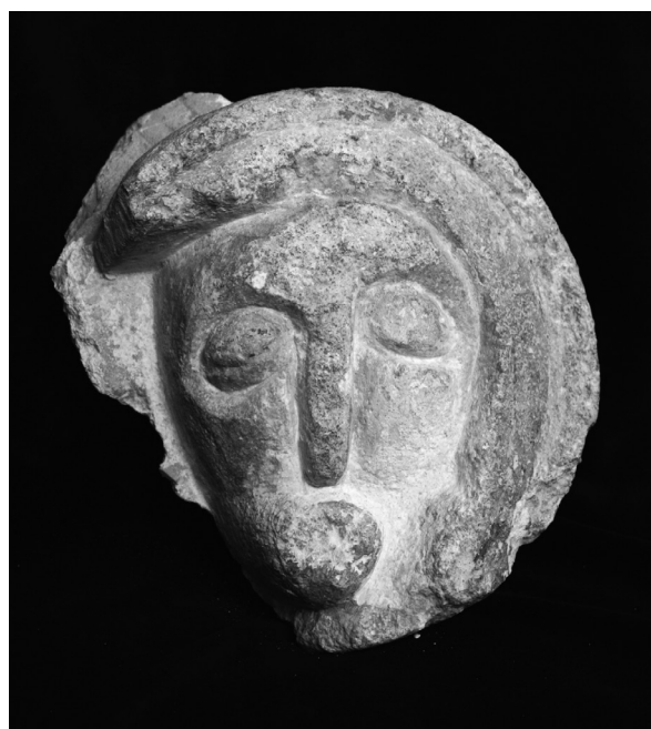
sl. 1. Kneginec, reljef.

Na području sjeverozapadne Hrvatske postoji očuvan značajan broj srednjovjekovne kamene plastike čija je tematika prikaz ljudskog lica. Pojedini elementi kamene plastike do sada su obrađeni u stručnoj literaturi, ali nije predstavljen cjeloviti prikaz očuvane skulpture što će biti učinjeno u ovom radu. Anđela Horvat obradila je figuraliku na crkvi Presvetog Trojstva u Nedelišću 1 ; više autora bavilo se reljefnim prikazom sedam glava na kapeli Sv. Križa u Križovljanu, kao naprimjer K. H. Levaj 2 i V. P. Goss 3 ; konzolama s prikazom ljudskih glava u lepoglavskoj crkvi bavio se ikonografski M. Pelc 4 , dok su Kneginec, Cirkovljan, Konjščinu, Milengrad i Vinicu djelomično obradile autorice ovog teksta u ranijim radovima 5 . Sama tematika prikaza ljudske glave seže vrlo rano, tako ona od davnina predstavlja ne samo središte razuma i moći, već i sjedište duše. Prikazi glave ponekad mogu predstavljati zamjene za stvarne glave ili biti trofejni ili zavjetni simboli, a ponekad mogu imati i magijske funkcije. Za umjetnike srednjeg vijeka prikaz glave predstavlja i test kvalitete stila i vještine oblikovanja. Kako se većina ovdje obrađenih prikaza ljudske glave nalazi na svojim originalnim pozicijama, možemo reći da ovaj prikaz ima važan značaj ne samo u srednjovjekovnoj umjetnosti, već i u kasnijim razdobljima.