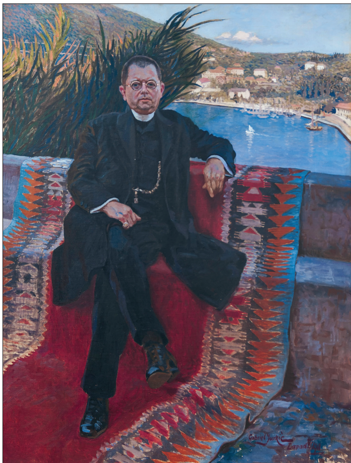
Slika 1. Don Niko Zlovečera, 1911.

Krstelj, Jurkić je tada u Dubrovniku uživao veliku popularnost. 16 Ugođaj sjenovitog perivoja s atelijerom, do ljetnikovca Kosor, u kojem je djelovala i amaterska slikarica Ivanka Mitrović-Kosor, 17 zasigurno je poticajno djelovao na ovog plodnog stvaratelja.