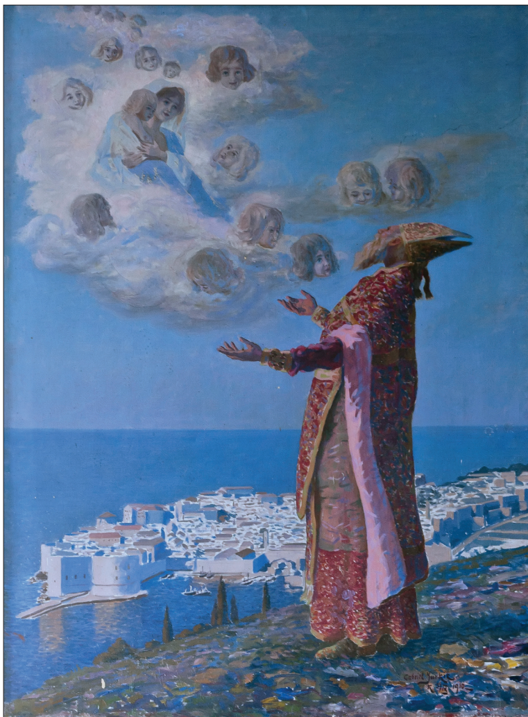
Slika 4. Sv. Vlaho, 1910.

godine 1906. imenovan je austrijskim namjesnikom u Dalmaciji, ujedno i jedinim Dalmatincem na tom visokom položaju. Namjesnik Nardelli također je inicirao gradnju nove gimnazijske zgrade u Dubrovniku, a za vrijeme njegova mandata uveden je hrvatski jezik u državnu upravu. Uvidjevši da ne može ostvariti zadane ciljeve, odstupio je s dužnosti namjesnika 1911. godine. 26