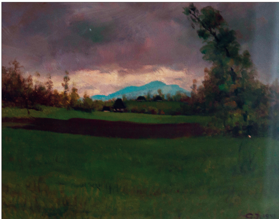
Slika 3. Motiv iz Duvanjskog polja, 1941.