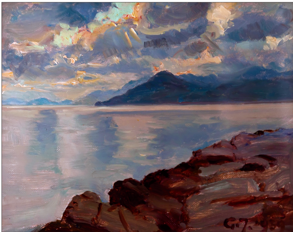
Slika 7. Pogled s Lapada, 1939.