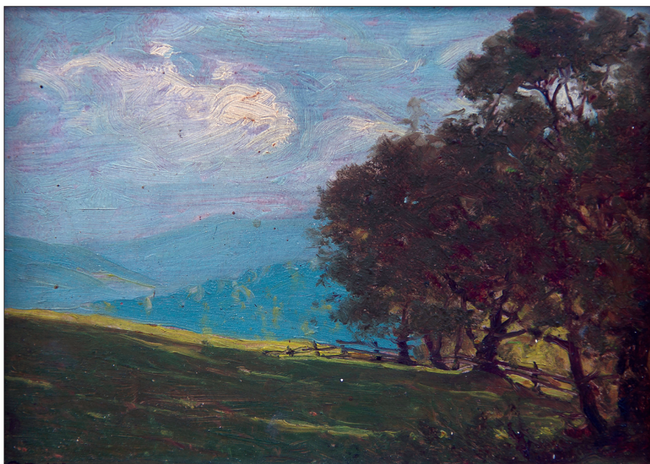
Slika 2. Kasno popodne, 1952.

Godine 1928. Gabrijel Jurkić svom bratu blizancu Mirku ilustrira zbirku pripovjedaka Dubrovačka legenda. Pripovijesti , otisnutu u redovitom izdanju Matice hrvatske za godinu 1927. i 1928. 18 Radnja prve pripovijetke Dubrovačka legenda 846. odvija se u Dubrovniku i Uvali Lapad, a naslovnica knjige, ujedno i jedina ilustracija knjige, odnosi se upravo na tu priču. U prvom planu su ratnik i tvrđava Lovrijenac, dok su u drugom planu dubrovačke zidine, u duhu aktualnog art déco-a. Puno konzervativnije izvodi ilustracije monografije Spomenica Vrhbosanska 19 1932. i desetljeće kasnije, opremajući knjigu svoje supruge Štefe, Nevidljiva kraljica: priče iz bosanske Hrvatske , gdje je također jedna ilustracija s dubrovačkim motivom, zapadni ulaz u grad, za priču U Dubrovniku o mladiću Stipanu, posjetitelju Dubrovnika dan prije velikog potresa 1667. godine. 20 Svakako, ilustratorski radovi slikara Gabrijela Jurkića predstavljaju još jedno poglavlje unutar njegova opusa koje treba detaljno istražiti, a očito se i u tom segmentu javljaju dubrovački motivi.