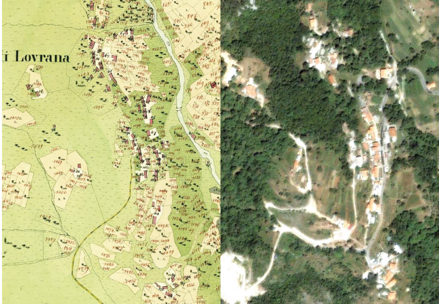
Slika 1. Usporedba stanja u franciskanskom katastru (AST, Mappe del Catasto franceschino, Distretto di Laurana, Comune di Tulliano, 1819., list 3, mapa 544b03) s aktualnom ortofotografijom

često se odvijao scenarij u kojemu je nekadašnja stambena kuća po izgradnji nove i veće bila uz minimalne intervencije prenamijenjena u staju. Par takvih primjera očuvanih u Lovranskoj Dragi predstavlja zaista vrijedan uvid u starije oblike i evoluciju ovdašnje stambene gradnje.