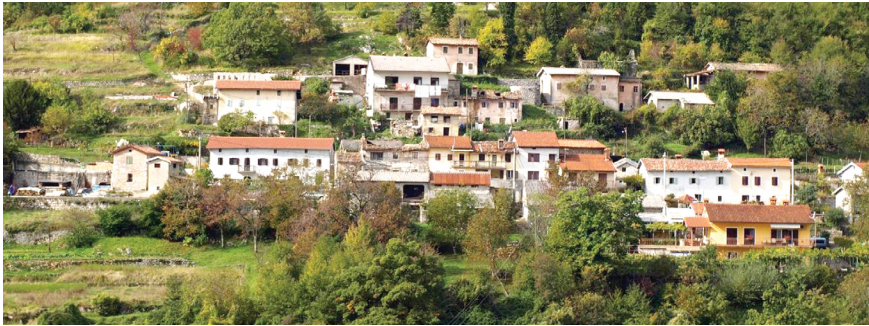
Slika 3. Gržini i Uškari

igralište i boćarski teren, a jedna od građevina nekad je bila gostionica (oštarija). Zbog svega toga može se reći da je spomenuti lokalitet imao karakteristike javnog društvenog, rekreativnog i parkovnog prostora.