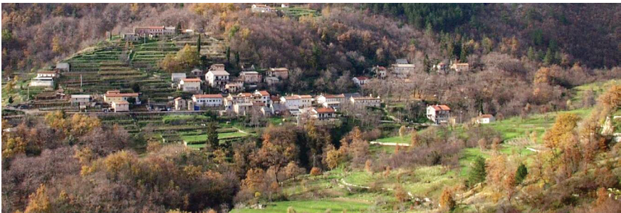
Slika 5. Terasa u draškoj vizuri

Poljoprivreda zasnovana na kvalitetnu lokalnom tlu predstavljala je glavnu gospodarsku osnovu života u Dragi. Kao svjedočanstvo toga ostaje nam krajolik neposredno oko sela, cijela draška dolina te čak i njezine strme stijenke. Neposredno oko potoka, gdje je tlo ravnije, nalaze se krupnije parcele koje je čak bilo moguće uzorati plugom te na kojima su nekad vjerojatno sijane žitarice, za čiju je daljnju obradu postojao i mlin čiji se ostaci još naziru na potoku ispod sela.