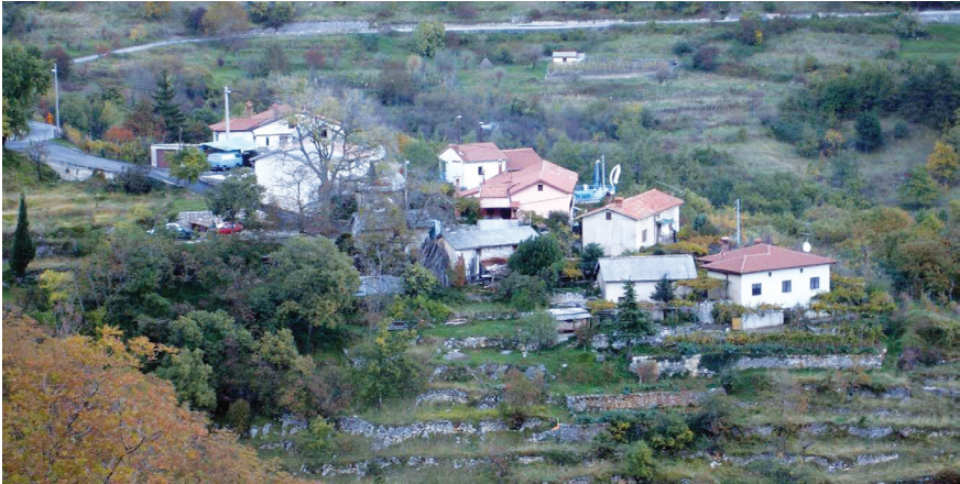
Slika 4. Na vase