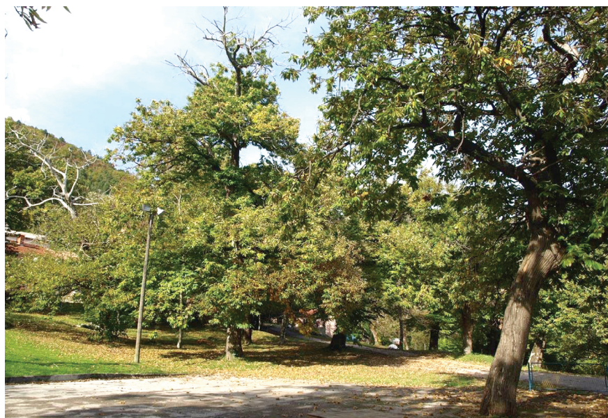
Slika 6. Nasadi maruna Na Dolce

Na istočnoj stijenci doline, gdje se po kazivačima nalazi najkvalitetnija zemlja, takve terase na mjestima nalazimo i na 550 metara nadmorske visine, no to je teže dostupno zemljište danas u potpunosti napušteno i s obzirom na svoju obraslost ne figurira više u vizuri ovog krajolika.