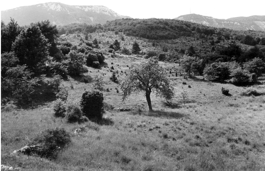
Slika 7. Ispaša na Rakarovcu prije 30 godina

u Lovranštini sežu sve do pašnjaka podno vršnog grebena Učke na 1100 metara nadmorske visine i najviše se očituju u danas ruševnim nakupinama dvora , karakterističnih skloništa za ljude i životinje, kao i ograđenih dolaca , u kojima su rasli otporniji kultivari. Od takvih lokaliteta koji se vezuju uz Dragu treba spomenuti poljoprivredno zemljište i dvore na Lasu pod Grnjačem , pastirske dvore i ispaše oko lokaliteta Križići i Rakarovac te velike pašnjake ispod Grdog brega . Planina je pružala i ekonomsku korist kao izvor drva, koje se koristilo i za proizvodnju drvenog ugljena.