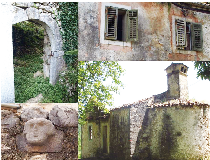
Slika 9. Detalji s kuća u Lovranskoj Dragi