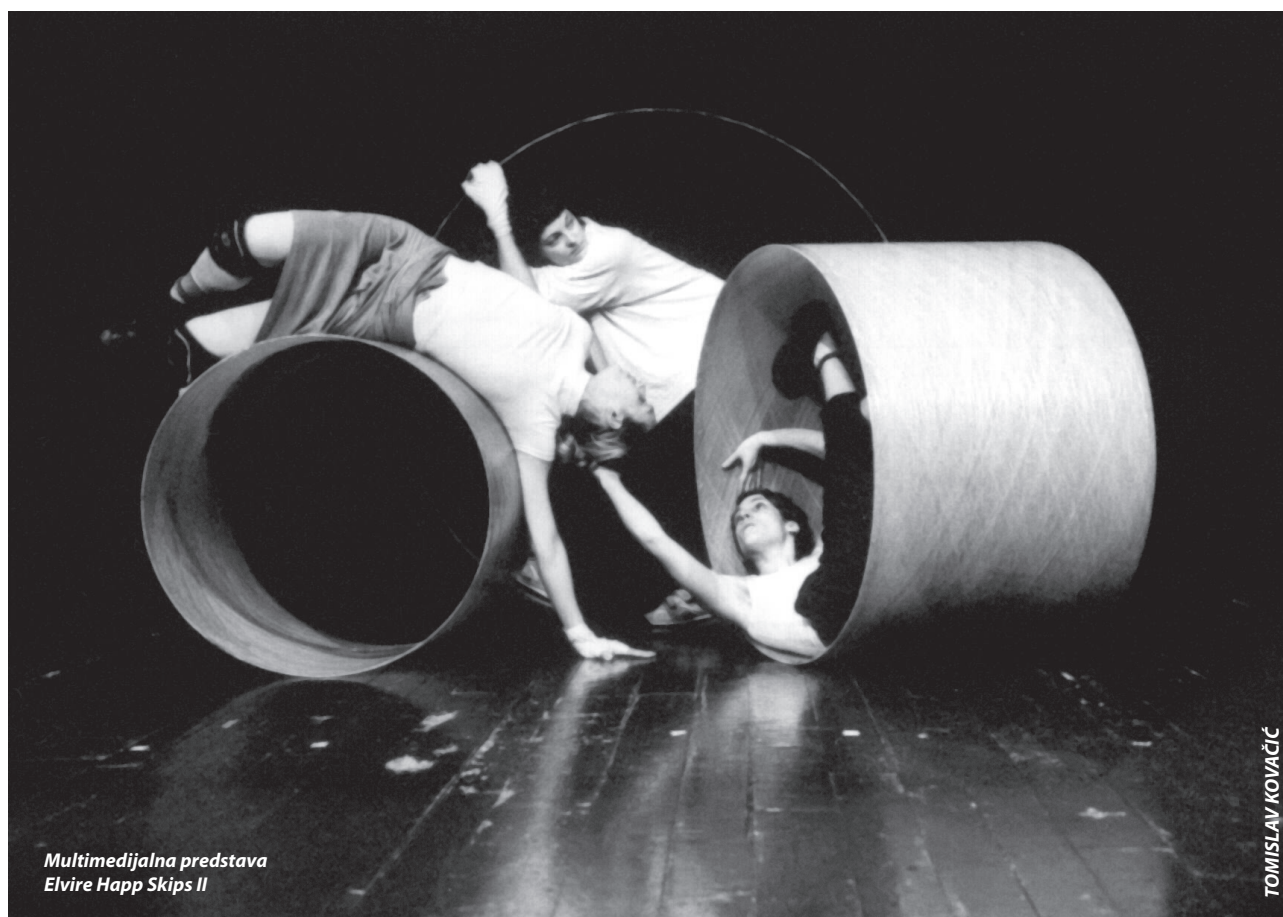
Multimedijalna predstava Elvire Happ Skips II

Članak opisuje kreativni sustav glazbeno-pokretnog izražavanja i stvaranja Skočizvuk koji obuhvaća metodički priručnik sa zbirkom glazbeno-pokretnih igara, sustav radionica za odgajatelje i implementaciju Skočizvuk pristupa u radu s djecom. Skočizvuk sustavom se želi potaknuti kreativnost odgajatelja s ciljem zadovoljavanja djetetove potrebe za igrom, koja je u službi njegova cjelovitog razvoja.