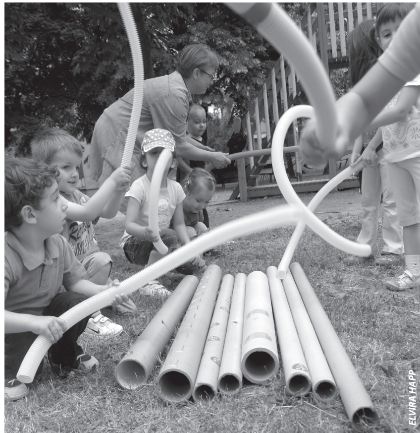
Nakon primjene Skočizvuk pristupa odgajateljice su primijetile da djeca bitno više samoinicijativno biraju glazbene aktivnosti