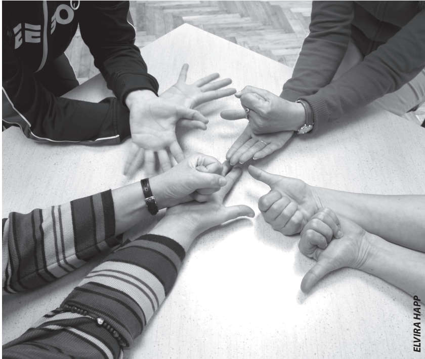
Skočizvuk radionicama se razvija kreativnost polaznika u izražavanju glazbom i pokretom

Drugi dio knjige sadrži tekst o interaktivnom audio CD-u Skočizvuk , raspored glazbenih brojeva i kazalo zvučnih primjera u igrama.