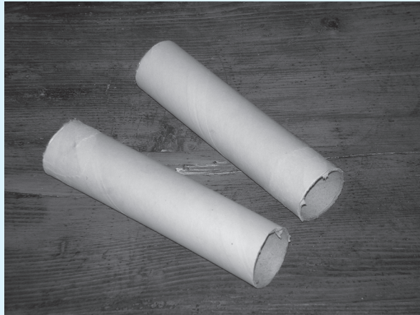
tuljci od tvrdog kartona

Za izradu 'Zvučne pamtilice' potrebni su: