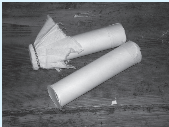
Vrhove tuljaka je potrebno prekriti poklopcima i zatvoriti krpicama