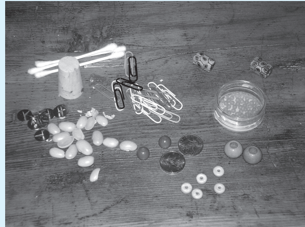
razni materijali za punjenje tuljaka