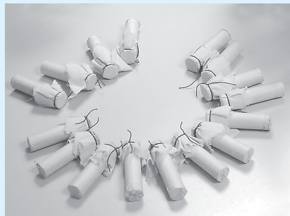
Na kraju ćete dobiti deset zvučno različitih šuškalica