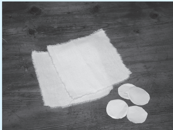
kvadratne krpice od materijala i kartonski poklopci