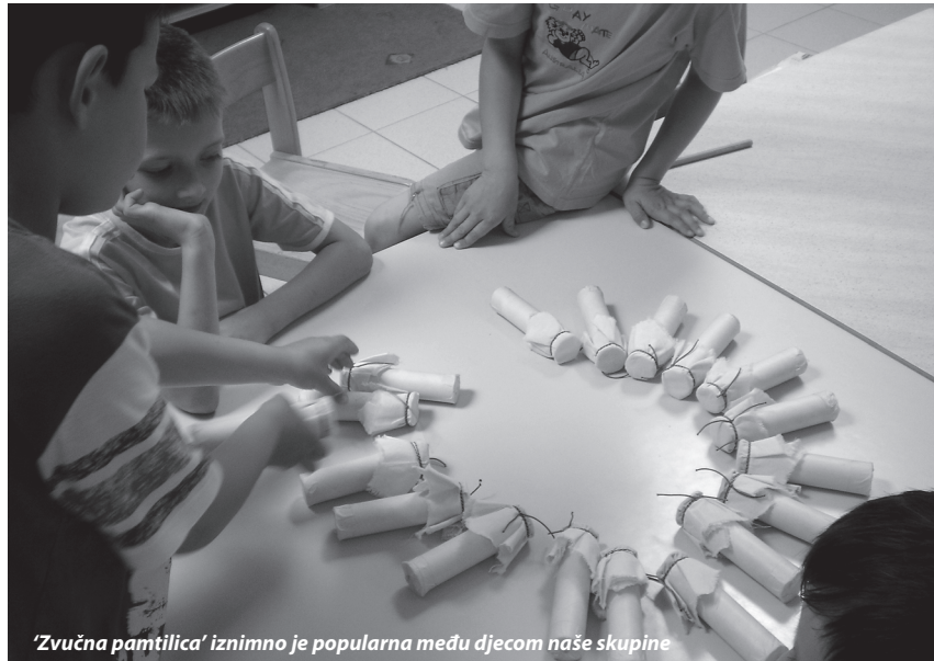
'Zvučna pamtilica' iznimno je popularna među djecom naše skupine

Kreativnost odgajatelja u praksi je dokazana nebrojeno puta. Često su igračke koje odgajatelji osmišljavaju djeci zanimljive jer sadrže neka višestruka rješenja i mogućnosti korištenja. Ideja o izradi zvučne pamtilice zasigurno će i vama poslužiti u svakodnevnoj praksi.