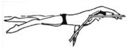
Slika 3. Rotacioni način plivanja kraul rukama

2. Rotacioni način odgovara plivačima koji dišu na obje strane (nakon tri zaveslaja rukom). Kada ruka uđe u vodu, suprotna ruka je prošla sredinu podvodnog zaveslaja. Koriste ga češće plivači s dvoudarnim kraulom, te plivači sprinteri. Ovakav način zaveslaja proizvodi veću frekvenciju rada rukama (14).