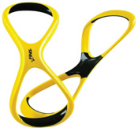
Slika 7. Rekvizit za korekciju pravilnog položaja podlaktice i lakta s mreže http://www.swimoutlet.com/p/finis-forearm-fulcrum-paddles-6334/?q=1&richrelevance&ClickCP&item_page.rr1