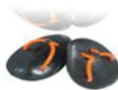
Slika 5. Lopatice dizajnirane za treniranje "osjećaja vode" pri fazi zahvaćanja i potiskivanja s mreze: http://www.swimsmooth.com/ptpaddles.html , skinuto 8.7.2016

Na slikama 5-7 dan je pregled sredstava koja se koriste za usavršavanje rada ruku.