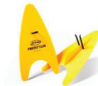
Slika 6. Lopatice dizajnirane za pravilan-aerodinamičan ulazak ruke u vodu