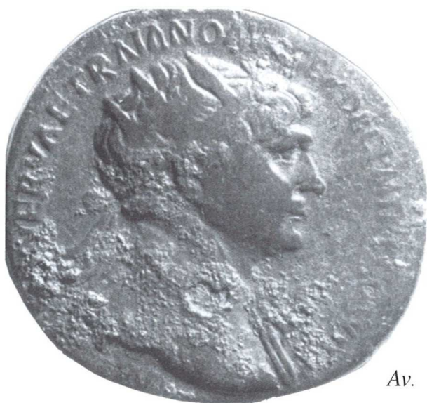
2. TRAJAN (98. - 117.), sestercij