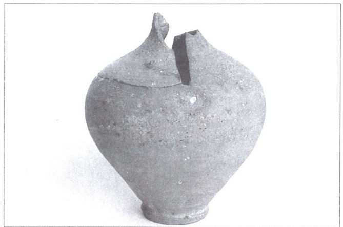
Slika 1. Štedna kasica s pohranjenim novcem, 2. stoljeće