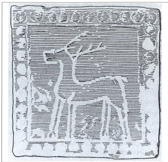
Slika 4. Podna pločica iz burga Zvíkov u Češkoj, prva polovina 13. stoljeća (objavljeno: Nechvatal Borivoj, 1988., str. 595)

Zanimljivi podatak nalazimo u dijelu posvećenom 50-oj obljetnici biskupovanja J. J. Strossmayera (Svećenstvo, 1900. - 1904., str. 326.), gdje se kaže "da je ta sredovječna katedralna crkva bila u gotičkom slo-