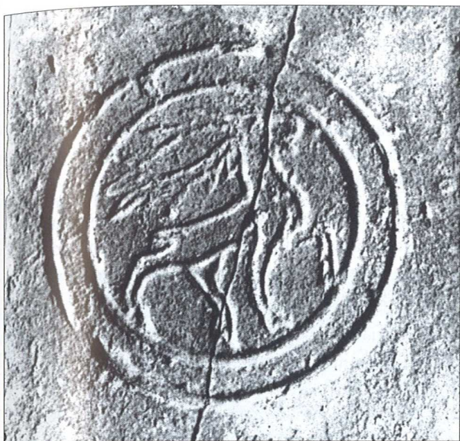
Slika 3. Podna pločica iz kapele kraljevskog grada u Višegradu (objavljena u "Magyarországi művészet 1300.-1470. körül, Budapest, 1987., str. 135. i 663.)

Österreich 33, Wien 1995., str. 81. - 108, sl. 21), dok pločica s vjevericom za sada nema analogiju u dostupnoj literaturi.