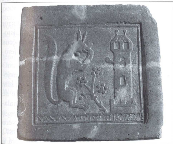
Slika 1. Podna pločica iz Đakova s motivom vjeverice

Autor u svom radu ističe višestruki značaj dviju podnih pločica iz Đakova, koje se nalaze u Muzeju Slavonije u Osijeku. Pločice je krajem 19. st. poklonio Muzeju poznati mecena i donator biskup J. J. Strossmayer, a pored toga što se radi o rijetkim primjercima srednjovjekovnih podnih pločica pronađenih u Hrvatskoj, one predstavljaju svojim motivima i karakterističan likovni izraz kasnog srednjeg vijeka, odnosno gotike. Uklapajući se u povijesne podatke ujedno dopunjuju sliku srednjovjekovne Đakovačke biskupije.