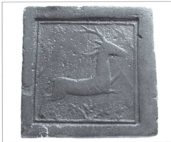
Slika 2. Podna pločica iz Đakova s motivom jelena

Biskup đakovačko-srijemski i poznati mecena Josip Juraj Strossmayer davne je 1896. godine darovao Gradskom muzeju u Osijeku manju zbirku slučajnih nalaza s rimskog lokaliteta Štrbinci pokraj Đakova 1 . Nažalost, u literaturi nije zabilježeno da je iste godine preko poznatog darovatelja i jednog od osnivača Muzeja u Osijeku, Karla Franje Nubera, Strossmayer