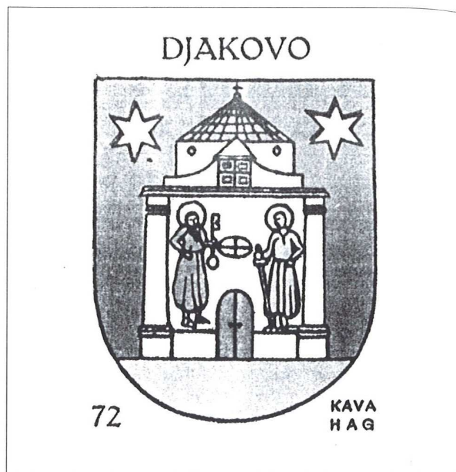
Slika 2. Gradski grb preuzet iz knjige E. Laszowskog

preciznije reći sa se tu radi tek o njegovim ostacima, sa sigurnošću se može ustvrditi da se na zgradi nalazi od njezina dovršenja 1901. godine 3 .