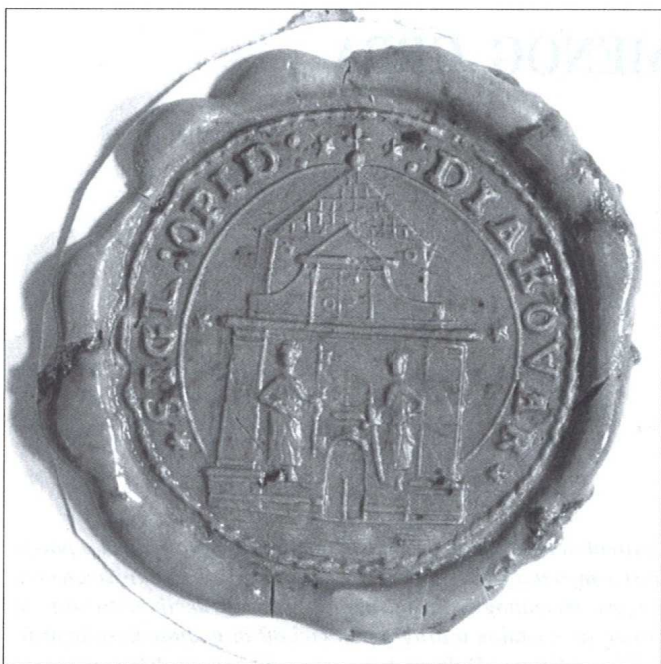
Slika 1. Povijesni grb Đakova na otisku pečata iz 19. st.