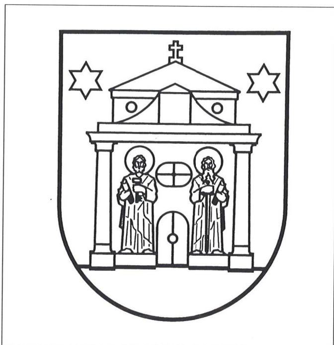
Slika 5. Sadašnji grb Đakova

osnovu prethodnih dogovora, Skupština općine Đakovo je na temelju članka 39. Odluke o organizaciji i radu Izvršnog vijeća Skupštine općine, na svojoj 52. sjednici održanoj 4. lipnja 1992. godine, zaključila da se Ivanu Tuni Jakiću, akademskom slikaru iz Osijeka, povjeri izrada idejnog rješenja revizije grba Grada. Točna rekonstrukcija onoga što se dalje dešavalo do konačnog prihvaćanja novog grba, na osnovu do sada dostupnih podataka, nije moguća.