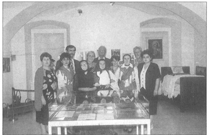
Slika 4. Izložba "Tradicijska kultura i rat: obnova folklornih društava", Klovićevi dvori, Zagreb, 1998. god.; predstavnici Gibarca na izložbi

U 1997. g. prikupljena su darovima 122 predmeta, a otkupljeno ih je 35. Sljedeće godine prikupljeno je