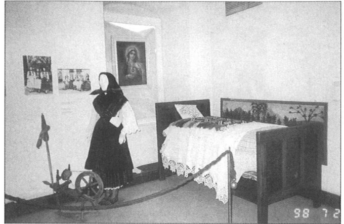
Slika 3. Izložba "Tradicijska kultura i rat: obnova folklornih društava", Klovićevi dvori, Zagreb, 1998. god.; dio postavke