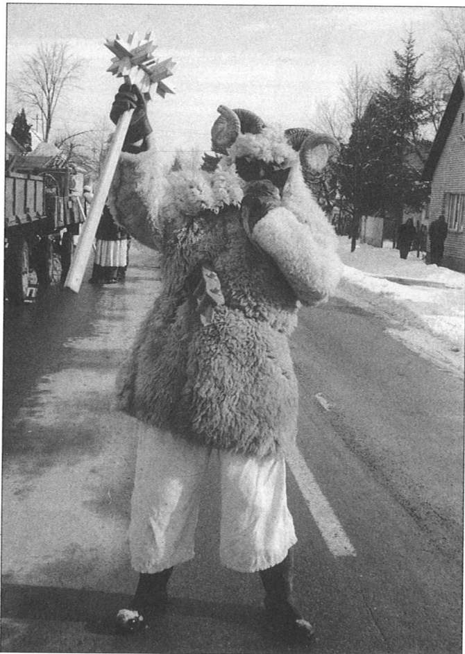
Slika 5. Pokladni običaji, buše u Baranjskom Petrovom Selu, 1999. god.

fotodokumentacije Muzeja Slavonije i Instituta za etnologiju i folkloristiku. Uz ostali terenski rad (Sl. 5, 6), započela su istraživanja i u Aljmašu u svrhu dokumentiranja, prikupljanja građe i podataka, osobito usmjerena na problematiku nošnje. U Aljmašu prikupljeni su predmeti odbačeni prilikom raščišćavanja kuća nakon rata. Na taj način nabavljena je i manja količina građe iz Koroda.