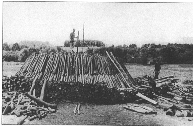
Slika 6. Paljenje drvenog ugljena, Granice (Našice), 1999. god.

Uz suradnju i pružanje usluga pojedincima, stručnjacima i ustanovama, te suradnju s medijima, spomenimo i da je etnologinja Muzeja Slavonije sudjelovala u radu komisija za izbor ili revijalni prikaz na-