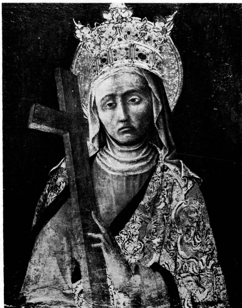
Antonio Vivarini, Sv. Jelena — Zbirka T. Perić, Zagreb

Pod pretpostavkom, naravno, da se naš prijedlog pokaže opravdanim. Zato i objavljujemo ovu malu sliku kao hipotezu. Dok nam draperije Bogorodičina lika izgledaju uvjerljivim, i na razini Antonijevih takvih radova, lik Krista nas ipak podsjeća na male slike rađene od »madonera«. Pitanje je, gdje je i njihov izvor, i na čije se primjerke oni oslanjaju? Gledajući pažljivo (nažalost prema maloj i lošoj fotografiji) lik Krista na vrhu poliptiha u Osimu, nije moguće oteti se utisku da je modelacija Kristova toraksa gotovo identična kao na našem: u pojedinostima rebara, ključnih kostiju, ruku i ramena. Slabo se na osimskoj slici razabiru pojedinosti lica i kose. Uvjerljivije su usporedbe s rukama Bogorodice, a po-