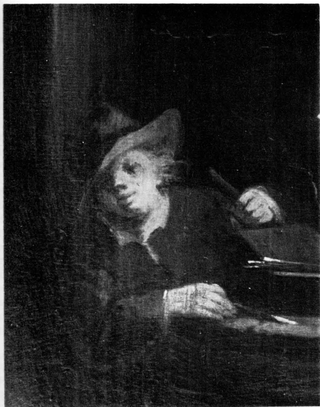
J. G. Trautmann, Žena pali svijeću (detalj)