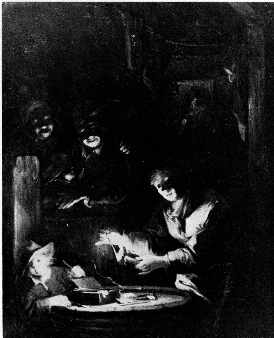
Johann Georg Trautmann, Žena pali svijeću

Kroz gotovo kvadratni okvir slike gledamo zamrznuti bljesak žigice koja odvajkada izjeda smeđi mrak u koji je utonula izba potleušice. Starija žena, nagnuta nad bure s desna, pali svijeću. S druge strane stoji dječak uhvaćen u trenu dok vadi duga palidrvca iz otvorene kutije na buretu. Drveni plot u pozadini stješnjuje prostor prvog plana na intimitet svjetla jednog palidrvca. Iza nje tročlana obitelj sa smiješkom gleda prema svjetlu. Što na ovom prizoru zanima dječarce? Onaj pored bačve upro je pogled negdje lijevo, nekamo van slike, a drugi diže glavu prema ocu. Stariji su kao omađijani varnicom. Ostali prostor kućerka utonuo je u mrak. Tek će poneki svjetliji ton sveg smeđeg otkriti konopac s rubljem, gredu, cigle ili papir s portretom prikucanim na goli zid. Snažni clair-obscur efekat odlijepio je od totalne monokromnosti samo detalje likova, dovoljne da ih doživimo u punom njihovom prisustvu oko plamenog bljeska. Prst, brada, obod šešira, obraz, poneka grud, ili ... dovoljni su da se dojam u potpunosti kompletira. A sve