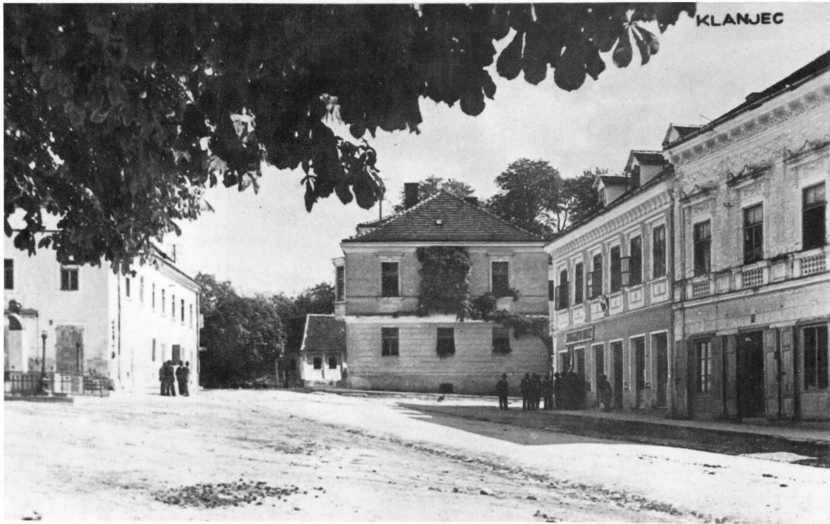
Klanjec, pogled na glavni trg od zapada. Razglednica iz vremena oko 1930. godine, izradena na osnovi fotografije Đure Griesbacha, izdana nakladom Griesbacha i Knausa iz Zagreba.

U slučaju Katičine razglednice, zaslugom Katice same, oslobođeni smo svake sumnje o tome. Katičina razglednica izišla je tiskom godine 1904. i te godine Katica odmah i posegla za njom da njome obraduje prijateljicu. No kako je Katica odmah uspjela i ugledati tu razglednicu u Klanjcu? I o tome obavještava jedna poruka s njene razglednice. Katičina izjava o tome glasi: U ponedjeljak bila sam na sajmu kupovati karte, jer se moja zalih već izašla, – sve su otišle na jug!