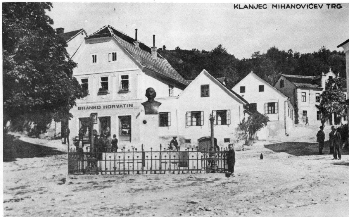
Klanjec, pogled od juga na glavni trg sa spomenikom pjesnika Mihanovića. Razglednica iz vremena oko 1930. godine, izrađena na osnovi fotografije Đure Griesbacha, izdana nakladom Griesbacha i Knausa iz Zagreba.

šljemom taj prostor prikazuje sav zatravnjen i visokim zidom ograden, razglednica pogleda na središte Klanjca iz vinograda franjevacu pokazuje nam do tornja crkve natkrivenog već neorenesansnim šljemom taj prostor već sav izgažen, razrovan i nikakvim zidom više ograden. To kao da je uz samu crkvu dugo zamiralo zapušteno groblje, a onda bilo i ugaženo upravo kad je toranje crkve doživio svoju obnovu. Iza toga taj vrijedni prostor mogao je Klanjcu postati i nešto drugo. Manjkali su za to samo kostanji i klupe s novom ogradom. 18