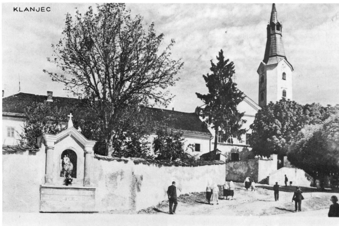
Klanjec, pogled iz glavne ulice od jugozapada na franjevački samostan i crkvu. Razglednica iz vremena oko 1930. godine, izradena na osnovi fotografije Đure Griesbacha, izdana nakladom Griesbacha i Knausa iz Zagreba.

No po Radićevu odlasku iz Klanjca nešto se drugo uzveralo na tu ogradu. Iz njegovanog vrta za ledima kućerine provirila je mirisava glicinija i zapadnim pročeljem kuće digla se sama k balkonu te ga svega obgrlila. I tako nekoliko godina nakon pokojnog Radića s te uzdignute sjenice nitko nije mogao ništa reći Klanjčanima. Đuro Griesbach, fotograf iz Zagreba, koji je početkom tridesetih godina glavnome trgu u Klanjcu izradio rukovet uspješnih snimaka – razglednica nehotice se očesao o taj obrašteni balkon. On ili jedan drugi fotograf uz njega uspio je iz te kočoperne sjenice izraditi ipak jednu vrlo dobru razglednicu glavnoga trga. A na to je svojeglava kaćiperka glicinija sišla s ograde balkona kao da se nešto predomislila.