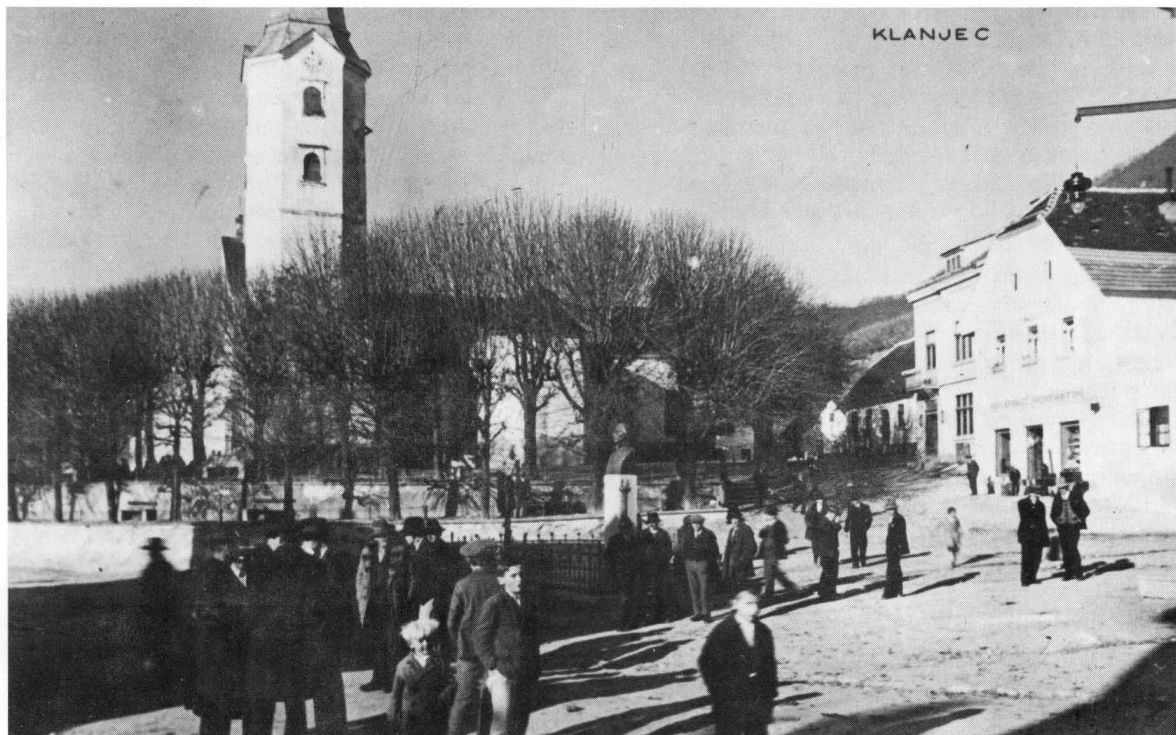
Klanjec, pogled na glavni trg sa spomenikom pjesnika Mihanovića, rad kipara Frangeša. U pozadini šetalište s početka 20. stoljeća i franjevačka crkva iz 17. stoljeća. Razglednica iz vremena oko 1930. godine, izrađena na osnovi fotografije Đure Griesbacha, izdana nakladom Griesbacha i Knausa iz Zagreba.

nekakve promjene općega ukusa. Time se sudbina slika na razglednicama oduvijek odlučno razlikovala od udesa slika slikanih na daskama ili na platnima. Ovima je umnožavanje jačalo samo poznatost, ali im je uvijek i potkapalo vrijednost, a sabiranje tih slika podlijegalo je različitim utjecajima.