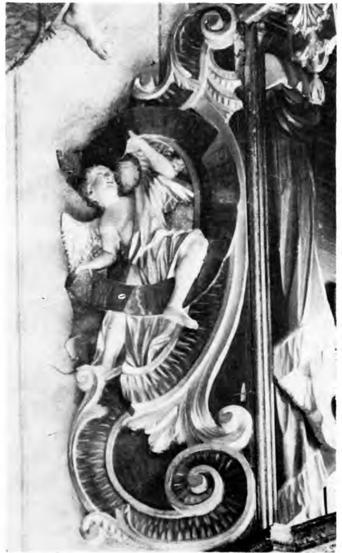
7 Virovitica, Franjevačka crkva — propovjedaonica (detalj)

svetaca sačuvana su oba kipa: Ivan Krstitelj i Ivan Evanđelist , prvi obnažena mršava tijela pod krznenim plaštem, a potonji u dugačkoj tunici i plaštu. U skupini sv. Trojstva udara u oči sličnost tipa lica i obrade tjelesnih oblika. Bog Otac (sl. 2) i Krist razlikuju se zapravo samo oblikom brade, kratke i spiralno nakovrčane kod Krista, spuštene u dugačkim pramenovima kod Boga Oca. Crte lica gotovo su identične, a opetuju se i kod svih drugih likova. Na Kristovu obnaženom prsnom košu manjka svaka anatomska pojedinost, a ta se slabost opetuje i kod drugih majstorovih kipova gdje su tjelesni oblici slobodnije vidljivi pod naborima odjeće. Jedini je sačuvani ženski lik drnjanskog oltara sv. Barbara, i ona je po svom izduženom, mršavom tijelu, ornamentiranom stezniku s pojasom i drapiranom plaštu, tipična za Severinove likove svetica. Iako to vrijedi i za uspravni kip mladenačkog anđela koji stoji na kugli, nezgrapnih udova i stereotipna lica. O arhitektonskoj konstrukciji drnjanskog oltara ne znamo ništa, ali