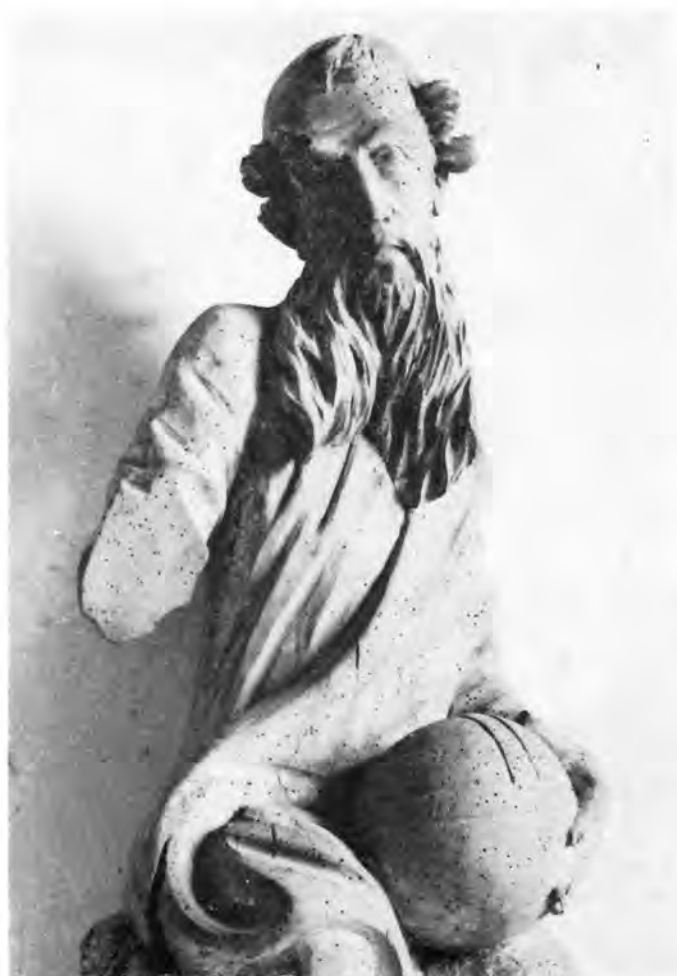
2 Drnje, župna crkva — Bog Otac (detalj)

na dva kata s atikom. Sredinu retabla zauzimala je slika patrona sv. Jurja, a iznad nje bio je smješten kip Marije s Djetetom. 5 Time se, po mišljenju A. Horvat, »htjelo naglasiti da drnjanska crkva podržava tradiciju propale srednjovjekovne Marijine crkve od Struge, na posjedu Sigismunda Ernušta na Svetinjskom bregu«. 6 Do slike sv. Jurja stajali su lijevo i desno između dva para stupova kipovi Ivana Krstitelja i Roka, te Ivana Evanđelista i Sebastijana. Oltarna je arhitektura postrance bila proširena po jednim trećim stupom i tu se nalazio sa svake strane jedan stojeći anđeo. Povrh Marijina kipa u gornjem dijelu oltara spominje se skupina sv. Trojstva između anđela, koja je po običaju krasila atiku. No već godine 1746. proširen je kiparski ukras oltara u donjem dijelu s dvije svete, Terezijom i Bar-