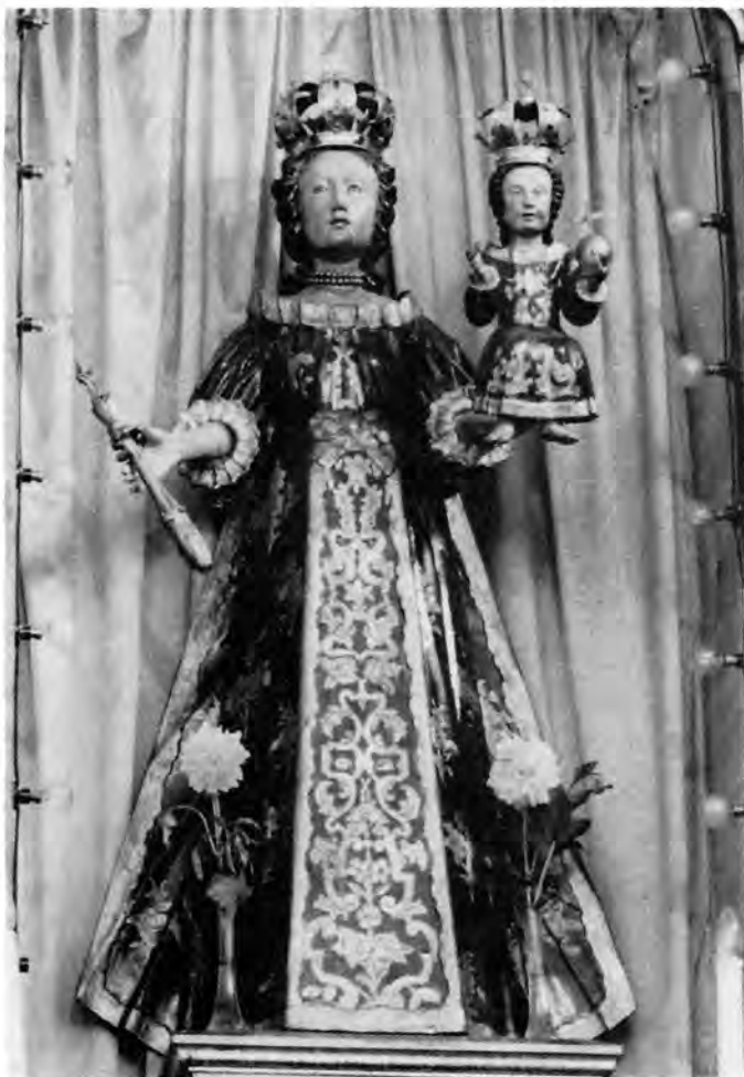
1 Drnje, župna crkva — glavni oltar. Marija s Djetetom, 1739.