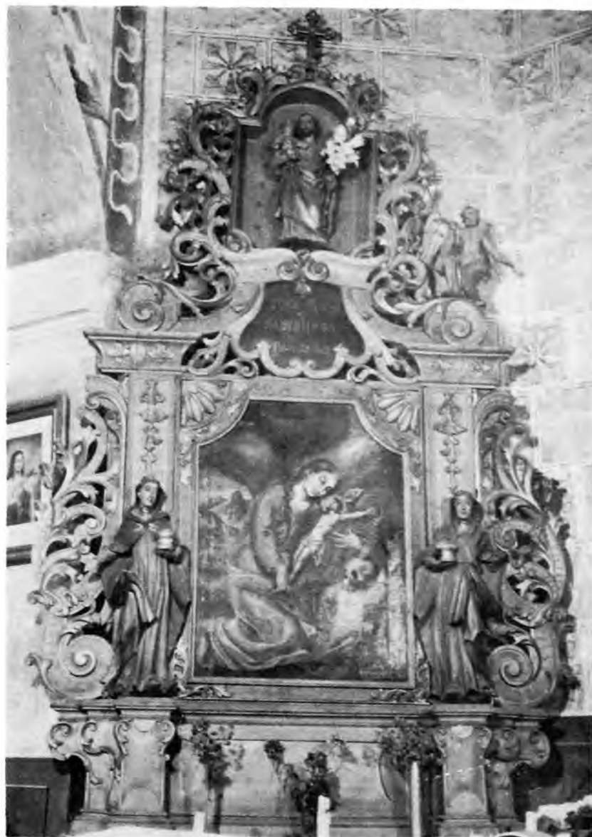
18 Turnašica, župna crkva — Pobočni oltar Sv. Marije Magdalene

Sa dva glavna oltara većih dimenzija zastupljen je kipar Severin u Otrovancu i Bojani. Oba su nastala već u šestom desetljeću 18. stoljeća, potkraj njegove djelatnosti. Oltar u Bojani u čazmanskoj regiji nešto je mlađi; nastao je oko godine 1752. (kronogram u kartuši nad oltarnom slikom navodi 1753. kao godinu bojenja i pozlaćivanja) za svetište ove lijepe, prostrane kapele moslavačke župe Draganec. 25 U cjelini gledano, arhitektura je tog bojanskog oltara konvencionalnija od križevačkih i podravskih retabla, sa svojim stupovima u ravnini i glavnim akcentom na širokom, mnogostruko profiliranom gređu. Gotovo sve dekorativne komponente oltara koncentrirane su na atici. Zanimljivi