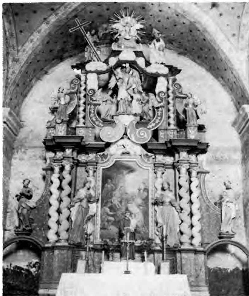
13 Đurđić, župna crkva — oltar sv. Tri kralja (prvobitno sv. Barbare)

Omiljeli su dekorativni motiv baroka kartuše. Njih Severin obilno primjenjuje na svojim oltarima i propovjedaonicama. Aplicirane su s natpisom nad slikom ili kipom patrona retabla ili nad kipovima postrance, u svojstvu konzole pod kipovima, između voluta atike, a najčešće na vrhu retabla. To su simetrične kartuše svedenih obrisa, ali plošne i ukružene poput štitova, bez elastičnosti obrisa unatoč tome što uske volute prate njihove rubove.