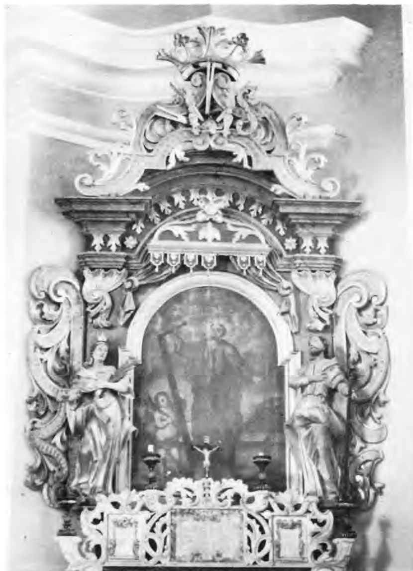
11 Virje, kapela sv. Jakova — oltar sv. Šimuna

Naborana oko okruglog vratnog izreza ta se košulja spušta prema struku gdje se mekano preklapa i pada do stopala oko kojih se nabire ili sunovraća u trokutastim formacijama. Plašt je ponekad ogrnut oko pretjerano uskih ramena i vezan čvorom, drugi put samo prebačen preko jednog ramena, da bi onda kružio oko tijela i sjeo s teškim, opuštenim naborom na istureni bok. Kod biblijskih likova — Joakim, Zaharija, proroci — unose se neki novi elementi, kao što su pelerine sa širokim ovratnicima, pojasevi, kratke tunike optočene resama, te kape i turbani maštovitih oblika. Razgolićena tijela s jedva naznačenim anatomskim pojedinostima stupa pred nas Ivan Krstitelj u svojoj krznoj isposničkoj odjeći. Više mogućnosti za raznolikost kostima pružali su Severinu likovi svećenika i redovnika, među kojima upadljivo često susrećemo isusovce u tamnom habitusu visoka ovratnika i s dugim nizom pu-