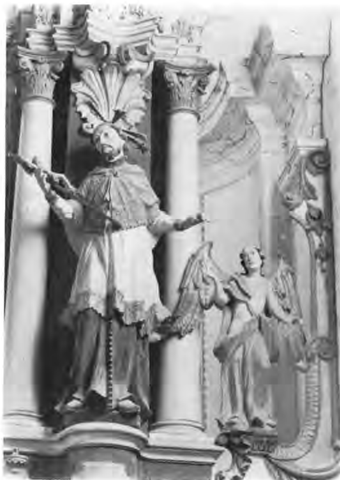
14 Bojana, kapela sv. Franje Ksaverskog — glavni oltar (detalj)

nim reznjevima ili kriškama — koja u bezbroj varijantata ukrašava Severinove oltare i propovjedaonice već tamo od početka četvrtog desetljeća 18. stoljeća. Uz te školjke javlja se i rešetka, taj omiljeni motiv marijaterezijanskog baroka. Katkad je taj motiv samo plitko uparan u glatku površinu drva, kao na torusu propovjedaonice u Koprivničkim Bregima, katkad su to samo jednostavne, ukrštene letvice, a posebno su dekorativne rešetke s rupičastim ili zvjezdastim probojima. Usto nalazimo i tipične suvremene simetrične uzorke vrpce opletene oko cvjetova i listova, nizove obješenih zvonolikih cvjetova i trostrukih listova, samo što su svi ti motivi kod Severina izgubili svoju uobičajenu sočnu nabubrelost i spljoštili se u otvrdnule forme. Veliki i uspravni šiljasti listovi, vezani u horizontalne nizove, motiv su kojim je barok ukrašavao vijence oltara i propovjedaonica, ali je i tu Severin jedva kada dvaput ponovio isti oblik lista. U nekoliko je varijanti zastupljen i jedan drugi, vrlo slikoviti ornamentalni motiv — uska vrpca koja formira krugove, koji se međusobno povezani zatvaraju oko upisanog cvijeta, a nalazimo ih udubljene ili ispupčene u osobito lijepoj izvedbi na propovjedaonicama u Ludbregu, Čazmi i Virovitici.