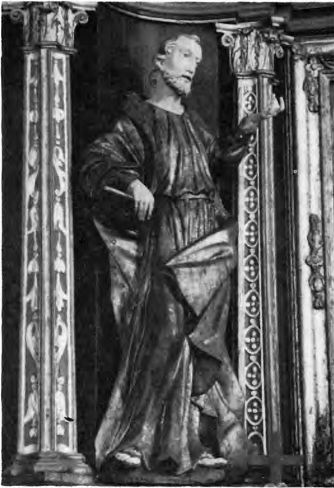
6 Novigrad Podravski, crkva sv. Klare. Glavni oltar (detalj)

razmjerno rijetka. Karakteristika joj je da plašt ne obavija svu figuru, nego ostavlja ruke potpuno slobodne, a zapravo se samo haljina i plašt u svom padu prema stopalima zvonoliko šire. Desnom rukom Marija drži žezlo, a na dlanu ispružene lijeve ruke sjedi Dijete također odjeveno u haljinicu zvonolika kroja i drži u ruci jabuku — kuglu zemaljsku. Biljeg vremena nastanka daje kipu široka ornamentalna pruga uzduž suknje, gdje se za to vrijeme tipična vrpčasta ornamentika u simetričnim uzorcima prepleće oko sitnih listića i cvjetova. Ovo Severinovo djelo steklo je popularnost među pukom preko tada vrlo omiljenih grafika poput drugih zavjetnih Bogorodica. Ta je grafika drnjanske Marije nedatirano djelo bakroresca Johanna Veita Kaupterza iz Graza, koji je često izrađivao bakroreze te vrsti za sjevernu Hrvatsku.