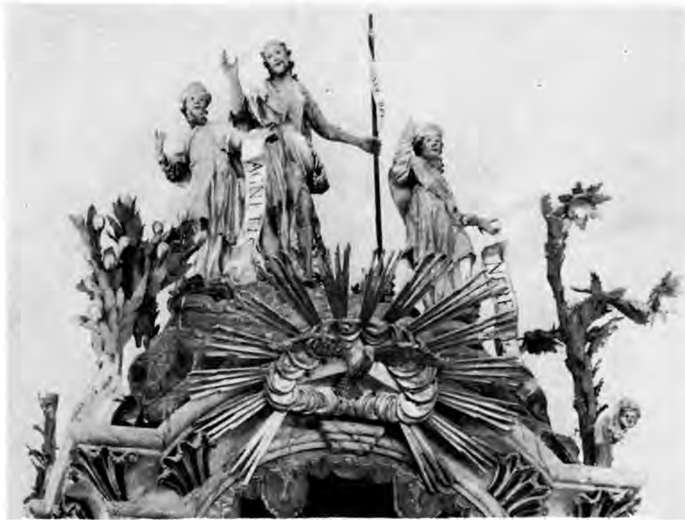
22 Čazma, župna crkva — Propovjedaonica (detalj baldahina)

stupom sa svake strane retabla i niskom, u širinu razvijenom atikom, koja je okrunjena natpisnom kartušom. Oltarima dominiraju slike i ornamentalni dekor, koji svoju raskoš naročito razvija na atikama s čipkastim krilima, koja se udvostručena okreću prema vanjskoj i unutarnjoj strani bočnih pilastara i tako uokviruju kipove. Ikonografski program obaju oltara jako je izmijenjen prilikom neke obnove. Uz Joakima i Anu nalazimo i u Novigradu Podravskom omiljele Severinove isusovačke svece Stanislava i Alojzija, dok se na atici među drugim kipovima javljaju redovnici sv. Ivan od Mathe i sv. Feliks, kao na oltaru u Bojani. I ti su oltari datirani brojkama u malim ukkladama predele, 1747. Pažnje je vrijedan okvir kanonskih ploča, gdje gusti splet vitica i voluta sjedinjuje sve tri table u jednu cjelinu. Na Severinov način rezbarenja podsjeća i veliki kip arkandela Mihovila s mačem i zmajem do nogu, kojem ne nalazimo traga u povijesnim izvorima ove kapele. Moguće je da je donesen iz crkve sv. Apostola, koja je imala inventar iz približno istih godina, vjerojatno također Severinov rad.