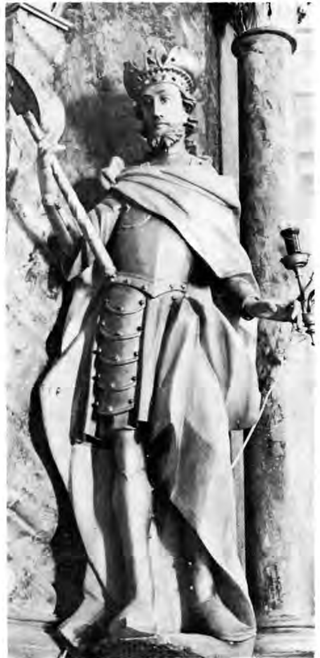
17 Turnašica, župna crkva — glavni oltar sv. Ladislava

Dva nešto mlađa oltara crkve u Đelekovcu u Podravini nažalost su došla do naših dana jako promijenjena i gotovo sasvim lišena svih ukrasa i ornamentata tako tipičnih za Severinovu radionicu. Nastali poslije 1752.