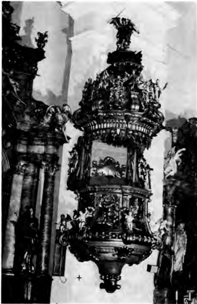
23 Virovitica, Franjevačka crkva — Propovjedaonica

Propovjedaonica u Koprivničkim Bregima (oko 1755) 38 priključuje se oblikom i ukrašavanjem ovim skromnijim primjercima, s razlikom da su se tu evanđelisti spustili na jastuke od oblaka na kojima sjede, razdvojeni snažnim ornamentiranim volutnim pilastrima. I ovdje je nabreklina podnožja lijepo ornamentirana cvjetnim motivom na uparanoj rešetkastoj pozadini. Originalni baldahin propovjedaonice nije se sačuvao. Današnji je nadomjestak s početka 19. st.