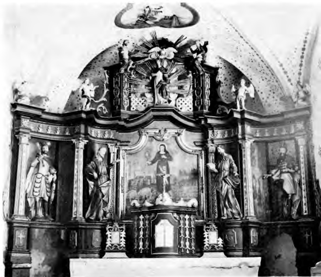
19 Novigrad Podravski, crkva sv. Klare (glavni oltar)

Severin postavio novi glavni oltar (sl. 15) na dva kata s mnoštvom kipova, jedno od svojih najslikovitijih ostvarenja. Kao da je tu još jednom dao maha svoj svojoj mašti pokrajinskog majstora i prosuo po tom oltaru svo bogatstvo svojih živopisnih ukrasnih i ornamentalnih tvorbi. Napose u donjem dijelu oltara vlada pravi horror vacui, svaki je slobodni prostor između stupova ispunjen krilima s rešetkastim i rupičastim perforacijama, a oko kipa sv. Helene, koji stoji pod kupolastim baldehinom, zatvaraju ukrštene rešetke s cvjetovima na križićima prozračnu nišu. Tri okrunjene svete u sredini oltara prate postrance kralj Stjepan i vojvoda Emerik, a naatici iznimno ne stoluje sv. Trojstvo, nego Ivan Evanđelist u pratnji Ivana Krstitelja i Zaharije.