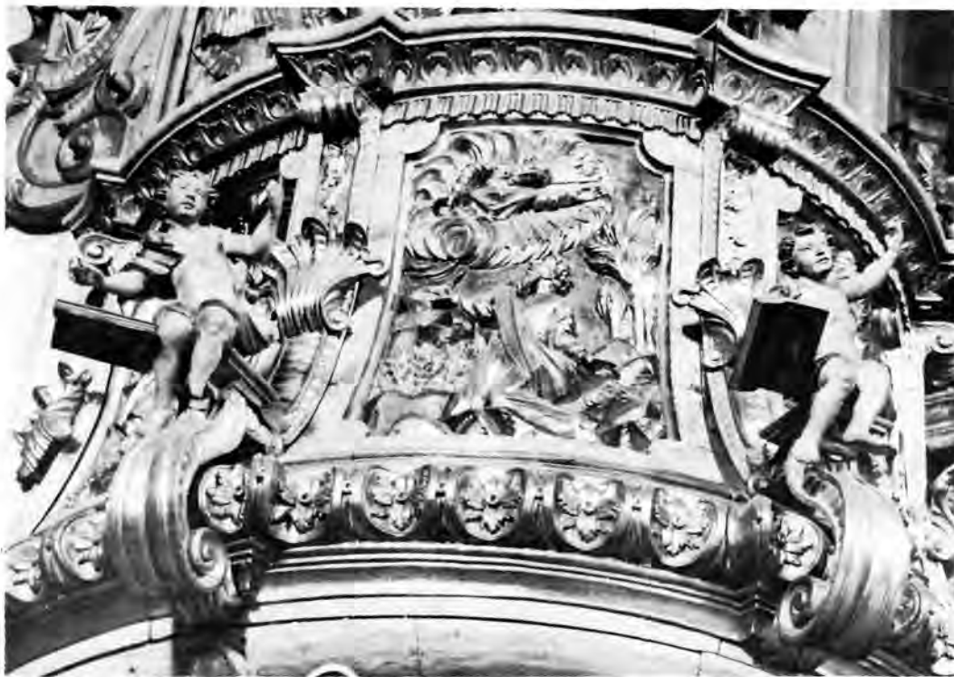
24 Virovitica, Franjevačka crkva — Propovjedaonica (reljef »Mojsije pred gorućim grmom«)

bu. Na humku iznad krovića stoji Ivan Krstitelj također okružen prorocima s natpisnim banderolama. Na uglovima baldahina vidimo bizarne, visoke grmove s plodovima i cvjetovima, jedini sačuvani primjerci jednog osebnog dekorativnog motiva, koji je kipar Severin češće primjenjivao (sl. 22).