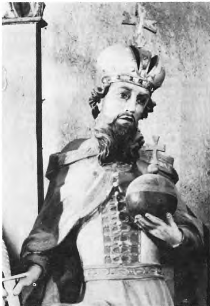
4 Virje, župna crkva — glavni oltar. Kralj Stjepan, detalj