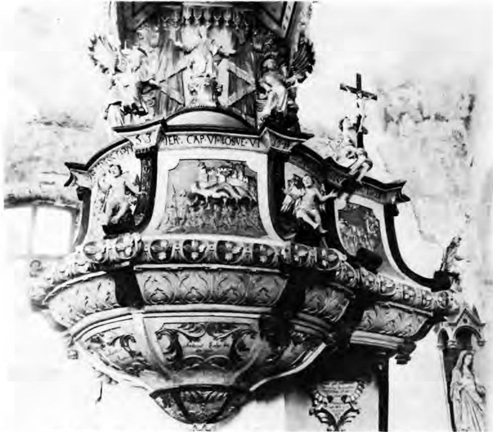
21 Čazma, župna crkva — Propovjedaonica (reljef »Trublje Jerihonske«)

vom i kipom Ivana Krstitelja na vrhu. Propovjedaonica također, u odnosu na kasnija Severinova ostvarenja, prilagođuje svoj oblik skromnoj unutrašnjosti seoske crkve. Poligonalni parapet govornice razdijeljen je uskim volutnim pilastrima između kojih stoje kipovi četiriju evanđelista, svaki sa svojim simbolom, po svemu tipični likovi našeg majstora. Baldahin je nizak, zapravo samo vijenac obrubljen lambrekenima s kojeg se spuštaju okrajci zavjese. Na njegovu rubu sjede dva anđela, a nad čeonom stranom podižu se dvije volute, koje se na vrhu spajaju pod plamenim srcem i sidrom.