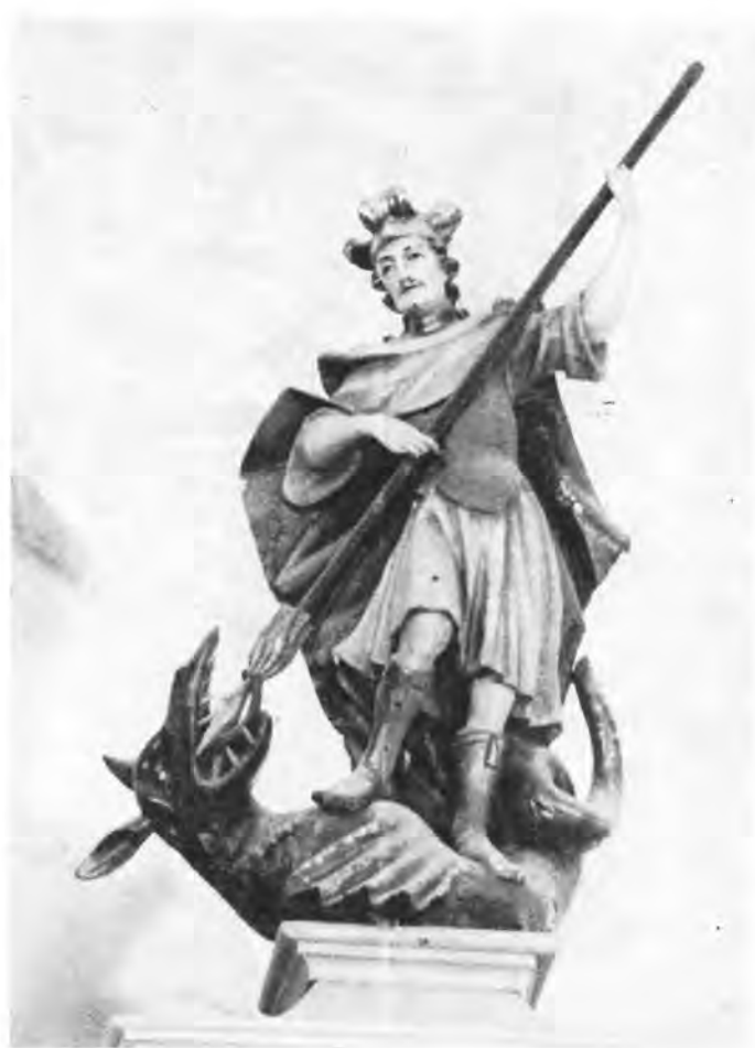
5 Virje, župna crkva — oltar Spasitelja. Sv. Juraj

je mjesto došao veliki drveni retabl od Schmalzla iz Tirola u historicističkom stilu. Jedino je u središnjoj niši oltara ostao stajati Severinov zavjetni kip Marije s Djetetom , koji se u župi štovao kao čudotvoran, što ga je spasilo od uništenja. 9 Spomenica župe opisuje čudesa koja su se tom kipu pripisivala u lijepoj staroj kajkavštini. 10