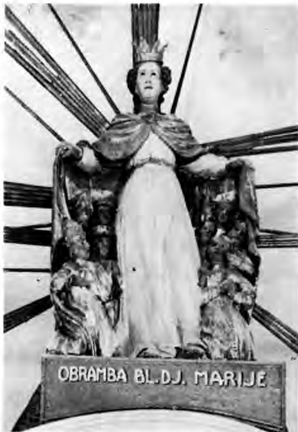
16 Virje, župna crkva — glavni oltar Marije zaštitnice

mu se često kompletno opremanje crkve novim inventarom, kao što je to bio slučaj u Novigradu Podravskom i Turnašici, dok je drugdje postavio jedan ili dva oltara ili koji drugi dio crkvene opreme. Bilo je među njima župnih crkava, ali i malih filijalnih kapela. Crkve koje je uredio novim namještajem bile su u njegovo doba manje građevine, često drvene, kao što je to bio slučaj s Drnjem, lijepim primjerkom te davno nestale autohtone arhitekture. Danas se u većim novogradnjama njegova djela pomalo gube i ansambli su bez sumnje izgubili na izvornoj draži.