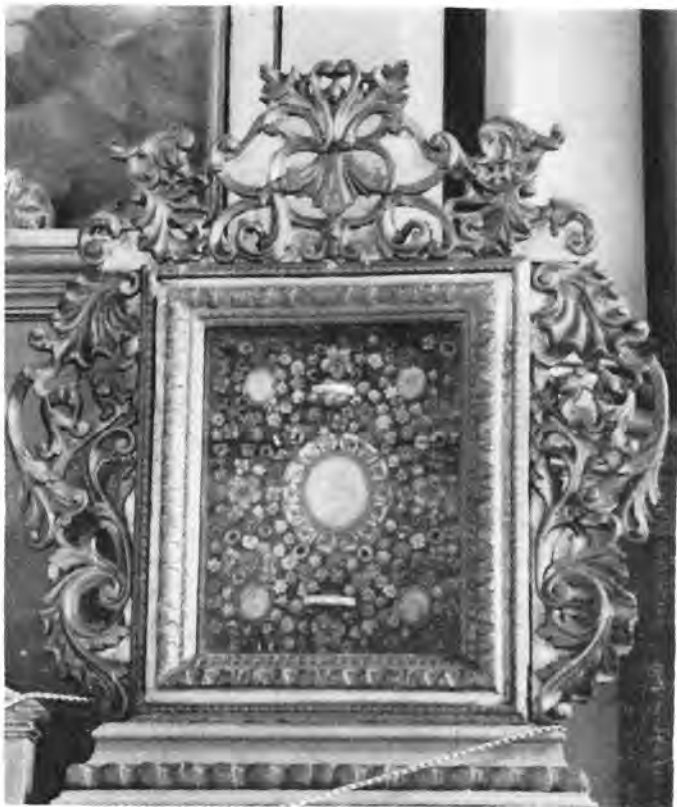
9 Virje, župna crkva — glavni oltar (relikvijar)

namentalno ukrašenu odjeću. Ni uobičajeni stojni motiv s iskoračenom, u koljenu savijenom nogom ne može dinamizirati te likove, kojima samo pokreti dugačkih tankih ruku i teški prijeklop plašta nad isturenim koljenom podaju nešto prirodne životnosti. Veća visina kipova, diktirana proporcijama oltarnog retabla, često dovodi do disproporcija zbog pretjerano dugačke linije nogu i malenih glava. Prirodniji su stoga likovi manje formata, gdje se katkad tjelesni oblici i obrisi lica prirodnije zaobljuju. Naročito karakteristične su Severinove glave tipiziranih lica, koja se stalno opetuju bez obzira na ikonografsku determinaciju lika, starost ili spol. To su dugoljasta, mršava lica, bez mimike i psihčke diferencijacije, najčešće tmurna i pomalo staračka izraza (sl. 4). Obilježuje ih visoko čelo, koščate jagodice, oštri ravni hrbat klinasta nosa i krupne oči s visoko svedenim i zaobljenim gornjim kapkom koji se spušta prema ušiljenom vanjskom kutu oka. Plastično izbočenje toga kapka lagano zasjenčuje oko, ovisno o upadu svjetla, i to je gotovo i jedini elemenat koji oživljuje te fizionomije. Okružuje ih kosa koja se nikada ne odvaja kovrčama od glave, nego se razdjelkom po sredini tjemena priljubljuje uz sljepočnice, potegnuta sitnim kružnim uvojcima iz lica, da bi od potiljka pojedinačni tanki pramenovi padali niz vrat i ramena.