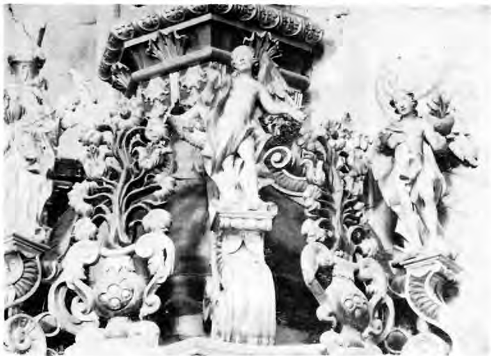
8 Virovitica, Franjevačka crkva — propovjedaonica (detalj)

o tipu ornamentike svjedoči veliki relikvijar s raskošno rezbarenim okvirom od voluta, listova, rešetki i školjka-stih tvorbi.