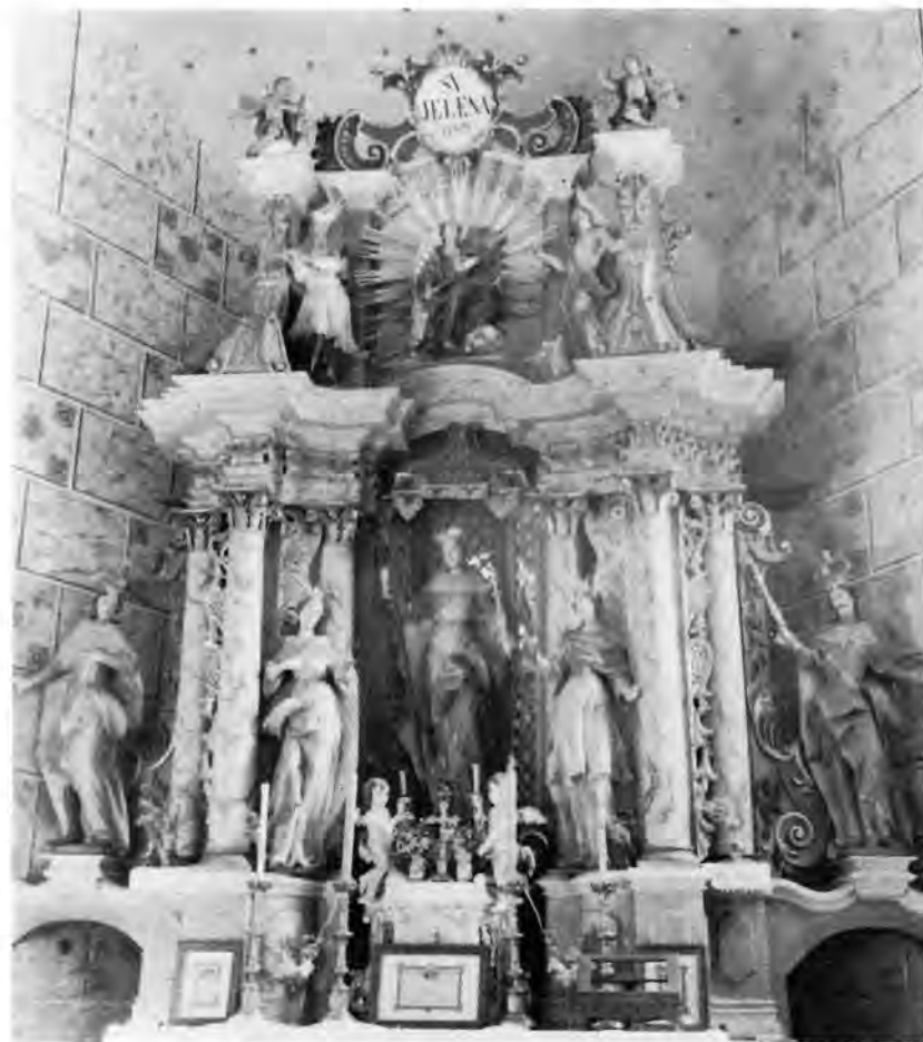
15 Otrovanec, kapela sv. Helene — glavni oltar