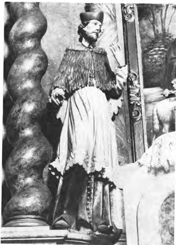
10 Garešnica, župna crkva — sv. Jeronima na pobočnom oltaru

Među jednostavnije odjevne kipove spadaju apostoli, likovi Krista i Boga Oca, te evanđelisti u dugačkim košuljama ili haljama pod čijim je glatkim potezima nabora tijelo prisutno samo u obrisnim linijama.