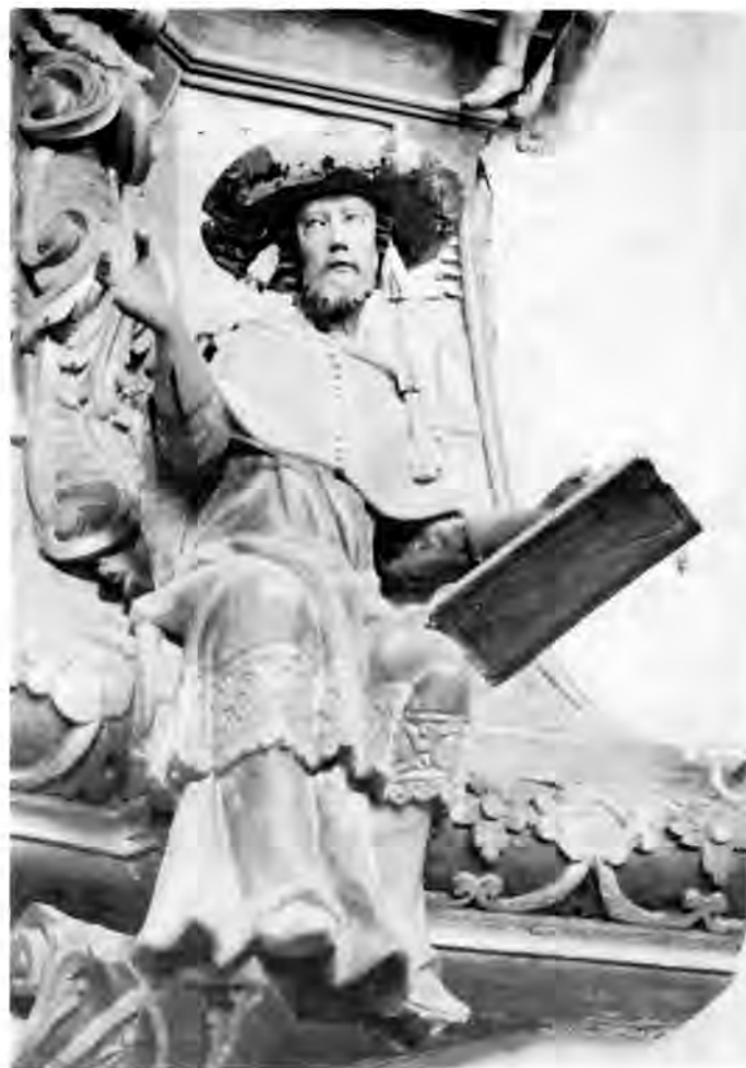
20 Ludbreg, župna crkva — Propovjedaonica (Sv. Jeronim)

Najkompletniji ansambl križevačkog kipara stoje još i danas u župnoj crkvi u Turnašici i u kapeli sv. Klare u Novigradu Podravskom. Turnašica je u novijoj, 1778. godine sagrađenoj crkvi sačuvala stari inventar iz prijašnje građevine, koji je nastao u prvoj polovici petog desetljeća 18. stoljeća. Glavni oltar sv. Trojstva i dva pobočna oltara sv. Marije (danas Srca Isusova) i sv. Marije Magdalene čine zajedno s propovjedaonicom i krstionicom skladnu cjelinu. Bočni oltari sa svojim virtuozno rezbarenim razlistalim krilima od rovašene volutne vrpce, iz koje niču akantusovi listovi i veliki cvjetovi, čipkasto se silhuetiraju pred trijumfalnim lukom i vode pogled prema nešto skromnije ukrašenom i ozbiljnije ugođenom glavnom oltaru. Taj je potonji nastao već godine 1738. kao dvokatni retable naglašene dubine, s tordiranim pilastrima do oltarne slike i glatkim stupovima koji, istaknuti u prostor, nose grede na kojim počiva volutama uokvirena atika jednake širine. Po suvremenim opisima 31 bio je izvorno veći, vjerojatno proširen ophodima na kojima su bili smješteni kipovi svetih kraljeva Stjepana i Ladislava (sl. 17). Nestankom ophoda izgubljena su i dva kipa tog oltara, i to crkveni oci Augustin i Ambrozije, a cijeli je oltar izgubio gubitkom širine na prvobitnom dojmu. Pred jako razvijenim bočnim volutama atike stoje preostala dva crkvena oca,