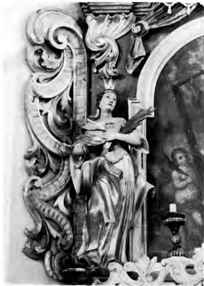
12 Virje, kapela sv. Jakova — oltar sv. Šimuna, Sv. Katarina

kratka pelerina od hermelina, a na glavama su bogato urešene krune. Slični su elementi kostima zastupljeni i kod raznih svetih vitezova (Juraj, Florijan, Donat, Martin) većinom u stiliziranoj odori rimskog časnika, sa šljemovima s perjanicama. U sličnoj odori bori se i sv. Mihovil protiv đavla koji se previja pod njegovim nogama u obliku fantastične ljudske nakaze ili zmaja razvaljenih čeljusti s nizom oštih zuba (sl. 5). Kod svetica vlada veća jednoličnost kostima, ali se i tu pojedini elementi efektno variraju. S iznimkom malobrojnih sačuvanih kipova starozavjetnih matrona (Ana, Elizabeta) javlja se kod Severina uvijek svetica velikašica, u ornamentiranom kratkom oklopu, stegnuta u struku širokim pojansom, ogrnuta naborima plašta koji je često optočen ili podstavljen krznom, a na glavama tih svetica primjećujemo široke dijademe natisnute duboko na čelo ili male krunice šiljastih zubaca.