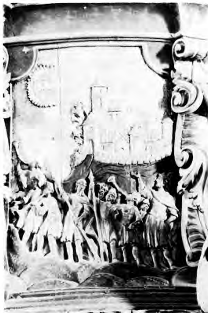
25 Ludbreg, župna crkva — Propovjedaonica (reljef „Trublje Jerihonske“)

S djelima za Koprivničke Brege i Otrovanec, a posebno s propovjedaonicom za Viroviticu, njegovim možda