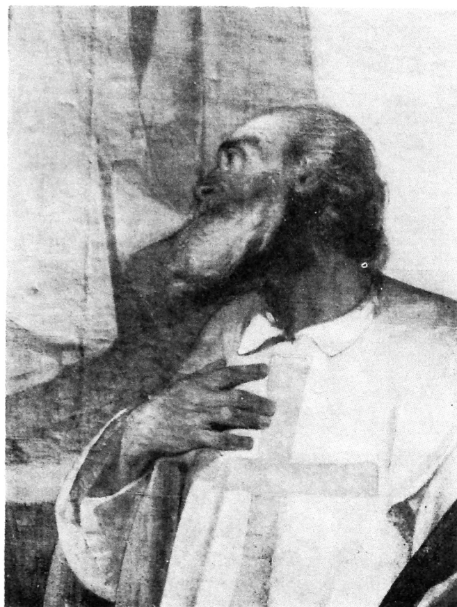
E. Moretti Larese, sv. Vinko mučenik (detalj)