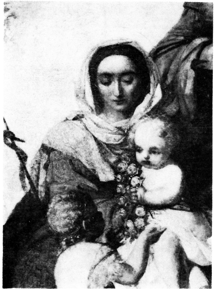
E. Moretti Larese, Bogorodica s Isusom (detalj)