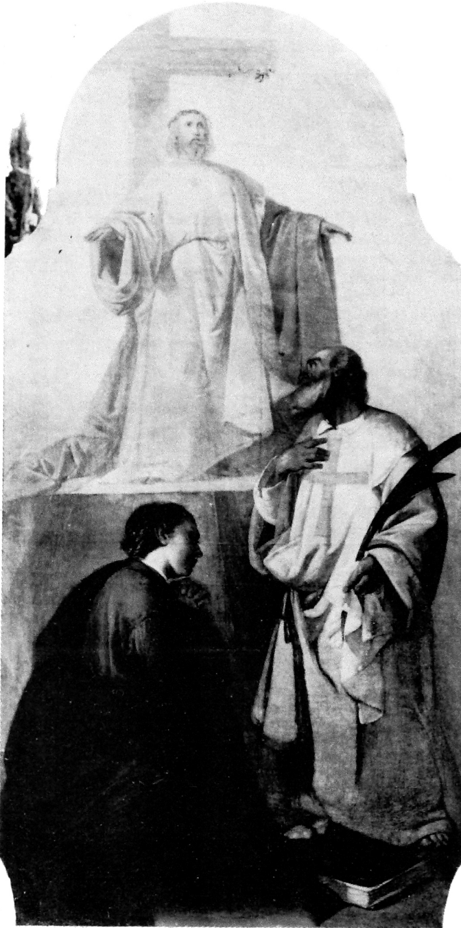
E. Moretti Larese, Srce Isusovo i sveci Vinko Mučenik i Stanislav Kostka — Vodice, župna crkva

mlad razbolio se i umro gotovo potpuno zaboravljen malo nakon navršene pedesete godine. 2