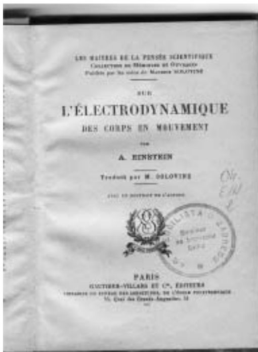
Slika 3. Najstarija Einsteinova knjiga iz fonda SKF-a (1916.)