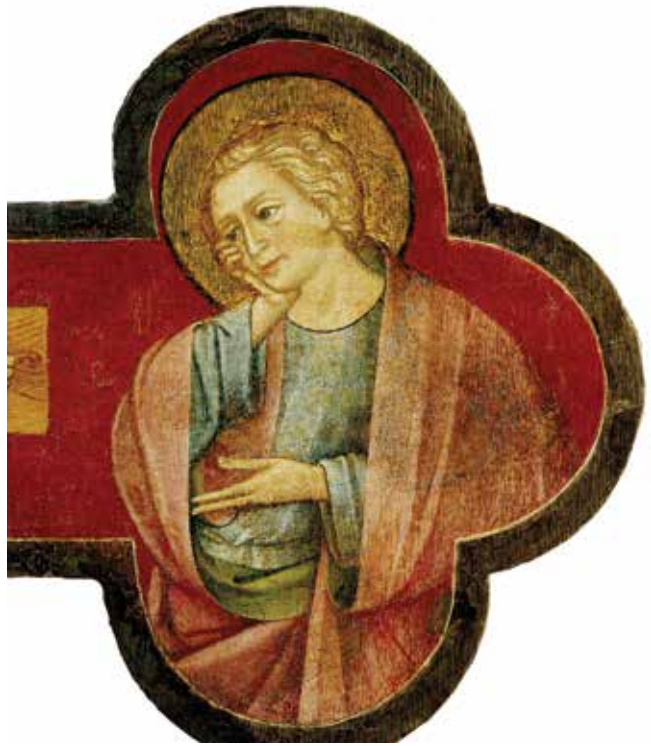
Menegelo Ivanov de Canali, Slikano raspelo (detalj), Tkon, samostan sv. Kuzme i Damjana

Marko Nikolin from Dubrovnik (?), Painted Crucifix, Convent of St Lucy in Šibenik, a detail