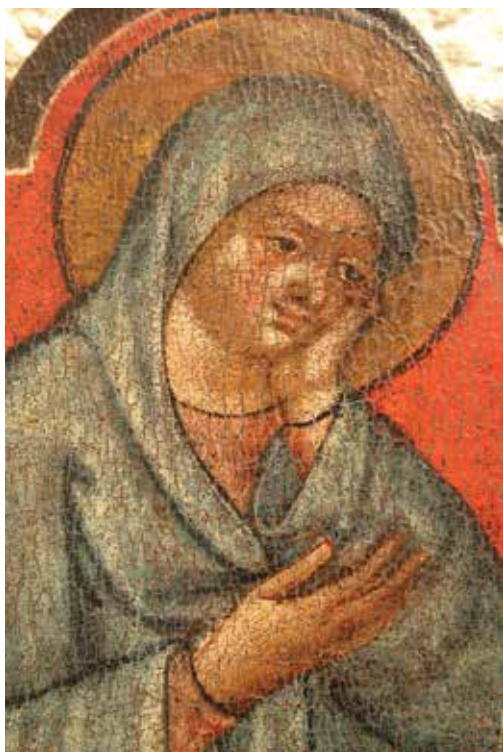
4. Marko Nikolín iz Dubrovnika (?), Slikano raspelo (detalj), Šibenik, samostan sv. Lucije

Marko Nikolín from Dubrovnik (?), Painted Crucifix (detail), Convent of St Lucy in Šibenik