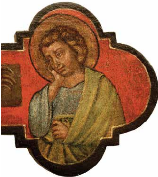
Marko Nikolin iz Dubrovnika (?), Slikano raspelo (detalj), Šibenik, samostan sv. Lucije

Ma koliko bi trebalo izbjegavati hipoteze bazirane na hipotezama, naznake da je raspelo iz samostana sv. Lucije u Šibeniku možda djelo Marka Nikolina iz Dubrovnika ne bi trebalo zanemariti u budućim istraživanjima, pogotovo u svjetlu novijih spoznaja vezanih uz problematiku dubrovačkoga trećentističkog slikarstva. Naime, otkriće da slikani poliptisi koji su sve donedavno pripisivani Ivanu Ugrinoviću (poliptih iz crkve sv. Antuna Opata na Koločepu) i Matku Junčiću (poliptih iz crkve Gospe od Šunja na Lopudu) nisu arhaični radovi iz tridesetih i pedesetih godina 15. stoljeća nego kvalitetna djela zreloga gotičkog slikarstva s kraja 14. stoljeća, 22 nužno otvara problematiku slikarskog kruga ili radionice koja je mogla iznjedrili takva ostvarenja. 23 Pritom, navedenim poliptisima svakako treba pridružiti i triptih s prikazom Bogorodice s Djetetom između sv. Ivana Krstitelja i sv. Petra iz crkve sv. Klimenta u Mostaćima, 24 koji je također dugo smatran arhaičnim radom iz 15. stoljeća, 25 a koji je nedavno Zoraida Demori Staničić uvrstila u grupu dalmatinskih radova iz kruga Paola Veneziana i njegovih sljedbenika. 26 Time je kompleks dubrovačkoga kasnogotičkog slikarstva,