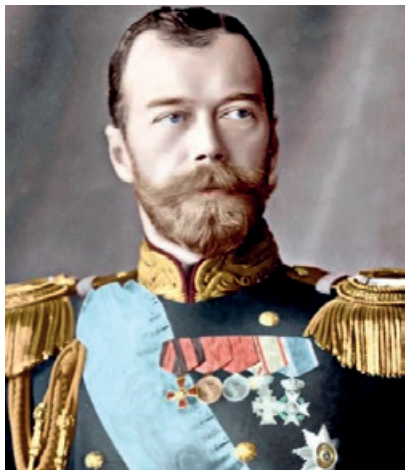
Njemački car Wilhelm II. Hohenzollern