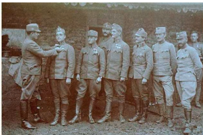
Domobranci 25. (zagrebačke) pješačke pukovnije