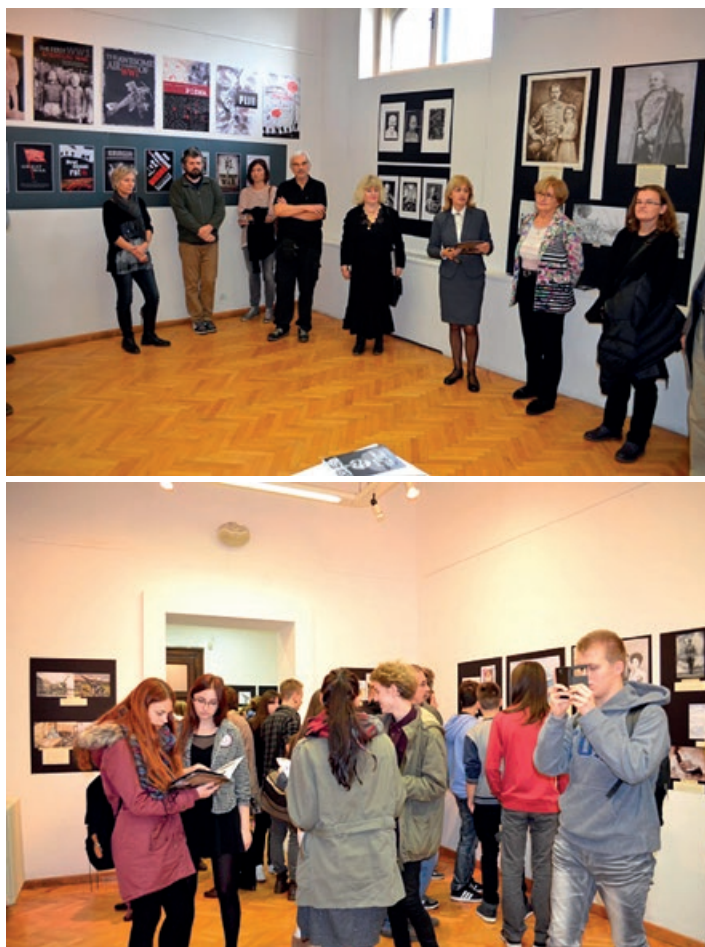
Sl. 1.-2. Fotografije s otvorenja izložbe u Izložbenom salonu Izidor Kršnjavi u Školi primijenjene umjetnosti i dizajna u Zagrebu

Primjerom iz prakse, interdisciplinarnim projektom: Veliki rat - zaboravljeni rat? 1914.-2014. , iznijet ću kako su u Školi primijenjene umjetnosti i dizajna u Zagrebu nastavnici povijesti, crtanja i slikanja i grafičkog dizajna pridobili učenike i zainteresirali ih za ovu kompleksnu i važnu temu kao što je Prvi svjetski rat.