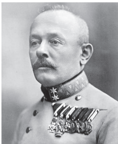
Austro-ugarski feldmaršal Svetozar Boroević (Borojević) von Bojna.