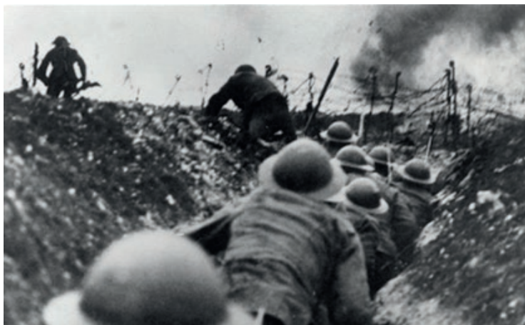
Vojnici u rovovima