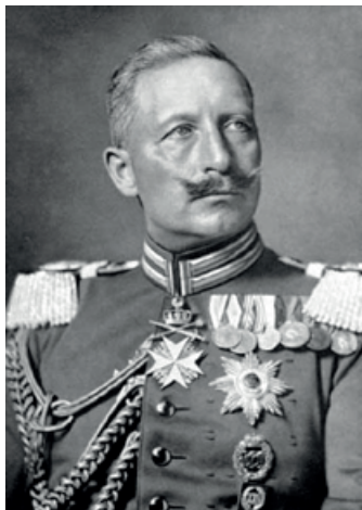
Ruski car Nikolaj II. Romanov