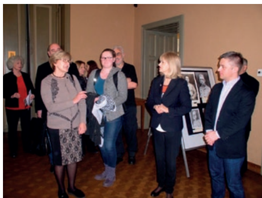
Sl. 10.-11. Fotografije s otvorenja izložbe u Staroj gradskoj vijećnici u Zagrebu.