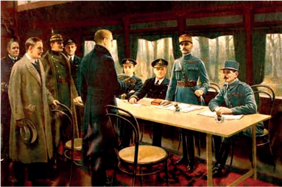
Potpisivanje primirja s Njemačkom, 11. studenoga 1918. u 11 sati, u željezničkom vagonu u šumi Compiègne u sjevernoj Francuskoj.

Koristeći se predloškom za postavljanje pitanja, analizirajte i interpretirajte zadane slike/fotografije. Raspravite u grupi kako biste vi iskoristili zadane slikovne izvore u nastavi. U kojem djelu sata biste ih koristili i u kojem kontekstu? S kojim ciljem? Koje strategije biste primijenili u radu sa zadanim slikovnim izvorima? Koja biste pitanja postavili?