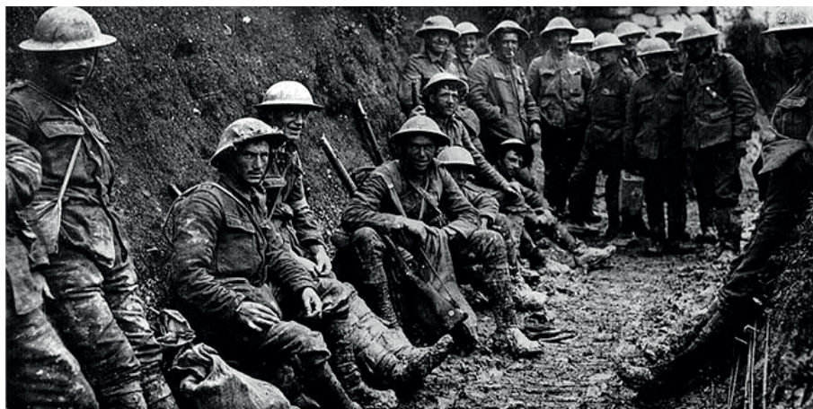
Vojnici u rovovima