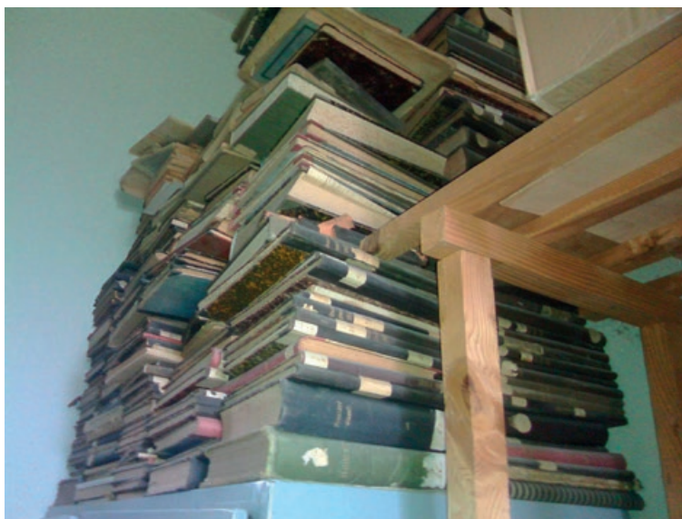
Slika 2. Smještaj pronađene građe

Građa je sačuvana zahvaljujući činjenici da je pohranjena u suhom prostoru te zaštićena od slučajnih mehaničkih oštećenja jer je bila na visini i podalje od sunčevih zraka (Slika 2). Nema laičkom oku vidljivih fizikalno-kemijskih oštećenja, ali postoji sumnja na prisutnost bioloških oštećenja od kukaca.