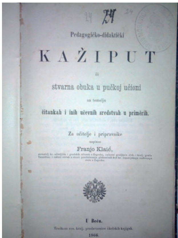
Slika 3. Naslovna stranica najstarije do sada pronađene knjige ( Pedagogičko-didaktički kaži put ili stvarna obuka u pučkoj učionici na temelju čitankah i inih učečnih sredstvih u priměrlih: za učitelje i pripravničke Franje Klaića iz 1866.)