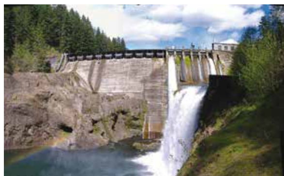
Slika 4. Fotografija brane Condit na rijeci White Salmon ( http://www.pacificcorp.com/condit )

Primjer vrlo različit od prethodno iznesenog odnosi se na branu Condit. Radi se o betonskoj gravitacionoj brani visine 38 m izgrađenoj između 1911. i 1913. na rijeci White Salmons, pritoci rijeke Columbia u koju utječe oko 5,5 km nizvodno od brane Condit. Izgrađena je s ciljem proizvodnje električne energije u području koje se tada snažno industrijski razvijalo te je oskudijevalo energijom. PacifiCorp kao vlasnik brane i postrojenja odlučio je ukloniti branu. Kao glavni razlog navodi se obnova prirodnih putova lososa te staništa pastrva i drugih ugroženih ribljih vrsta u skladu s novim federalnim zakonima. Već sam naziv rijeke White Salmon (Bijeli Losos) na kojoj je brana izgrađena svjedoči o tome da je ona u prirodnom stanju predstavljala važan migracijski put za losose. Međutim, ne treba biti naivan te misliti da je briga za losose i druge riblje vrste bila glavni razlog uklanjanja ovog objekta. On je bio star, skoro 100 godina, akumulacija je bila zapunjena nanosom, a proizvodnja električne energije više nije bila ekonomski isplativa. Međutim, ekolozi i lokalno stanovništvo su njeno uklanjanje doživjeli kao veliki uspjeh svojih čestih prosvjeda.