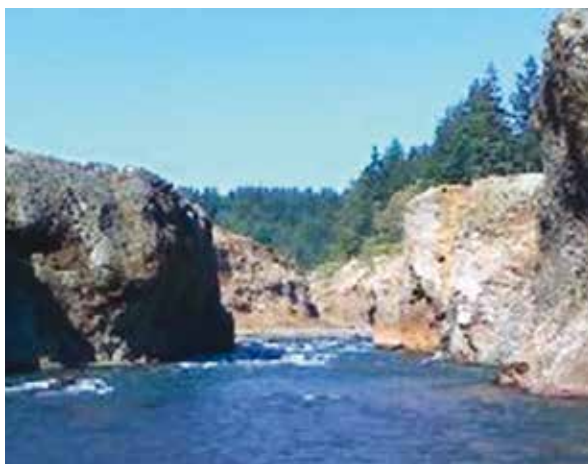
Slika 5. Fotografija mjesta na kojem je nekoć bila brana Condit na rijeci White Salmon ( http://www.pacificcorp.com/condit )

400 m 3 /s u samo 20 minuta poslije eksplozije (O'Connor et al., 2012.). Preostali dio brane bio je uklonjen tijekom sljedećih deset mjeseci. Treba naglasiti da je sam čin uklanjanja brane bio tek prvi korak u restauraciji White Salmon rijeke, tj. u obnovi njenih vrijednih prirodnih ekoloških funkcija.