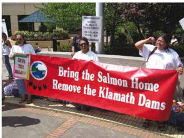
Slika 3. Protest stanovnika Oregona kojim se traži uklanjanje četiri brane na rijeci Klamath koja protječe kroz Oregon i Kaliforniju (SAD) ( http://en.wikipedia.org/wiki/Dam_failure )

Ekologija, zaštita okoliša i biološka raznolikost danas predstavljaju važne teme s kojima se najlakše senzibilizira javnost i kojima se stoga u sredstvima javnog informiranja pridaje veliko značenje. Na toj osnovi koncipirani razlozi mogu poslužiti (i nerijetko poslužiti) kao ključan argument za uklanjanje pojedinih brana, iako se iza tih akcija mogu kriti brojni drugi razlozi, obično oni tehničke, ekonomske ili političke prirode. Zbog kompleksnosti, ali i visoke cijene zahvata uklanjanja i za sada nedovoljnog poznavanja ove problematike treba biti oprezan i kritičan kod donošenja odluka. Oprez i kritičnost treba temeljiti na znanosti i iskustvu. O tehničkim razlozima bit će detaljnije govora u sljedećem poglavlju ovog rada.