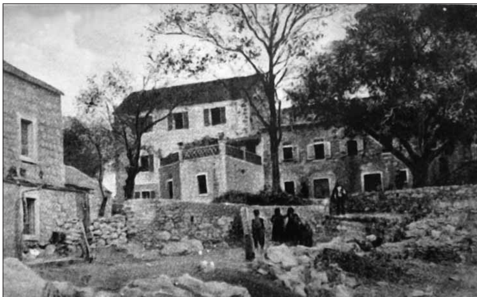
Rogotin početkom 20. stoljeća (središte mjesta)