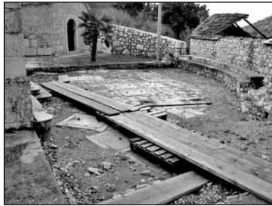
Groblje ispred crkve

Čini mi se da se na osnovu svega rečenog može zaključiti da su se Rogotinjani najkasnije od 1797. pokapali na groblju ispred crkve u Rogotinu.