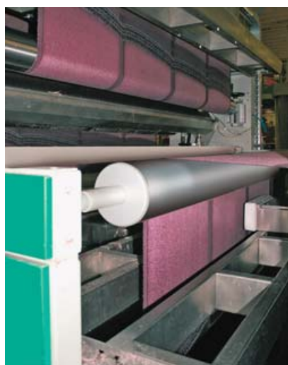
Sl.2 Postrojenje za obradu frotir tkanine

MatexEco, po stavkama prikazane su u tab.2.