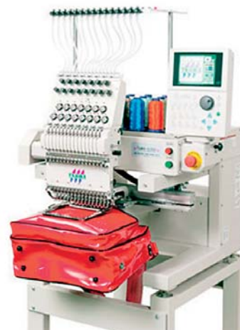
Sl.1 Izbor iz Tajima strojeva za vezenje