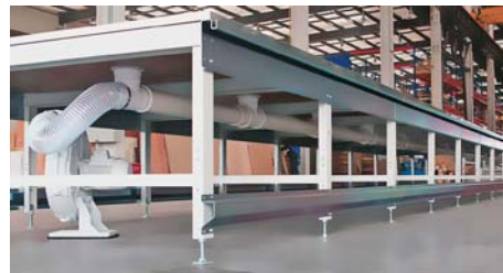
Sl.1 I-Table tvrtke Gerber Technology za automatizirane sustave polaganja i iskrojavanja

Virtualna izrada uzoraka je odgovor na smanjenje vremena i troškova kod