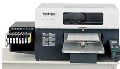
Sl.2 GT 3 serija printera za direktni tisak na odjeću sa CMYK i 4 bijele ispisne glave

rektni tisak na odjeću sa CMYK i 4 bijele ispisne glave, sl.2.