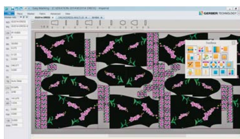
Sl.3 Gerberov AccuMark® 10 omogućuje velika skraćenja vremena razvoja i izrade uzoraka