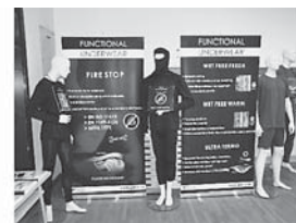
Sl.7 Izložba funkcionalnih materijala, odjeće, obuće i opreme