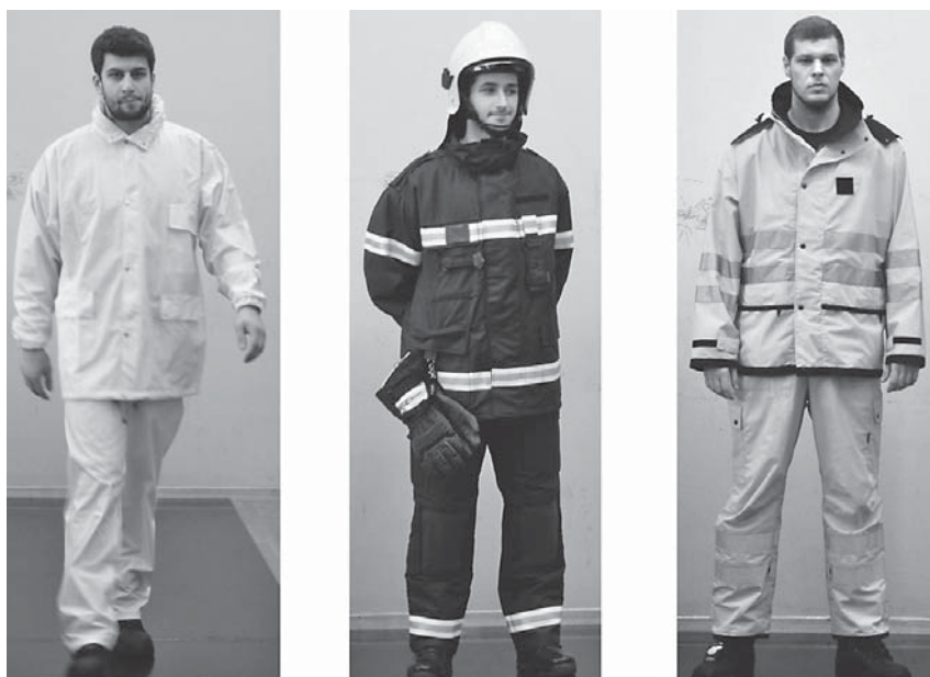
Sl.3 Prezentacija modela funkcionalne odjeće hrvatskih proizvođača: a) jakna i hlače naslojene poliuretanom za zaštitu od kiše; b) interventno vatrogasno odijelo namijenjeno za gašenje požara zatvorenih prostora i c) dvodijelni komplet (jakna i hlače) izrađen od Gore-tex® materijala

Na samom kraju prezentacije predstavljani su modeli funkcionalne odjeće, obuće i opreme koja je izrađena u okviru razvojnih znanstveno-istraživačkih projekata koji su provedeni na