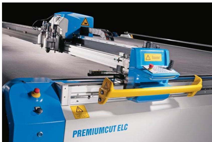
Sl.4 topcut-bullmer - CNC stroj za iskrojavanje niskih slojeva PREMIUMCUT s izmjenljivim alatima

Posljednjih godina smo također imali koristi od velikog broja posjetitelja