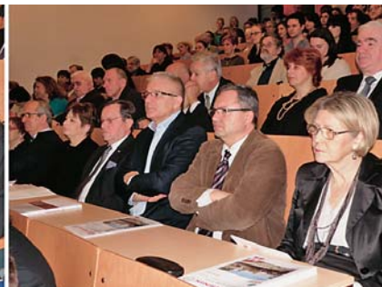
Sl.2 Sudionici Svečanosti na – predstavljanje aktivnosti TTF-a akademskoj godini 2013./2014.