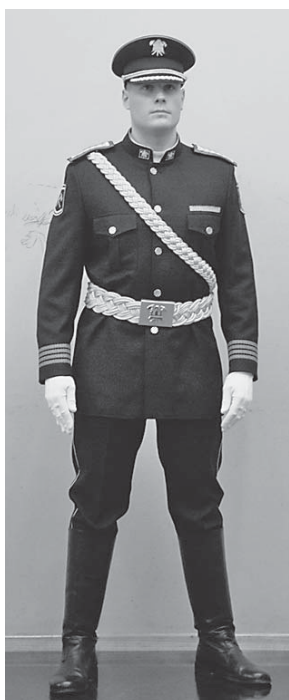
Sl.5 Odora Počasne postrojbe Vatrogasne zajednice Grada Zagreba

Vunena kapa klasičnog oblika, izrađena od kulirnog pletiva, tamno plave boje, podstavljena, a s prednje strane našiven je hrvatski grb i lovorov vijenac. Pulover je izrađen od tamnoplavog obostranog desno-desnog kulirnog pletiva i namijenjen je temeljnoj, graničnoj i interventnoj policiji, upra-