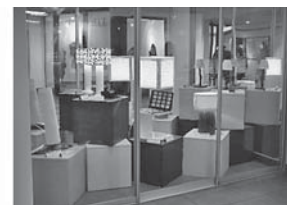
Sl.8 Izložba studentskih radova s temom funkcionalnih materijala i odjeće

skladu s najstrožim mikrobiološkim zahtjevima. Vlakna se prodaju industriji netkanog tekstila, te proizvođači netkanog tekstila prodaju svoje proizvode kozmetičkoj industriji gdje se izrađuju maske za lice.