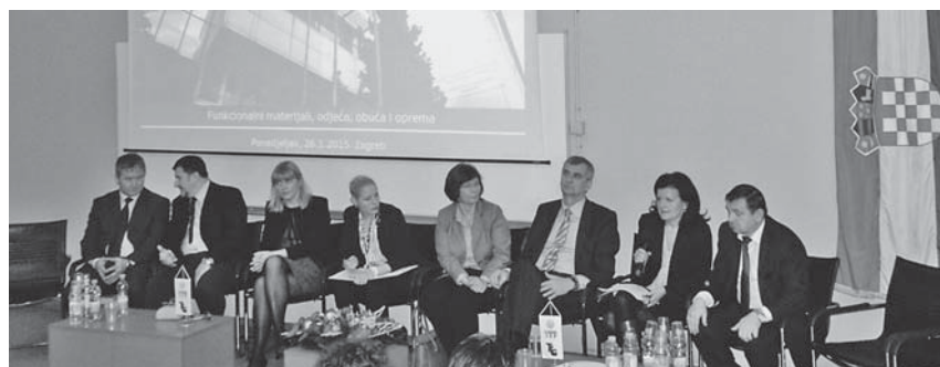
Sl.2 Okrugli stol s temom Hrvatski klasteri konkurentnosti – mogućnost izlaska iz krize

U popodnevnom dijelu održana je modna revija Škole za modu i dizajn iz Zagreba na kojoj je prikazan dio kolekcija iz fundusa. Pojedine kolekcije su nastale kao rezultat sudjelovanja na državnim natjecanjima Dani odjeće. Kolekcije su prezentirale učenice škole, članice Manekenske sekcije.