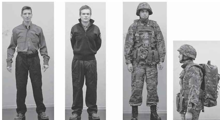
Sl.6 Funkcionalna odjeća, obuća i oprema realizirana u projektima Sveučilišta u Zagrebu, Tekstilno-tehnološkog fakulteta i MUP-a i MORH-a: a) hlače i košulja za temeljnu, prometnu i graničnu policiju; b) hlače i pulover za temeljnu, graničnu i interventnu policiju; c) vojničke čizme crne paropropusne i vodonepropusne, borbeni prsluk modularnog tipa i vojnička naprtnjača

vi za posebne poslove sigurnosti te za policijske službenike koji se upućuju na rad u inozemstvo (sl. 6b). Zimske hlače tamno plave boje za temeljnu, prometnu i graničnu policiju, ravna komotnijeg kroja sa dva koso ušivena džepa (sl.6a). Košulja dugih rukava sivo-plave boje za temeljnu, prometnu i graničnu policiju (sl.6a).