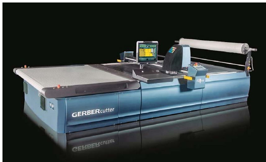
Sl.2 Sajamska premijera stroja za iskrojavanje Cutter Paragon® Gerber Technology

dan način i s velikom sinergijskom korišću. Razvoj proizvoda koji se konstantno ubrzava doživljava vrhunac u potrebi da se sve veći broj podataka mora koordinirati u kratkom vremenu. Da bi se moglo efikasno, sigurno i uspješno reagirati na potrebe tržišta i modne trendove, Gerber nudi nove i impresivne opcije u paketu Product Life Management Yunique PLM V6. Na sučelju za automatsko iskrojavanje Gerber će predstaviti svoj automatizirani softver za uklapanje MC s još tri posto povećanim stupnjem iskorištenja u odnosu na rješenja s jednom glavnom memorijom. Gerber predstavlja i novi stroj za iskrojavanja Paragon®. Ovamo pripadaju LX serija za izradu malih serija