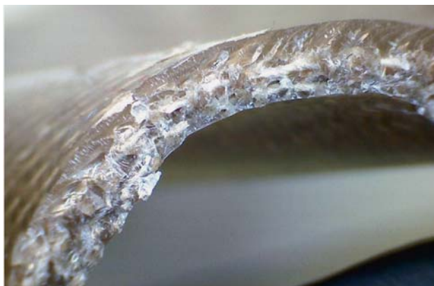
Sl.1 Organske ploče načinjene od prirodnih vlakana

Zahvaljujući prirodno dobroj adheziji između prirodnih vlakana i biopolimera nije nužna upotreba adheziva. Kompozitni materijali proizvedeni na ovaj način u potpunosti se temelje na obnovljivim sirovinama, a imaju i bolja tehnička svojstva u usporedbi s postojećim materijalima u upotrebi. U većini slučajeva ovi materijali su i lakši, ne rasipavaju se u slučaju sudara i ne nastaju oštri rubovi pri lomu. Dodatno imaju bolja svojstva prigušivanja vibracija i zvukova.