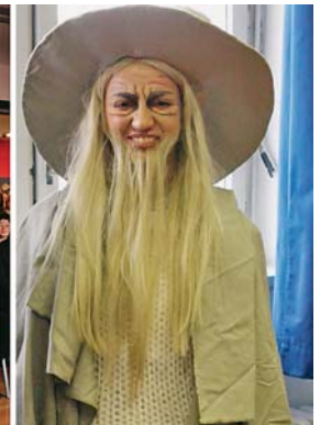
Sl.4 Modeli studenata TTF-a prikazani na Modnoj reviji

stveno-istraživačkog centra za Tekstil (TSRC-a), i to za najbolji znanstveno-istraživački rad u 2013./2014. Nagrada je dodijeljena dr.sc. Jacqueline Domjanić .