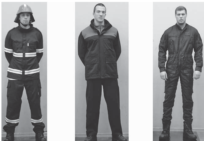
Sl.4 Presentacija modela funkcionalne odjeće hrvatskih proizvođača: a) vatrogasno dvodijelno odijelo (jakna i hlače) za gašenje požara otvorenog prostora Pyroman-X2D; b) vodonepropusna jakna i hlače izrađeni od troslojne tkanine; c) vatrootporni kombinezon izrađen od NomexComfort® tkanine

Sveučilištu u Zagrebu, Tekstilno-tehnološkom fakultetu za naručitelje Ministarstvo unutarnjih poslova RH i Ministarstvo obrane RH.