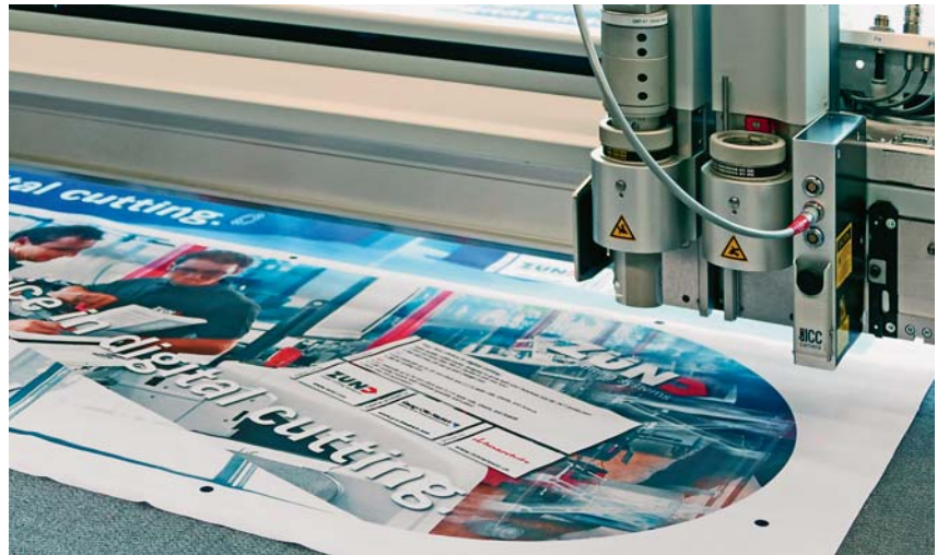
Sl.1 ZÜND stroj za iskrojavanje G3 točno po konturama

ZÜND u sajmu Texprocess vidi idealnu platformu mrežnog povezivanja koja se stvara zbog istovremenog održavanja sajma Techtexil. Informacije o novom materijalu za iskrojavanje iz ponude tehničkih tekstilija stručnjaci mogu dobiti iz prve ruke i također mogu uspostavljati nove kontakte s kooperantima iz tog područja.