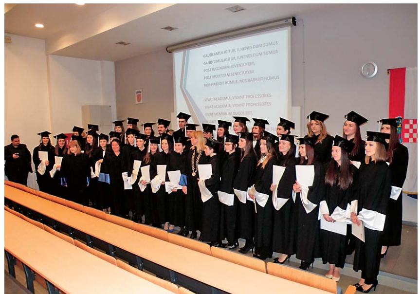
Sl. 3 Svečana promocija prvostupnika na TTF-u