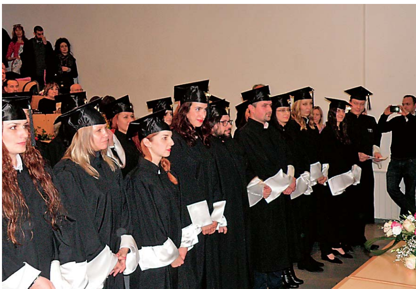
Sl.2 Svečana promocija diplomiranih inženjera tekstilne tehnologije i inženjera