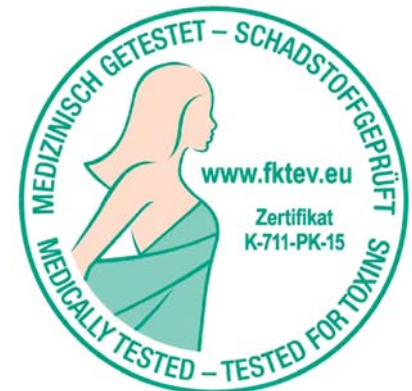
Sl.2 Oznaka ispitivanja FKT "Medicinski ispitano - ispitano na štetne tvari"

laze u dodir s kožom trebaju zadovoljavati najviše norme. Lenzing je načinio prvi značajan korak kad je TENCEL® vlakno dao na ispitivanje koje provodi udruga KFT – Körperverträgliche Textilien e.V. Tako je vlakno TENCEL® prvo vlakno za koje se može koristiti oznaka FKT - "Medicinski ispitano - ispitano na toksine". Iz tvrtke Lenzing tvrde da se san poistovjećuje sa zdravljem. Medicin-