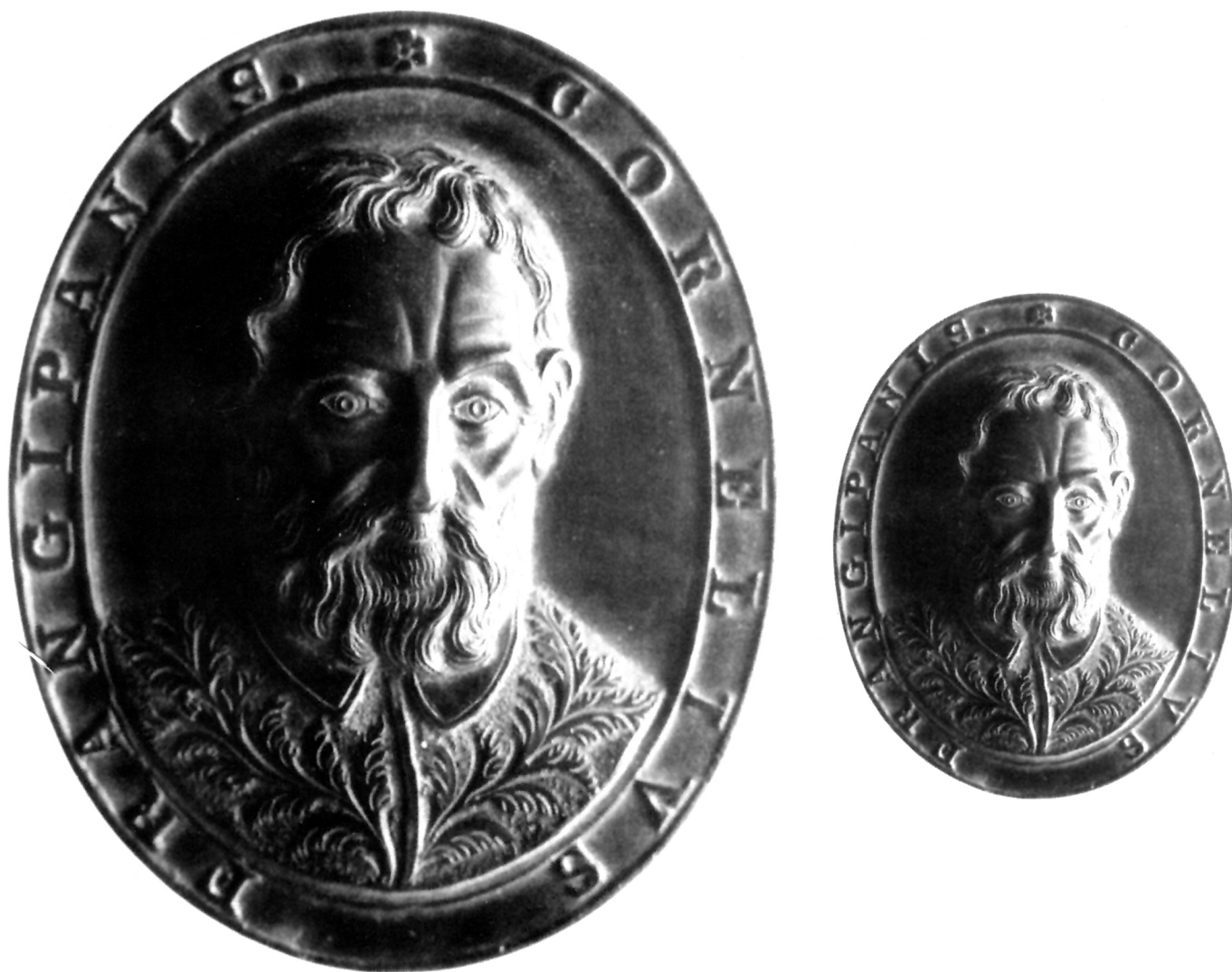
4. Medalja Kornelija Frangipane, Arheološki muzej, Zagreb (bronca, 61x75 mm) /The Cornelio Frangipane medal, Zagreb Archaeological Museum/ (bronze, 61x75 mm)