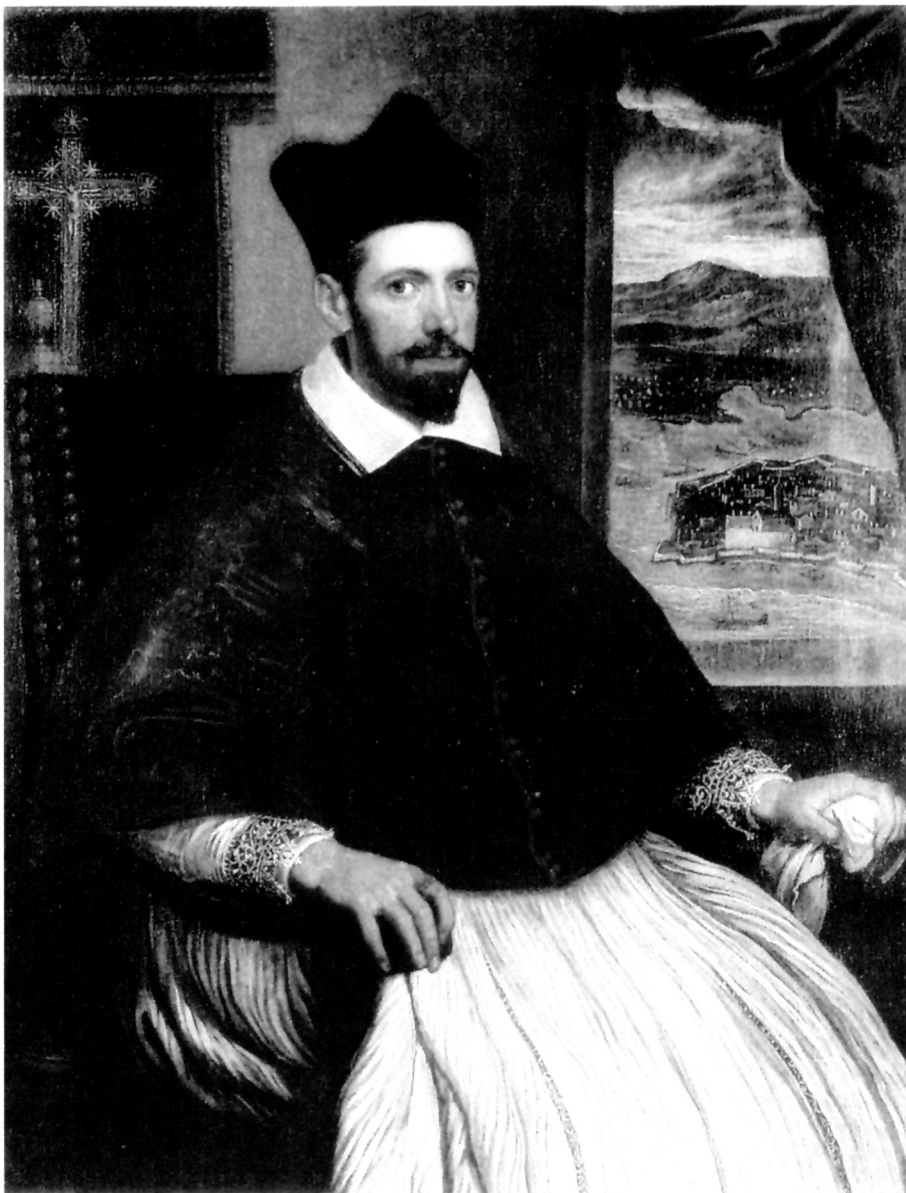
1. D. Tintoretto, portret zadarskog nadbiskupa Luke Stelle