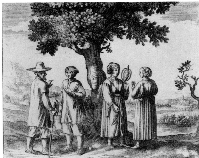
21. Istarska nošnja u Valvasorovo doba