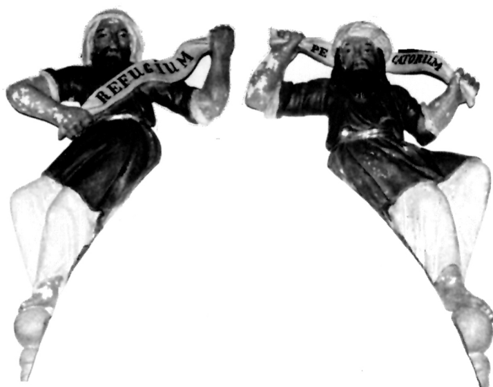
7. Starozavjetni proroci tijekom restauratorskog postupka