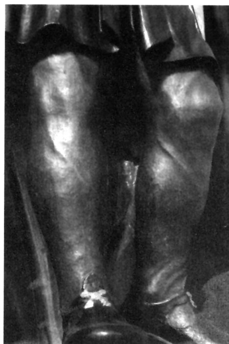
10. Detaj modelacije čarapa figure sv. Modesta(?)