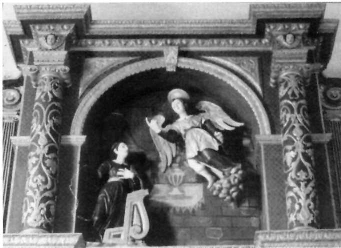
11. Prizor Navještenja