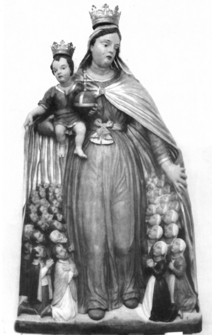
3. Kip Bogorodice Zaštitnice