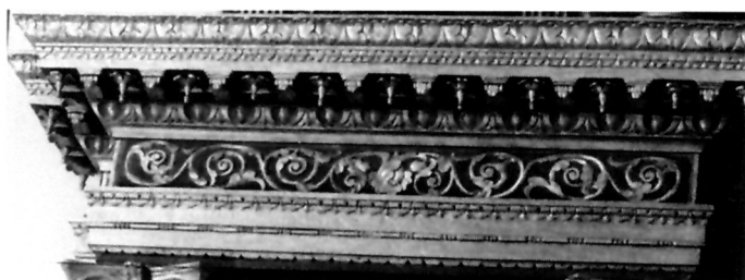
17. Ornamentika gređa