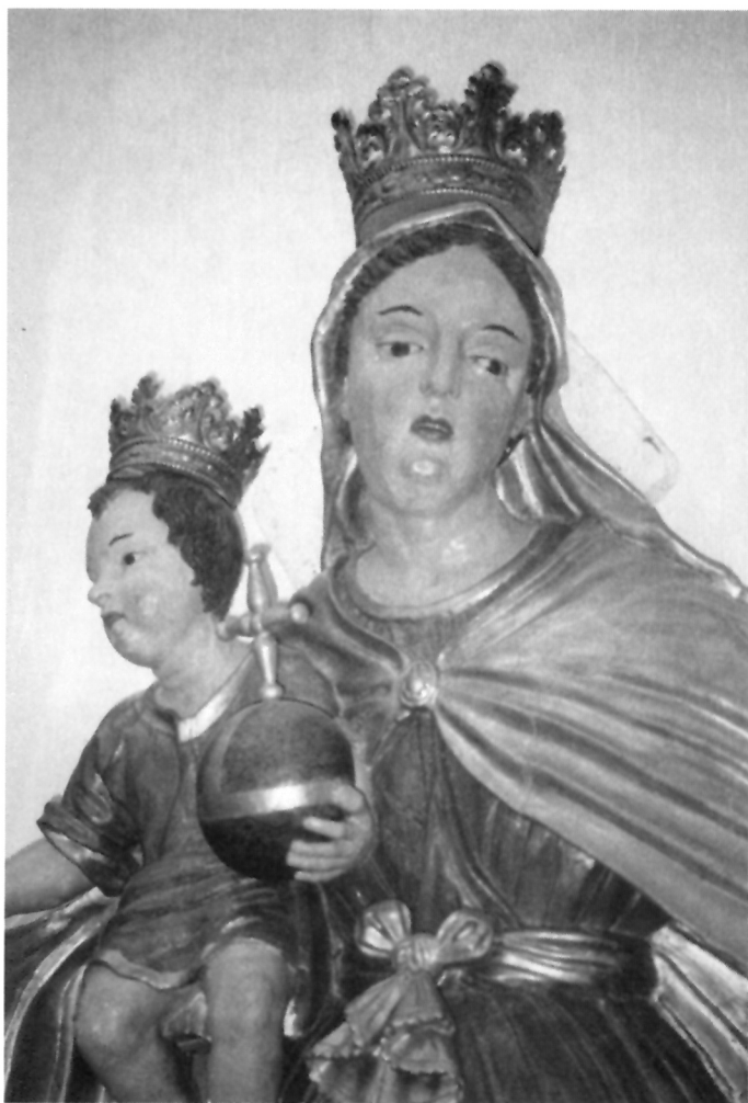
2. Kip Bogorodice Zaštitnice, detalj