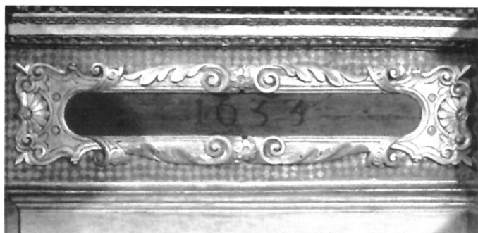
4. Kartuša s datacijom na predeli oltara