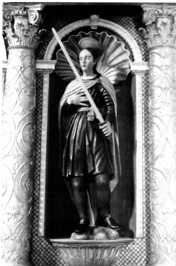
8. Kip sv. Vida, u niši desno od Bogorodice Zaštitnice