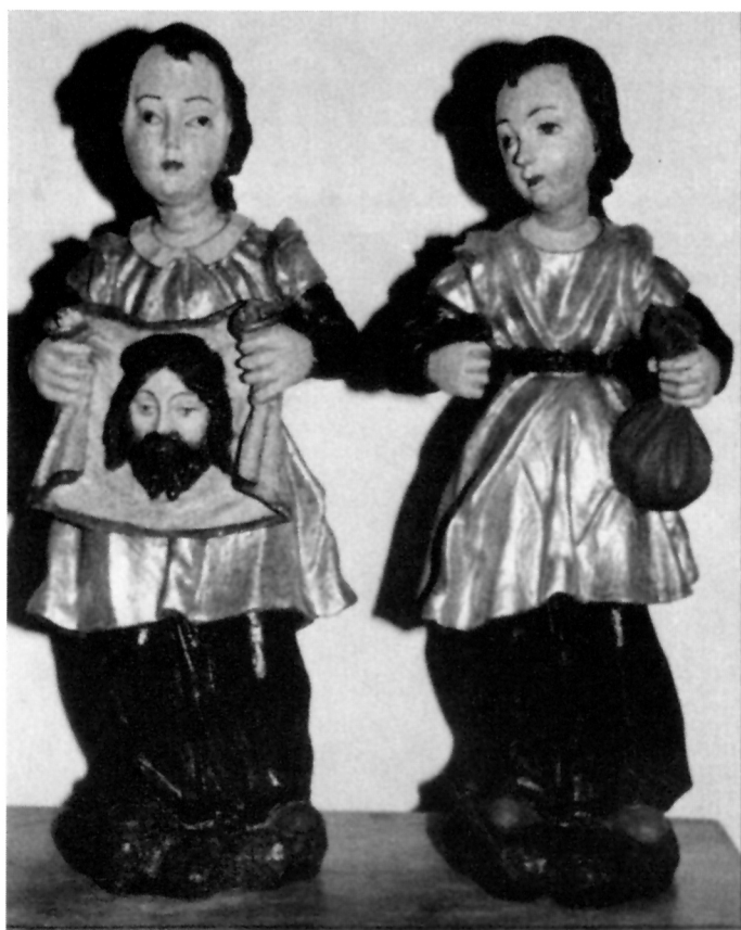
16. Anđeli sa simbolima Kristove muke