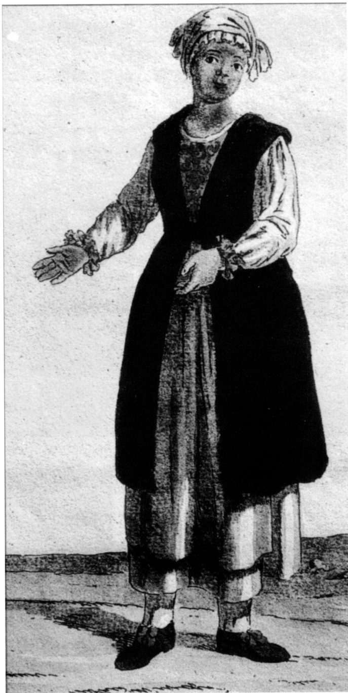
20. Seljanka sa Ćićarije, 19. st.