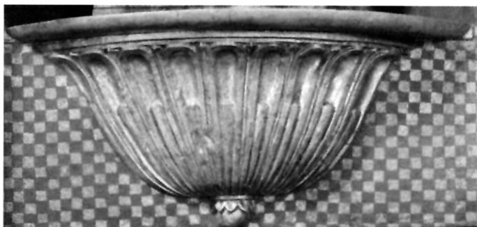
18. Detalji ornamentike i polikromije