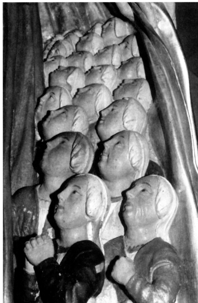
6. Vjernice pod Marijinim plaštem, tijekom restauratorskog postupka