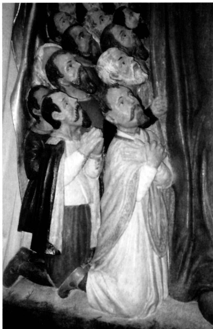
5. Vjernici pod Marijinim plaštem