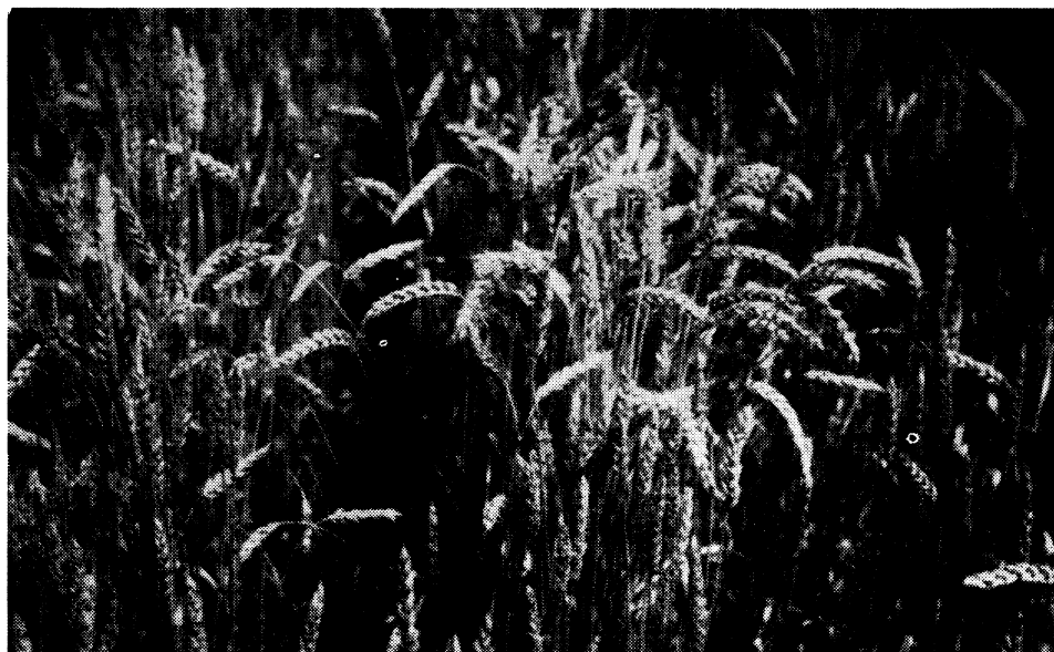
Slika 3 — Busevi pšenice Etoil de choisy sa povinutim i uspravnim klasovima na parceli »Erdovec«