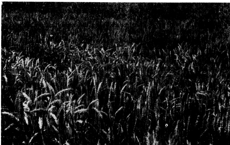
Slika 2 — Povinuti i uspravni klasovi nejednoličnog usjeva pšenice Etoil de choisy na parceli »Erdovec«