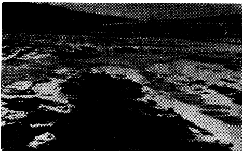
Slika 1 — Nejednolično topljenje snijega i zadržavanje vode na neuređenim oraničnim površinama

Duga zima sa dugim snježnim pokrivačem do 27. III 1962. te hladnije proljetno-ljetno razdoblje utjecalo je na produženje vegetacije pšenice preko 15 dana, tako da je zrioba sorte Etoil de choisy i Slavenke na parceli »Erdovec« došla krajem VII mjeseca.