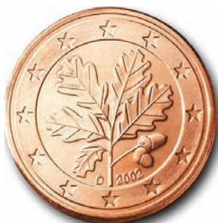
Slika 1. Njemački dizajn kovanice od 1, 2 i 5 centa prikazuje grančicu hrasta.

Već od samog početka nastanka prvih kovanica u grčkoj državi Lidiji, u maloj Aziji u VII. stoljeću prije Krista, a kasnije i novčanica, oblicima i motivima na njima posvećivala se velika pozornost, što dovoljno govori o komunikacijskoj