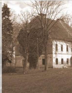
KURIJA PREČEC mjesto osnutka HSD 1846.