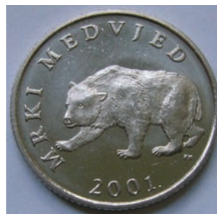
Slika 2. Mrki medvjed ( Ursus arctos ) je najveća divlja životinja i grabežljivac na tlu Hrvatske: kovani novac u apoenu od 5 kuna (naličje).

Iako nekoliko stotina godina starija, od primjerice slične discipline kao što je filatelija, numizmatika je manje raširen hobi u svijetu ponajprije većih financijskih izdataka koje