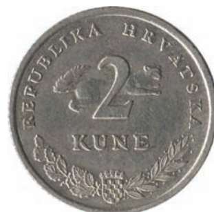
Slika 3. Kovani novac od 2 kune – lice: u središnjem dijelu brojčana oznaka i naziv novčane jedinice „2 KUNE“, a u pozadini prikaz kune zlatice (Martes martes) u trku nadesno, zvijeri iz porodice kuna, skupocjena krzna.

Hrvatska novčana jedinica kuna za trajnu hrvatsku valutu odabrana je 1994. zbog značajne uloge kunina krzna u monetarnoj i fiskalnoj povijesti Hrvatske, odnosno u skladu sa starim hrvatskim tradicijama. Povijest naziva novčane jedinice Republike Hrvatske kune počinje s krznom kune kao sredstvom naturalnog plaćanja: kunino krzno služilo je kao sredstvo plaćanja poreza zvanog kunovina u srednjovjekovnoj Slavoniji, Primorju, Dalmaciji; lik kune nalazio se od prve polovine 13. stoljeća pa gotovo do kraja 14. stoljeća na hrvatskom kovanom novcu zvanom banovci; kuna je bila potencijalni novac Banovine Hrvat-