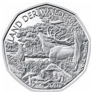
Slika 7. Austrijska kovnica novca izdala je 2011. srebrnu kovanicu od 5 eura u spomen na UN-ovu Međunarodnu godinu šuma.

Figure 7 The Austrian Mint issued 5-euro silver coin in honor of the 2011 United Nations Declaration, the „Year of the Forests“