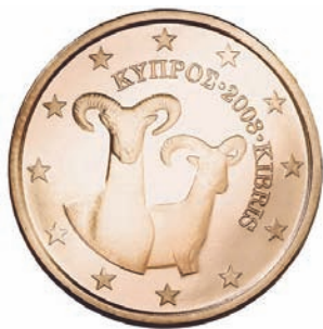
Slika 9. Euro kovani novac u optjecaju na Cipru prikazuje muflona, vrstu divlje ovce karakteristične za otok.

Figure 9 Euro coin in circulation in Cyprus show the species of wild sheep that is characteristic of the island, the mouflon.