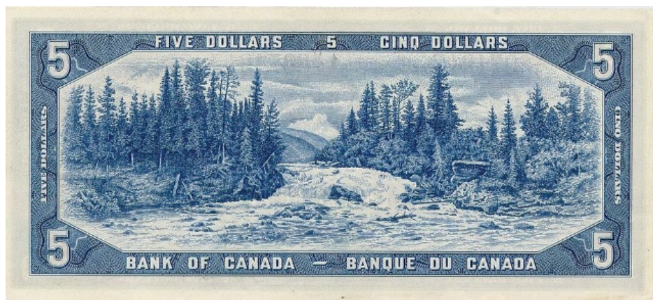
Slika 8. Novac ima kulturne, sociološke, povijesne, umjetničke, simboličke, tehnološke i druge vrijednosti.

Za očekivati je da će Hrvatska, po uzoru na zapadnoeuropske i druge države koje promiču vrijednost šuma, izdavati