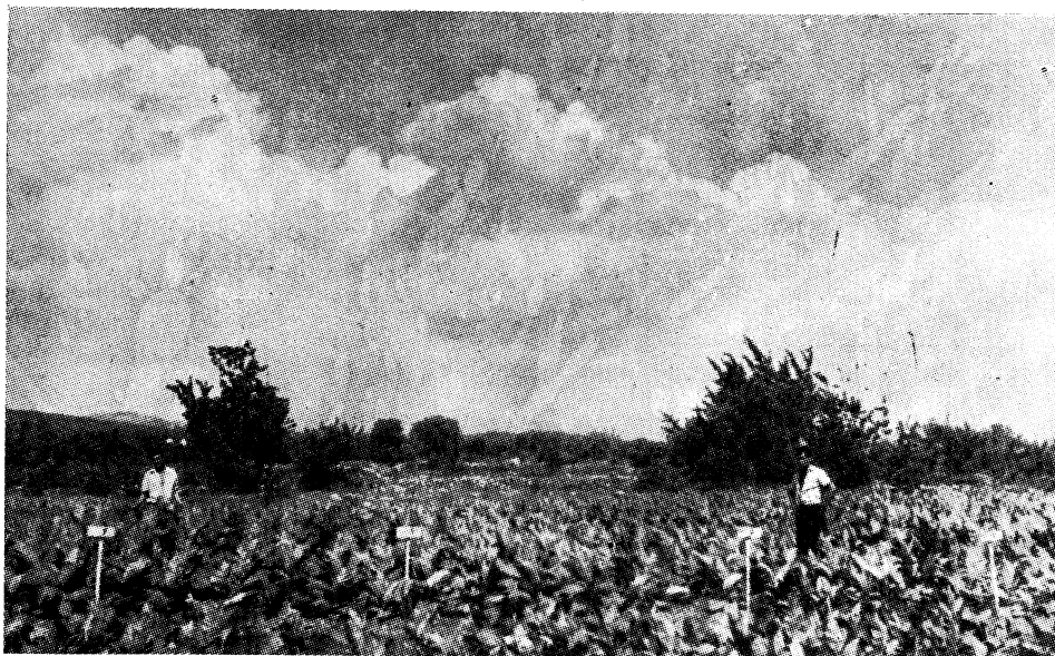
Slika br. 1 — Oglad sa meliorativnom fertilizacijom podmekote — desno negnojeno (kontrola) — lijevo (meliorativna gnojidba podmekote)

I. Oglad. Progresivno gnojenje fosforom i kalijem povoljno je djelovalo na kemijski sastav duhana, s obzirom da se pojedine organske komponente nalaze u harmoničnom sastavu. Posve obrnut slučaj je sa dušikom. Samo polovina doze N dala je kemijsku sliku duhana pogodnog kemijskog sastava, dok je normalna i povećana doza pridonijela pogoršanju kvaliteta duhana; uslijedilo je povećanje nikotina i ukupnog N, dok su smanjeni polifenoli i topivi šećeri.