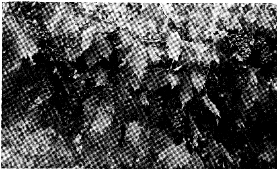
Sorta Sangiovese u nasadu necijepljene vinove loze, Peneta — Arezzo, star oko 100 godina

Sigurno će se pronaći i druge sorte vinove loze, otporne prema filokseri, kao i prema drugim bolestima i štetnicima, pogotovu ako se uvaži da filoksera nije više tako virulentna kao prigodom prve katastrofalne invazije u prošlom stoljeću. Osim toga, može se pretpostaviti da danas već priječe razvitak filoksera razne bolesti, paraziti, vremenske prilike ili suvremene