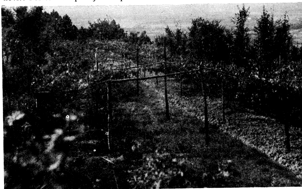
Pergole necijepljene vinove loze. Nasad Castellare — Arezzo, stariji od 80 godina*)

S tim u vezi se navode istraživanja koja su u toku, ili su pokazala stavite koristi kod primjene u praksi.