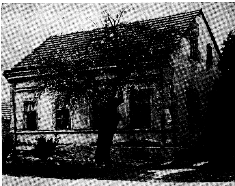
Slika 3 — U mikroklimi kajsija se ovdje razvila bujno i dugo živi

problemu. Nakon svih priprema, počam od elaborata do rigolanja zemljišta, izbora sorata, razmaka sadnje i ostale kompleksne problematike, postavljena je prva plantaža kajsija u Podravini na obroncima Bilogore na staništu Stara Gora, nedaleko mjesta Novigrad Podravski, gdje je od prije rata bio voćni i lozni rasadnik. Za to stanište odlučilo se iz mnogih razloga, jer se tu radi o prosječnom voćarskom terenu, najbolje prikupljenim podacima o tlu i klimi, a stručni kadar za uzgoj i praćenje imao je iskustvo. Rezultate, koji su najviše interesantni, iznosimo na slijedećoj tabeli.