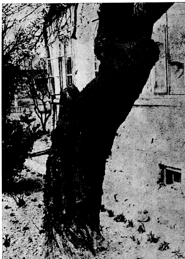
Sl. 2 — I pored većih mehaničkih oštećenja, nema na ovom stablu pojave smole toga stalnog pratioca stabla kajsije

Na ovom primjeru se vide značajne karakteristike: da je stablo cijepljeno u drvu, da je staro preko 54. godine (po sjećanju), da je mikroklima ušćuvala stablo i pored velikih oštećenja (odsijecanje) osnovnih grana.