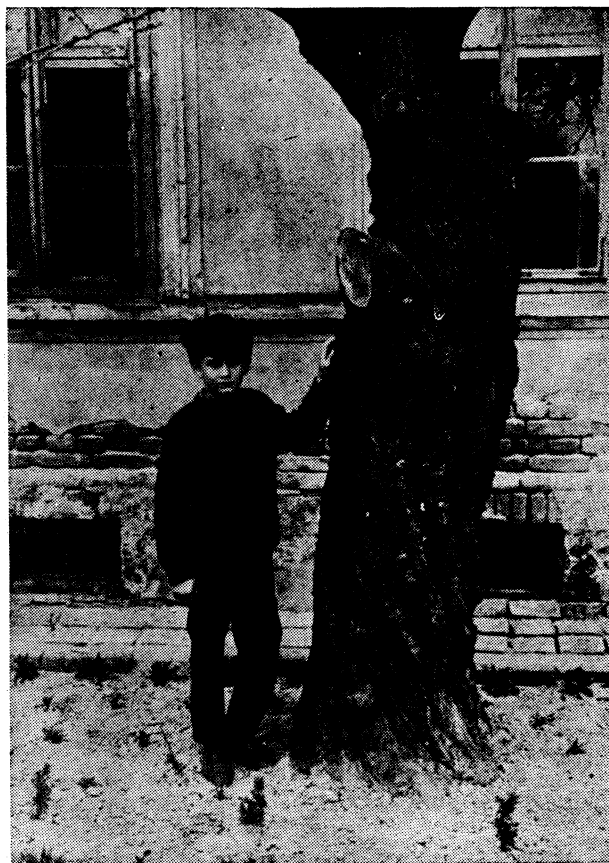
Sl. 1 — Kajsija u Podravini. Jasno izraženo mjesto cijepljenja u visini glave dječaka

— Mikroklimatski uvjeti i tereni zaštićeni od vjetra imaju veći broj stabala kajsije. Nisu rijetki primjerci stabla starih i 50 godina, kao što pokazuju slike u prilogu.