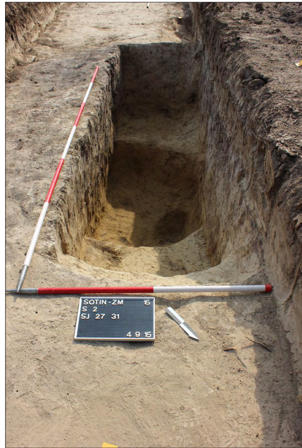
Sl. 5 Sotin – Zmajevac, ukop kasnosrednjovjekovne zemunice SJ 27, 31.

Fig. 4 Sotin Srednje polje – Vašarište, work space with furnaces SU 953, 955.