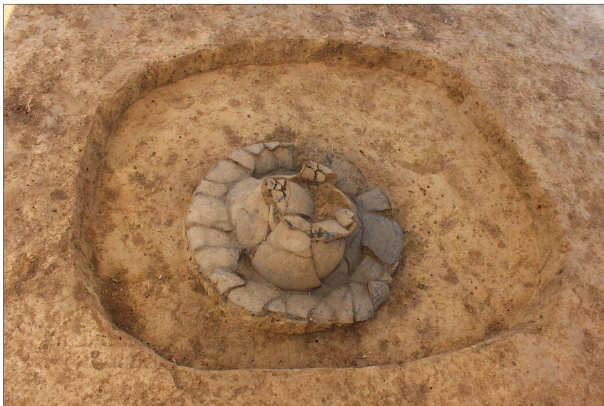
Sl. 3 Sotin Srednje polje – Vašarište, grob 121.

U sondama 1, 2 i 3 otkriveno je nekoliko struktura iz razdoblja kasnoga srednjeg vijeka. U zapadnom dijelu sonde 1 otkriven je dio podruma kasnosrednjovjekovnoga nadzemnog objekta koji se sastojao od dvije prostorije. Istočno od ostataka podruma pronađeno je nekoliko rupa za stupove kao i jama s nalazima kasnosrednjovjekovne keramike. U sondi 2 otkriven je kanal i jedna veća zemunica iz razdoblja kasnoga srednjeg vijeka te nekoliko manjih jama. U sondi 3, koja se nalazila jugoistočno od prve dvije sonde, pronađeni su rubni dijelovi kasnosrednjovjekovnoga naselja kojemu pripadaju ukopni rupa za stupove, zatim jame te ostaci peći.