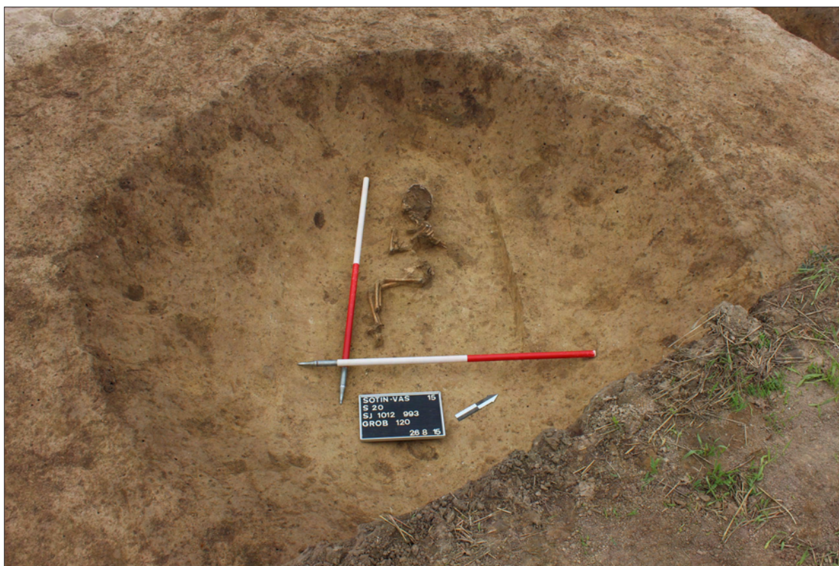
Sl. 2 Sotin Srednje polje – Vašarište, grob 120.