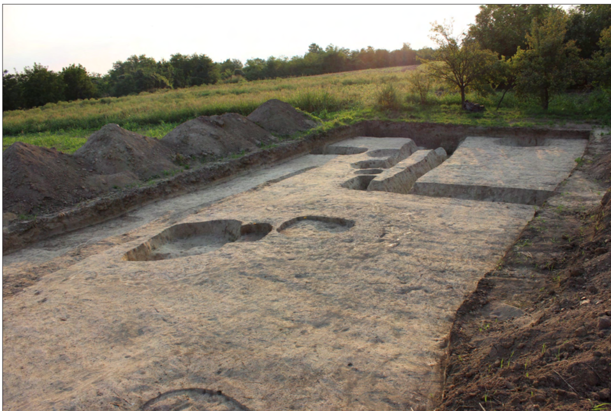
Sl. 1 Sotin Srednje polje – Vašarište, sonda 20 – pogled s jugozapada.