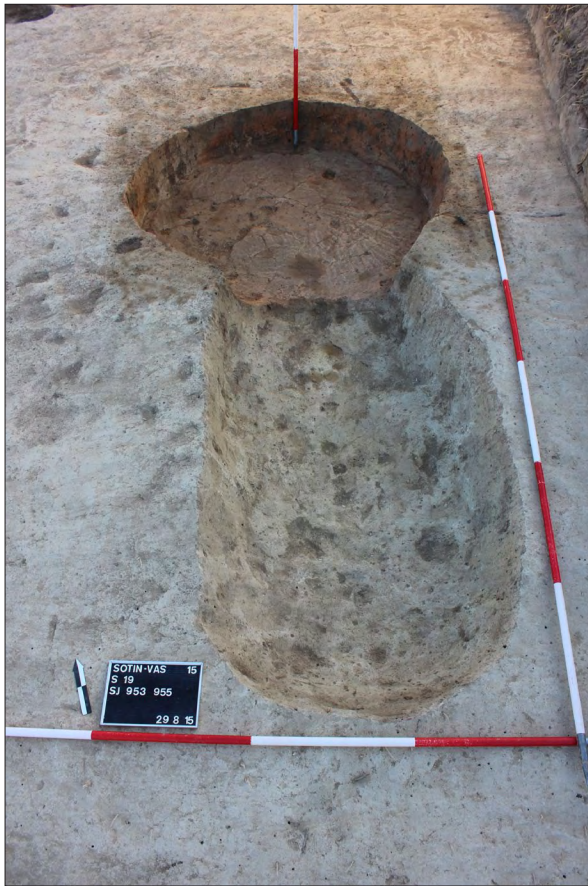
Sl. 4 Sotin Srednje polje – Vašarište, radni prostor s peći SJ 953, 955.

Fig. 4 Sotin Srednje polje – Vašarište, work space with furnaces SU 953, 955.