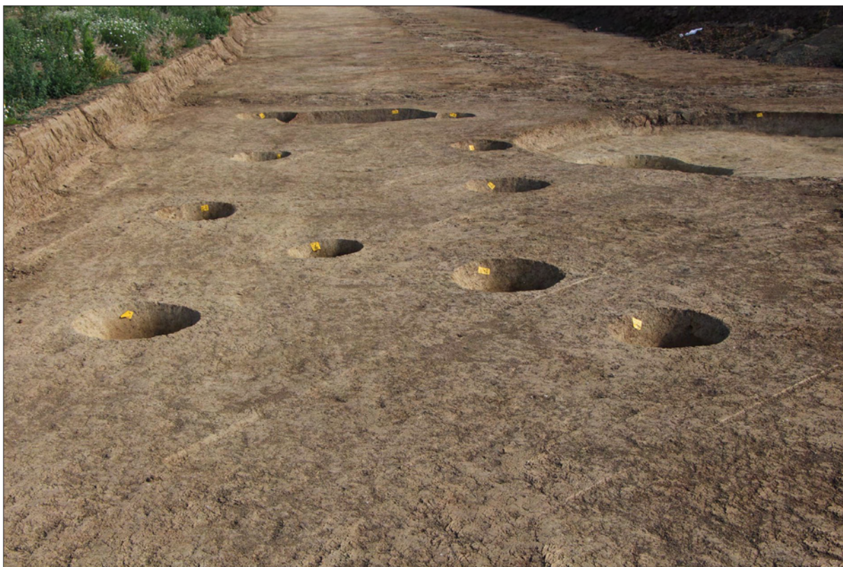
Sl. 5 Ukopi rupa za stupove kuće.

Fig. 5 Postholes for a house.