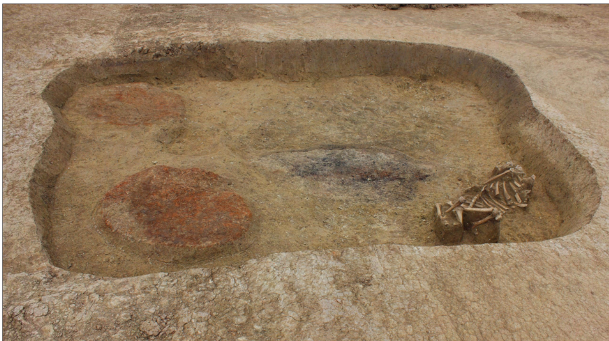
Sl. 2 Poluzemunica SJ 26 s ognjištima i ukopom goveda.

Fig. 1 The position of the AN 3B Beli Manastir – Sedmitar site.