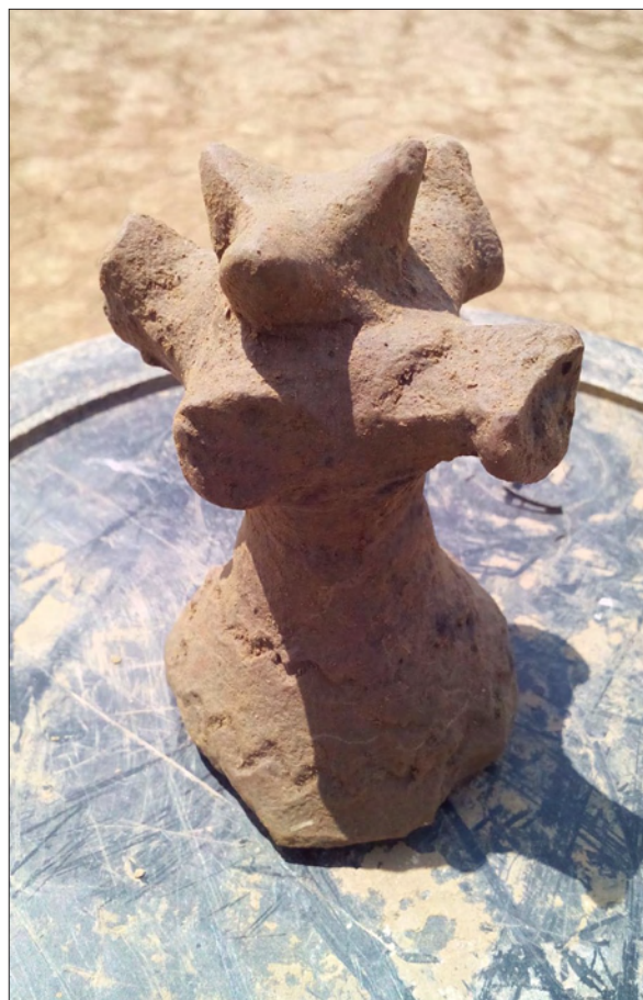
Sl. 6 Vrh pećnjaka?.

U zaštitnim arheološkim istraživanjima nalazišta AN 3B Beli Manastir – Sedmitar otkriveni su ostaci kasnosrednjovjekovnog/ranonovovjekovnog naselja koje se vjerojatno sastojalo od nekoliko obitelji koje su naselile blaga uzvišenja uz koja su nekada tekli manji vodotoci. Izuzetno je zanimljiva infrastruktura naselja s ostacima kuća pravokutnih osnova od kojih su preostali pravilno raspoređeni ukopi rupa za stupove. Uz kuće su se nalazile jame koje su sadržavale najviše pokretnih arheoloških nalaza koji i omogućavaju datiranje naselja u kasni srednji/rani novi vijek.