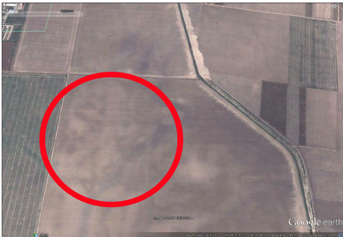
Sl. 1 Položaj nalazišta AN 3B Beli Manastir – Sedmitar.

Fig. 1 The position of the AN 3B Beli Manastir – Sedmitar site.