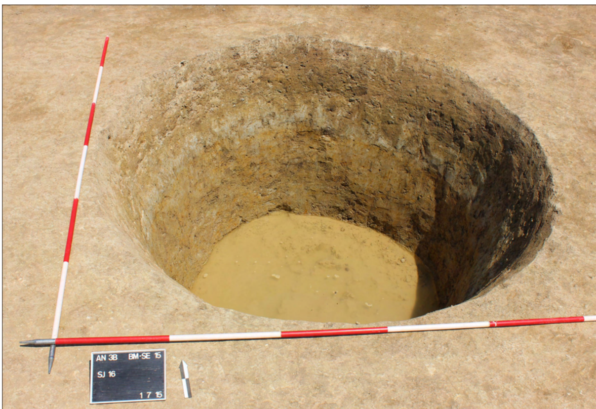
Sl. 4 Bunar SJ 16.