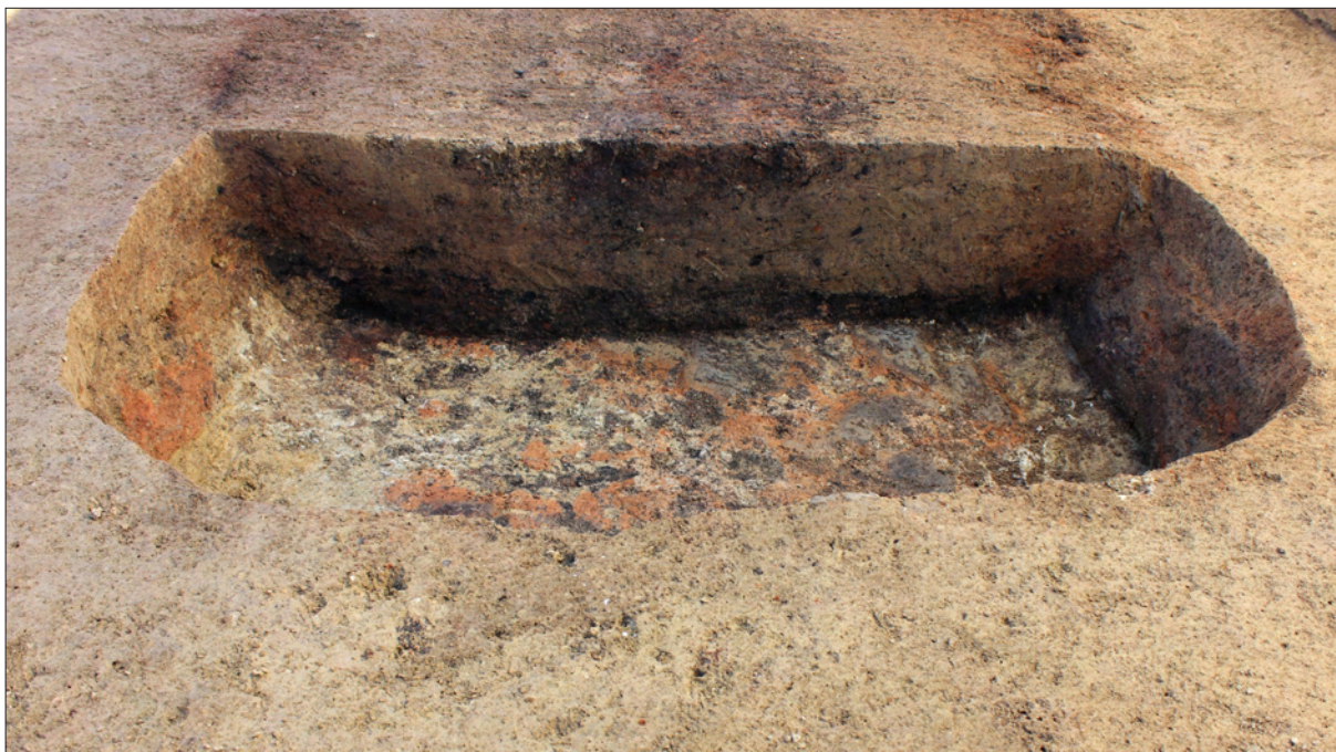
Sl. 3 Jama SJ 30.