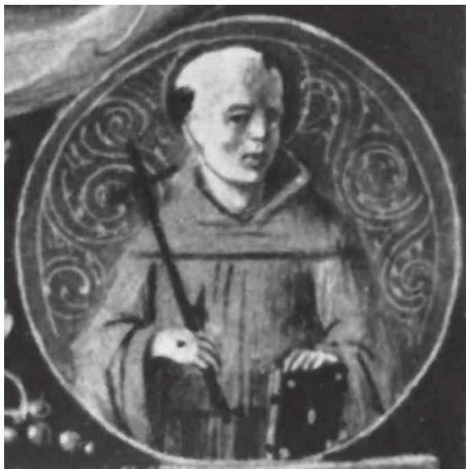
5 Commissione di Leonardo Loredan a Francesco Garzone (1508., Berlin, Kupferstichkabinett, 78.C.30), detalj

Od oslikanih službenih dokumenta izvrstan primjer za usporedbu je Commissione di Leonardo Loredan a Francesco Garzone iz 1508. godine (Berlin, Kupferstichkabinett, 78.C.30) koji se smatra Bordonovim vlastoručnim djelom. Svetački likovi karakterističnih fizionomija upalih obraza