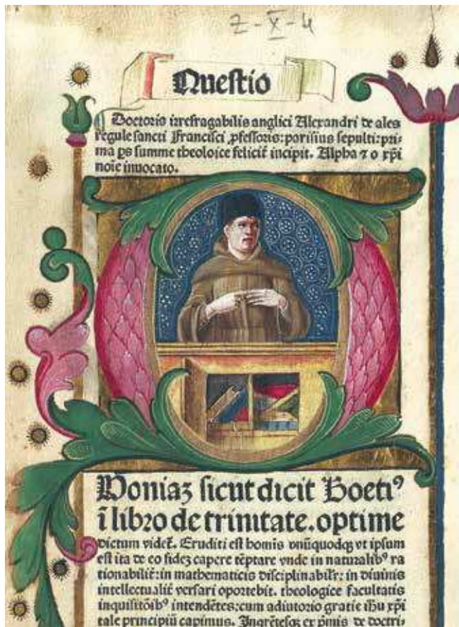
1 Alexander de Hales, Summa universae theologiae (Anton Koberger, Nürnberg, 1482.), samostan sv. Frane, Šibenik Alexander of Hales, Summa Universae Theologiae (Anton Koberger, Nuremberg, 1482), Monastery of St Francis, Šibenik