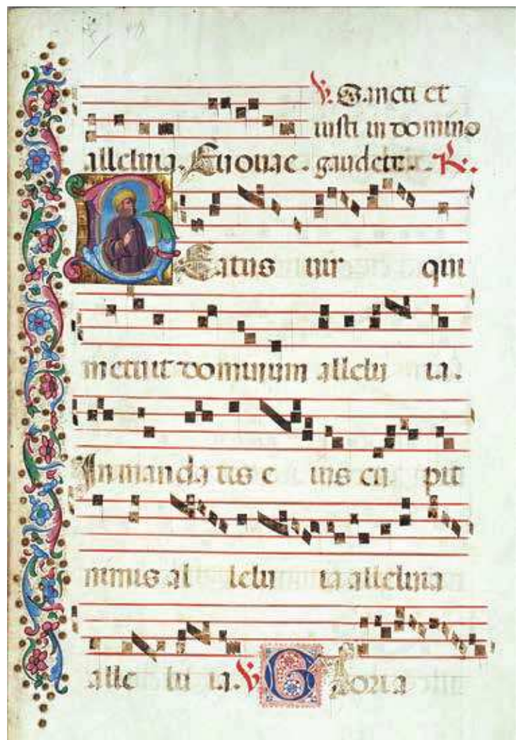
7 Stranica s likom Proroka (New York, Columbia University, Plimpton MS 40 H /1-8/, fol. 7; http://servlet1.lib.berkeley.edu:8080/imgwindow/?url=http://nma.berkeley.edu/ark:/28722/bk00093526w&caption=&extent=f.+7 )

ljubičastoj, crvenoj i boji ciklame. Benedetto Bordon i njegova radionica ukrašavali su minijaturama matrikule mnogih venecijanskih bratovština što ukazuje na njegovu popularnost među svim društvenim slojevima i kategorijama naručitelja. Minijatura na pergameni s prikazima tri sveca identificirana kao sv. Ivan Krizostom, sv. Onofrije i sv. Agata (Philadelphia, Free Library of Philadelphia, ms. Lewis EM 48,17) koja je vjerojatno pripadala matrikuli venecijanske bratovštine bojadisara u gestama i fizionomijama likova također je bliska šibenskoj inkunabuli a isto se može kazati i za matrikulu bratovštine sv. Sakramenta s prizorima Krista u kaležu i sv. Grgura i sv. Lovre pripisanu Bordonovoj radionici (London, The British Library, Add. Ms 17047) te matrikulu bratovštine sv. Sakramenta s prizorom Krista u kaležu iz crkve sv. Dvanaestorice apostola (Venecija, Archivio parrocchiale, Archivio storico del patriarcato, f. IV) koje su uokvirene i prije opisanim vrstom dekorativnog okvira s lisnatim i cvjetnim motivima. 15 Pripisana mu je i stranica s prikazom Raspeća koja se čuva u Museo Civico Amedeo Lia (La Spezia), datirana u vrijeme početka 16. stoljeća, s tipičnim skulptorskim likovima Marije i sv. Ivana evanđelista