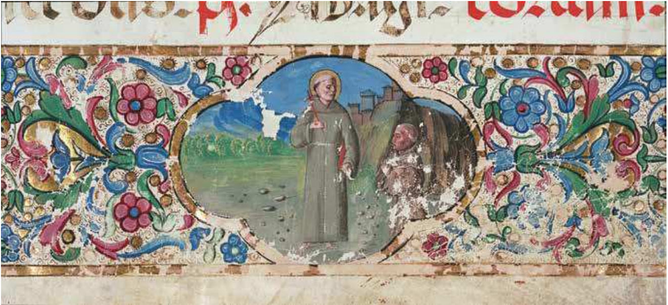
6 Stranica s prikazom sv. Frane s franjvcem, detalj (New York, Columbia University, Plimpton MS 40 H /1-8/, fol. 1; http://servlet1.lib.berkeley.edu:8080/imgwindow/?url=http://nma.berkeley.edu/ark:/28722/bk000934n66&caption=&extent=f.+1,+detail )

Page with the figure of St Francis adored by a Franciscan, detail (New York, Columbia University, Plimpton MS 40 H /1-8/, fol. 1)