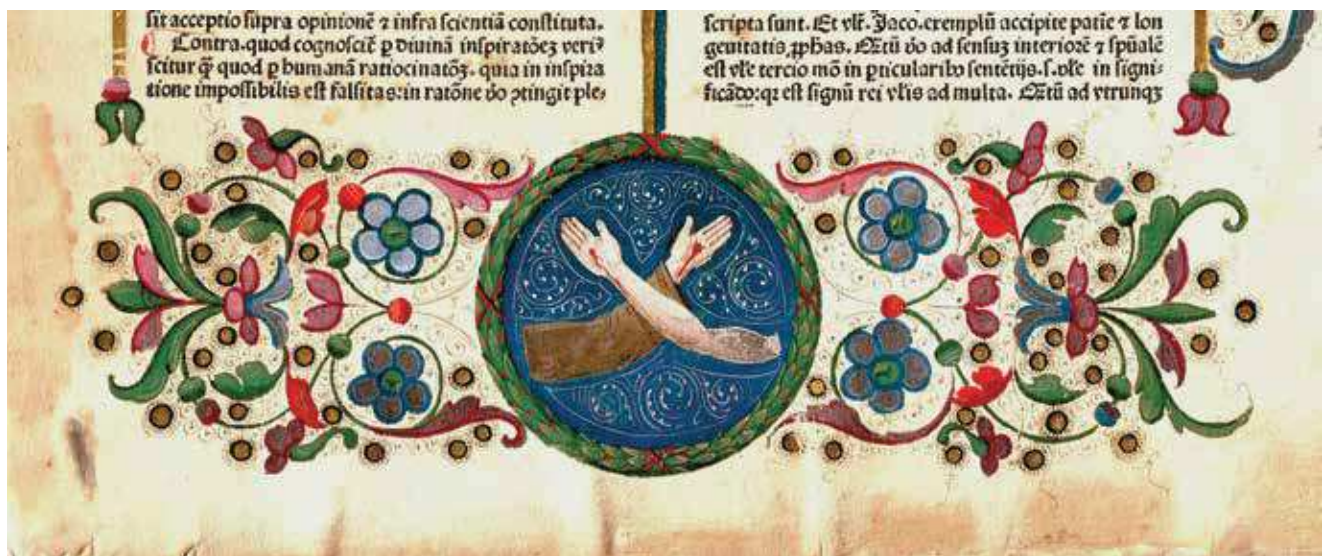
2 Alexander de Hales, Summa universae theologiae (Anton Koberger, Nürnberg, 1482.), samostan sv. Frane, Šibenik, detalj Alexander of Hales, Summa Universae Theologiae (Anton Koberger, Nuremberg, 1482), Monastery of St Francis, Šibenik, detail